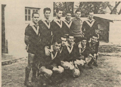
Equipa do Beira Mar, na época de 1957/58

«A violência no futebol tem que acabar! A minha receita é esta: o primeiro expulso,