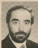
Antero Gaspar, governador civil de Aveiro