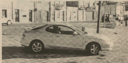
locking final do Hyundai Coupé.

A frente foi alvo de renovação e o capor foi redesenhado, dando ao carro uma tônica desportiva. Nas partes laterais não foram introduzidas alterações de maior. No entanto, não gostáramos das palas existentes junto das rodas dianteiras, que em nossa opinião retiraram um pouco de garra desportiva ao Hyundai Coupé. De referir que na parte dianteira, com o novo desenho do para-choques, surgem novos espalhadores, que na condução nocturna, oferecem uma excelente luminosidade. Na traseira, surgiram uma série de alterações, nomeadamente, a tampa da mala, os faróis, surgindo uma ponteira de escape. As jantes de liga leve vêm enriquecer o