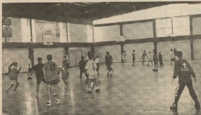
Oito horas a jogar andebol