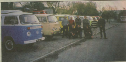
Alguns dos elementos que participaram no primeiro encontro do Clube Pão de Forma de Portugal

Do encontro informal, que decorreu no par-