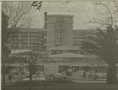
Está a circular pelas caixas postais um E-mail que denuncia uma alegada violação no Hospital Infante D. Pedro, em Aveiro