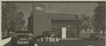
Aveiro dispõe de um novo stand da Land Rover

Para experimentar este tratamento, que lhe pode proporcionar uma maneira mais agradável de perder peso e ganhar em saúde e qualidade de vida, pode dirigir-se a uma das 24 clínicas, dispersas por todo o país, ou informar-se através do número 234 421 421.