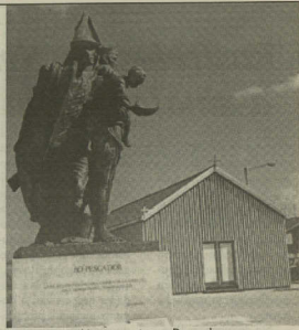
Monumento ao Pescador

Com uma população de cerca de 8000 habitan-