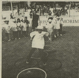
A autarquia espera motivar os alunos para as actividades físicas

Refira-se que a ideia de um concerto nacional da música portuguesa surgiu na sequência de um debate televisivo sobre o incumprimento, por parte das rádios, da quota legalmente prevista de 40 por cento para a música portuguesa.