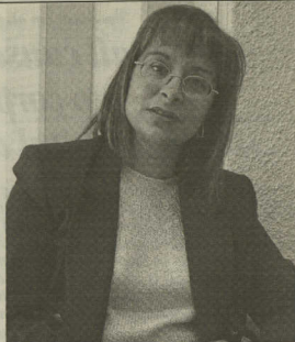
As instituições têm de se unir, filtrar os projectos apresentados e apoiar os melhores

CA – Sim, essa é outra área importante. As delegações regionais foram criadas para apoiar, de certa maneira, toda a actividade amadora, porque o Ministério da Cultura tem instituições para apoio às actividades profissionais, e houve a necessidade de criar as delegações regionais que não têm o mesmo âmbito que as outras direções regionais dos outros ministérios, são diferentes.