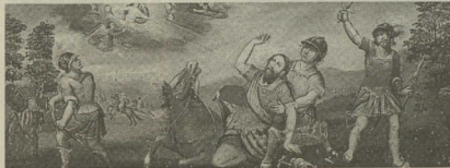
Retábulo em talha dourada, datado do século XVIII, da Igreja da Mamarrosa

O facto de a freguesia, que já tem mais de mil anos não estar dotada de Zona Industrial, de feiras, de parques temáticos faz o autarca considerar que «há uma falta de olhar para a fre-