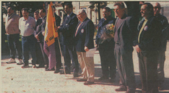
Confrades durante a homenagem aos heróis de Portugal, no jardim público de Ílhavo