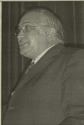
Hospitais precisam de maior investimento humano e articulação de meios

«O tratamento do dor aguda e do crónica - duas vertentes da anestesia - está em franco desenvolvimento»