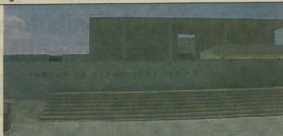
A Agrovouga abre ao público no próximo sábado, no novo recinto de feiras aveirense

É que, por falta de verba, os concursos da raça Frísia, que todos os anos decorrem na Agrovouga, não vão po-