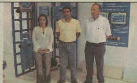
A nova loja da Aqualuz, na Estrada Nacional 109, em Aveiro, e os responsáveis pela estrutura