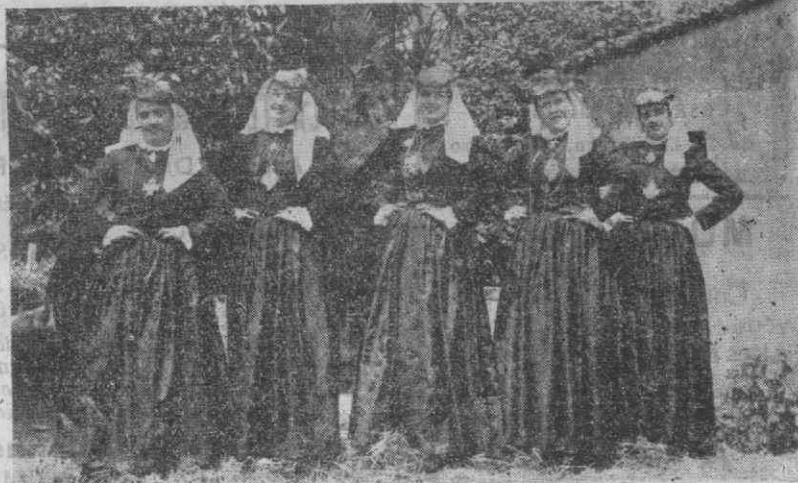
Este magnífico Quinteto Vocal Feminino — "Como elas cantam em Paços de Brandão" — colabora nas Festas da Cidade, apresentando-se, no Teatro Aveirense, no dia 9, sexta-feira, às 21,45 horas.

Após este acto solene, seguem para a Sé, onde começam, imediatamente, as cerimónias do Pontifical.