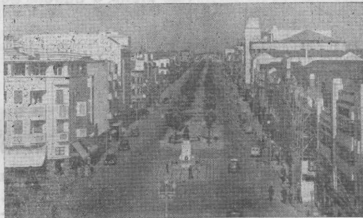
A bela Avenida do Dr. Lourenço Peixinho, que liga a estação do caminho de ferro ao centro da cidade

A EXPOSIÇÃO DOCUMENTÁRIA das actividades do CLUBE DOS GALITOS, que foi solenemente inaugurada no dia 12, estará patente ao público até ao próximo domingo, dia 23.