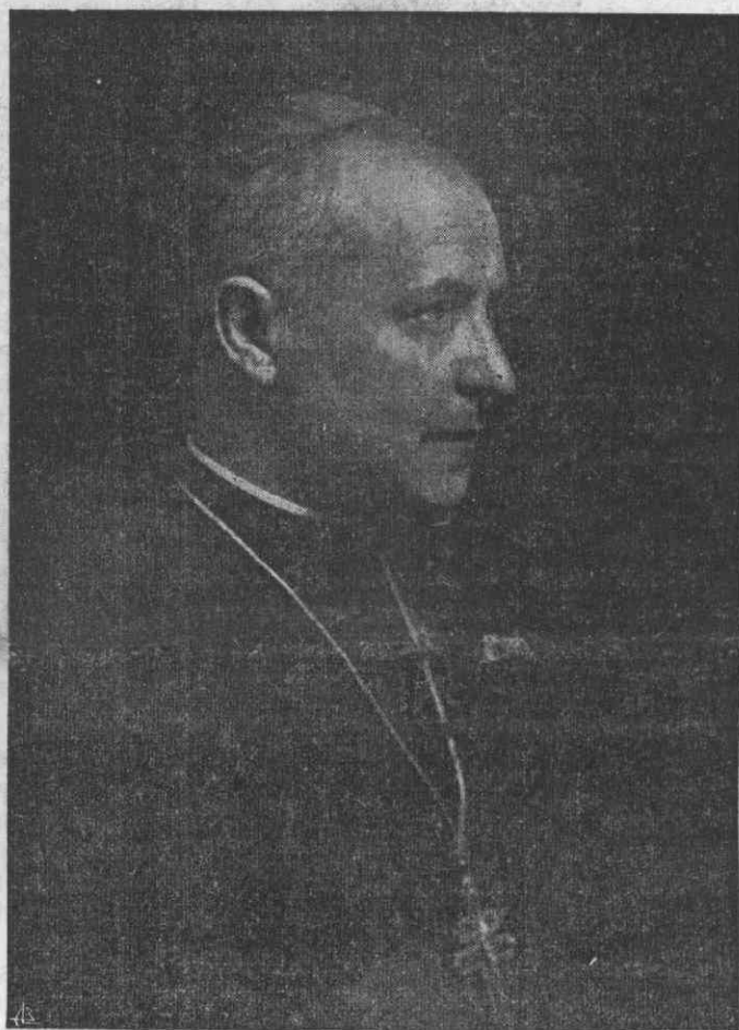
D. Manuel Gonçalves Cerejeira

Erguendo Igrejas, amparando a Imprensa Católica, promovendo Congressos Eucarísticos e dirigindo superiormente o movimento salvador da Acção Católica Portuguesa, Sua Eminência tem espalhado pelo país inteiro vasta sementeira