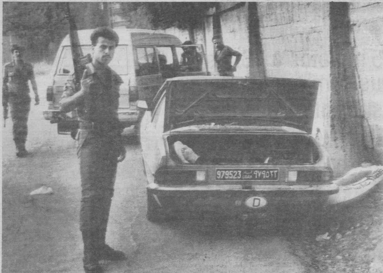
LIBANO — Este o carro onde foram encontrados os corpos de 4 palestinianos mortos com tiros na cabeça. Apesar das propostas da Síria para a paz, a violência continua a fazer parte do quotidiano naquele país.