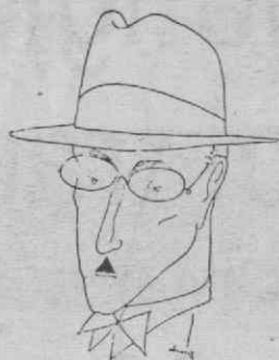
(Pessoa, desenho de Almada Negreiros).

«Há uma porção de grandes poetas locais que se resentem de não ter sido nada numa encarnação pretérita e de agirem na anamnésia dis-