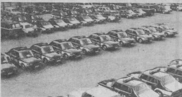
ANIVERSÁRIO — Para comemorar o aniversário do CSCU, a polícia finlandesa quis ter tudo em ordem. E para isso tratou de verificar centenas de carros, que vemos na foto já depois das inspecções mecânicas.