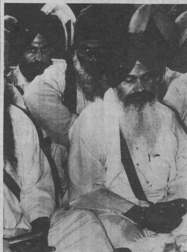
PAZ NO PUNJAB — Depois de difíceis conversações, a paz no Estado do Punjab (Índia) foi aprovada. Na foto o líder sikh em plena meditação... mas bem guardado.