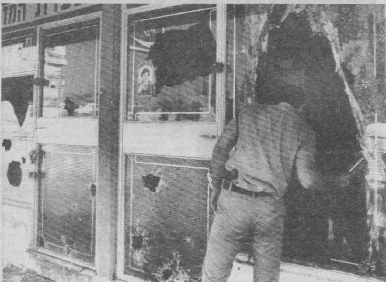
ISRAEL — Um polícia observa o interior de um restaurante, através de uma janela estilhaçada. Tudo consequência da descoberta dos corpos de dois professores judeus.

Dirigindo-se aos grupos de peregrinos em seis línguas, o Papa cumprimentou em italiano um grupo de escuteiros finlandeses, dizendo: «Não sei falar finlandês. É um grande defeito. Tenho que começar a estudar».