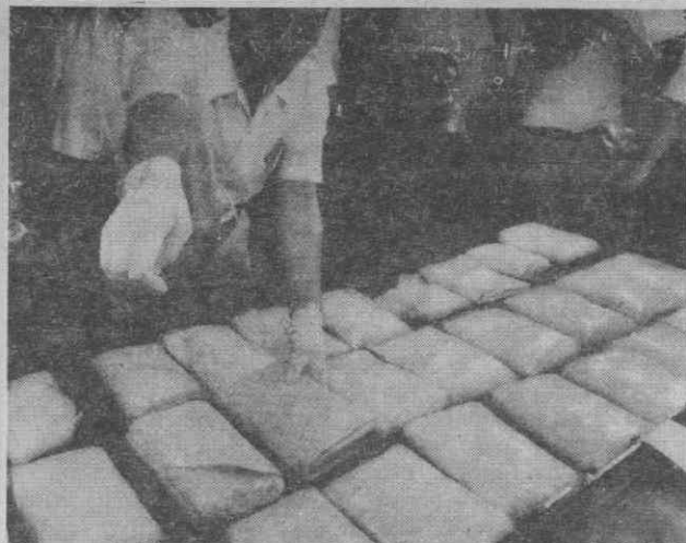
DROGA — Um investigador da polícia de Tóquio examina a droga apreendida a um japonês e um sul- coreano. Com um peso total de 25,6 quilos, o seu valor ascende a cerca de 21,3 milhões de dólares...