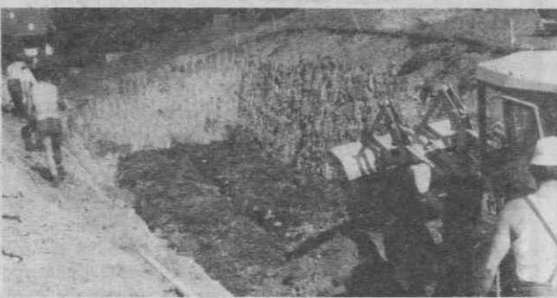
AINDA A TRAGÉDIA EM ITÁLIA — Uma escavadora enterra numa vala comum vários caixões de vítimas não identificadas do desabamento da barraem de Stava.