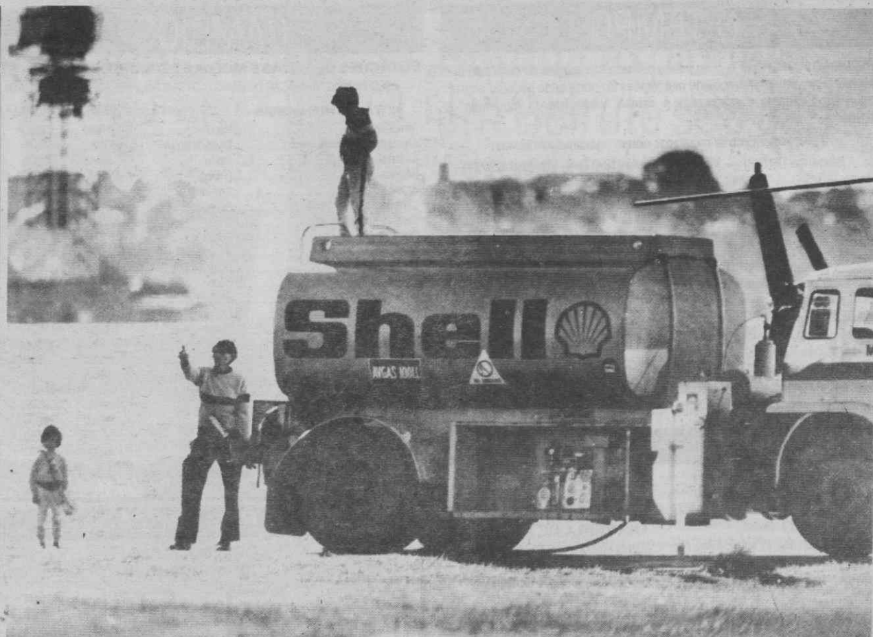
LOUCURAS — Um homem armado e retendo duas crianças como reféns dialoga com a polícia australiana. Ele ameaçava fazer explodir o autotanque de gásóleo. Depois de 6 horas de cerco, a loucura acabou na prisão.

No concerto de sexta-feira, os fãs do rock arremessaram moedas, pedras e insultos para o cantor britânico Boy George, que actuava pela primeira vez na Grécia.