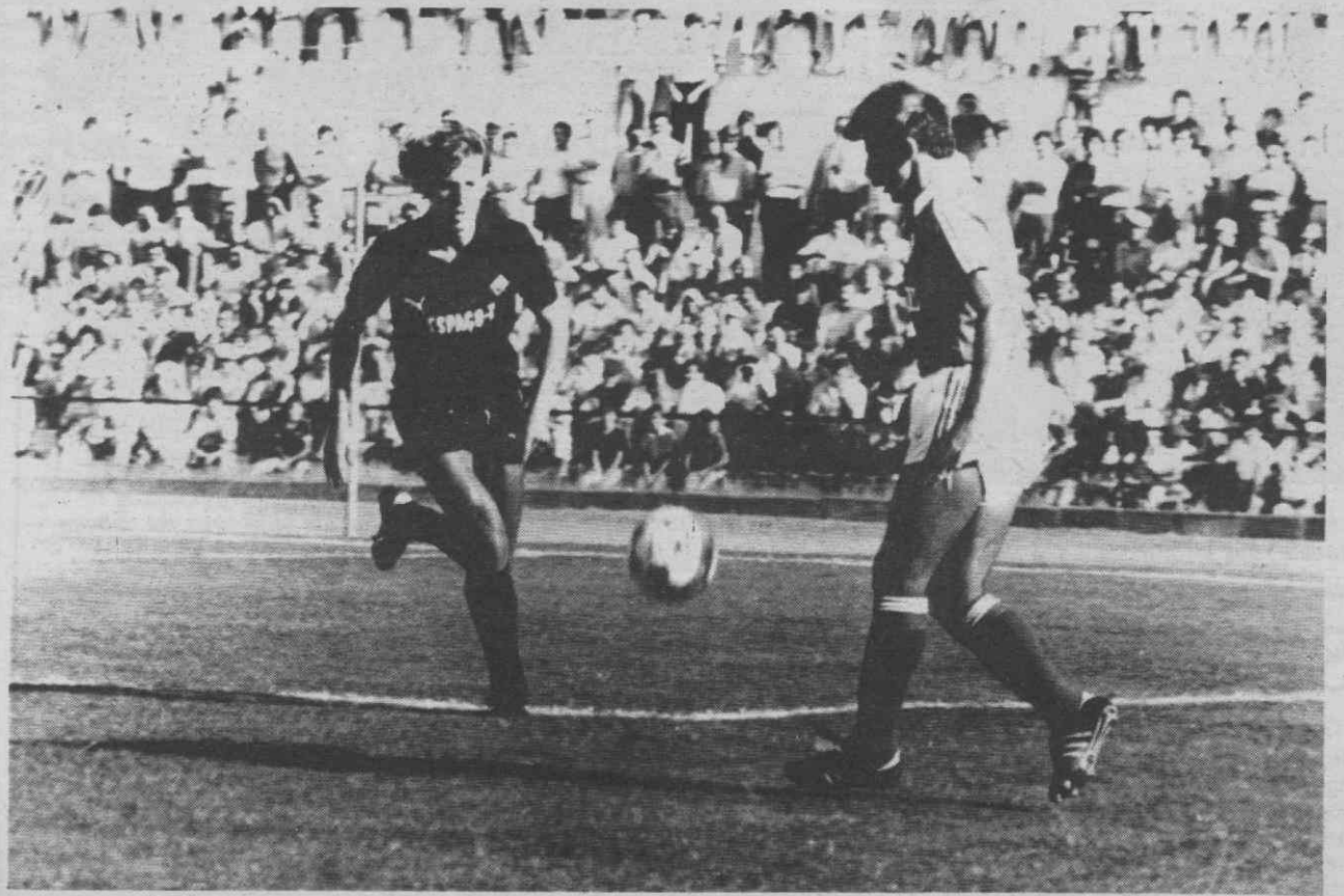
Dois jogadores em disputa do esférico. O lance viria a pertencer ao academista.

Estádio Municipal «José Bento Pessoa», na Figueira da Foz.