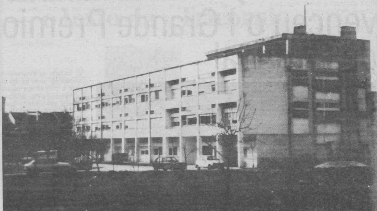
O Hospital Distrital de Pombal, em cujos terrenos anexos se edificará o novo Centro de Saúde de Pombal.