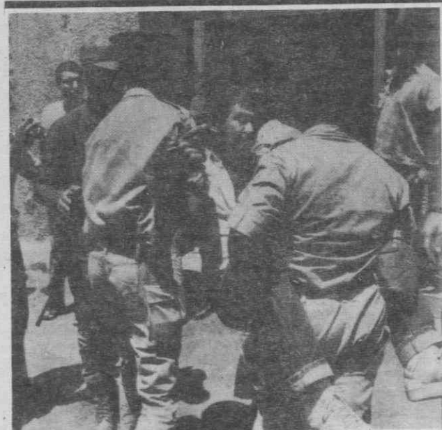
INCIDENTES EM ISRAEL — Dois polícias transportam um judeu para a esquadra, após tumultos que se seguiram à descoberta dos corpos de dois professores judeus desaparecidos.

Estava marcada para ontem, em Helsínquia, uma manifestação a favor dos direitos humanos, antes das cerimónias do aniversário dos acordos que se realizam amanhã e quarta-feira.