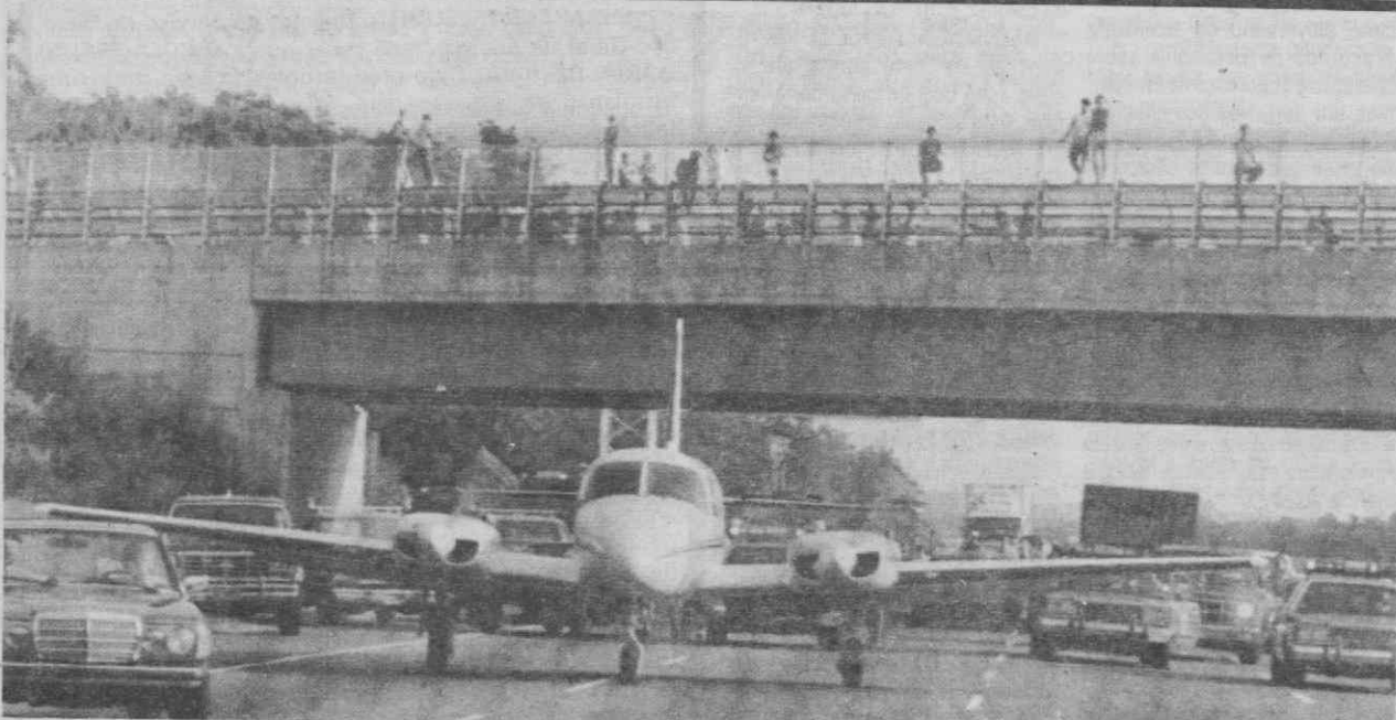
GRANDE PERÍCIA — Em consequência de avaria na sua avioneta, o piloto teve a perícia e o sangue frio necessário para fazer uma aterragem forçada em plena auto-estrada. E mais: depois das reparações-necessárias voltou a descolar. Realmente, nos EUA acontece de tudo...

«Os Miseráveis» de Victor Hugo e uma série de filmes baseados em novelas de George Simenon sobre o inspector Maigret.