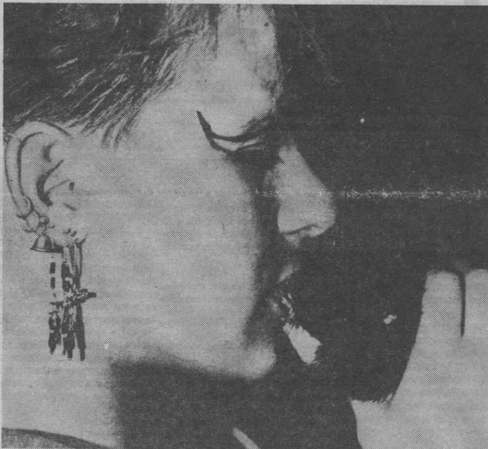
ESTOCOLMO — Concurso de ratos. Na foto o vencedor com a tratadora que tem um ar todo punk.

O responsável pelo pavilhão português espera recuperar o prejuízo sofrido e pensa importar nova quantidade de queijo para ser vendido na «Feirinha da Previdência», que se realizará brevemente.