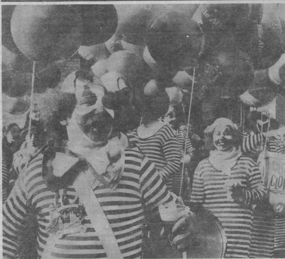
COLÓNIA — ALEMANHA FEDERAL — Começo dos festejos do Carnaval.

A «Frente Libanesa» não participou nas negociações entre as milícias cristãs e muçulmanas realizadas no mês passado e tem criticado o acordo de paz alcançado.