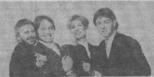
Eis Ringo Starr, na companhia de Eric Stewart, Linda e Paul McCartney. Para ele, ser avô foi o melhor que lhe aconteceu.

O ex-baterista dos Beatles, Ringo Starr, avô aos 45 anos, disse numa entrevista ontem publicada que nunca se sentiu tão feliz como agora, apesar de o seu novo álbum não ter sido considerado suficientemente bom para edição.