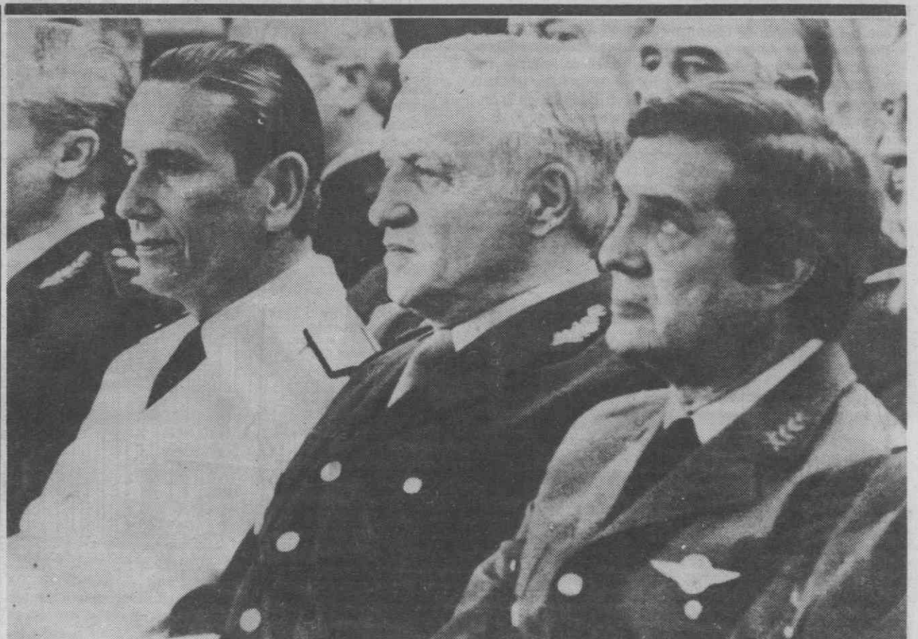
BUENOS AIRES — Os três membros da Junta Militar que conduziu a guerra das Malvinas contra a Inglaterra durante o julgamento em que são acusados de negligência, general Galtieri, general Lami Dozo e almirante Jorje Anaya.

Nesta reunião concluiu-se pela dinamização e reorganização da classe, com vista a refazer a sua anterior estrutura sindical (SETA), que interesses considerados alheios desmantelaram.