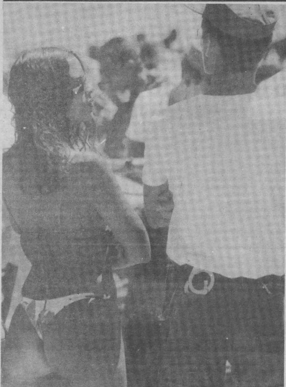
RIO DE JANEIRO — Uma esbelta «carioca» exibindo o seu reduzido bikini (vista de costas) dando largas à imaginação dos «machos latinos». Os bikinis brasileiros são este ano mais reduzidos e ousados que nunca.