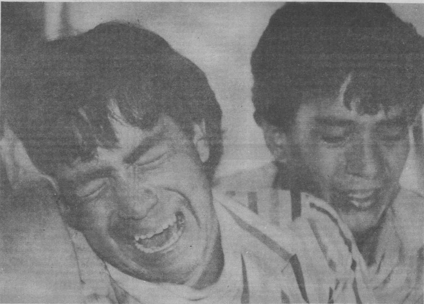
ARMERO — Grande plano de dois irmãos chorando convulsivamente ao visitarem a casa onde morreram 5 membros de sua família devido à erupção do vulcão Nevado Del Ruiz.

O vulcão Nevado Del Ruiz, que devastou a cidade colombiana de Armero, matando cerca de 25 mil pessoas, poderá entrar novamente em erupção, numa «explosão colossal», provocando uma avalanche de cinzas quentes — revelou ontem um ministro francês.