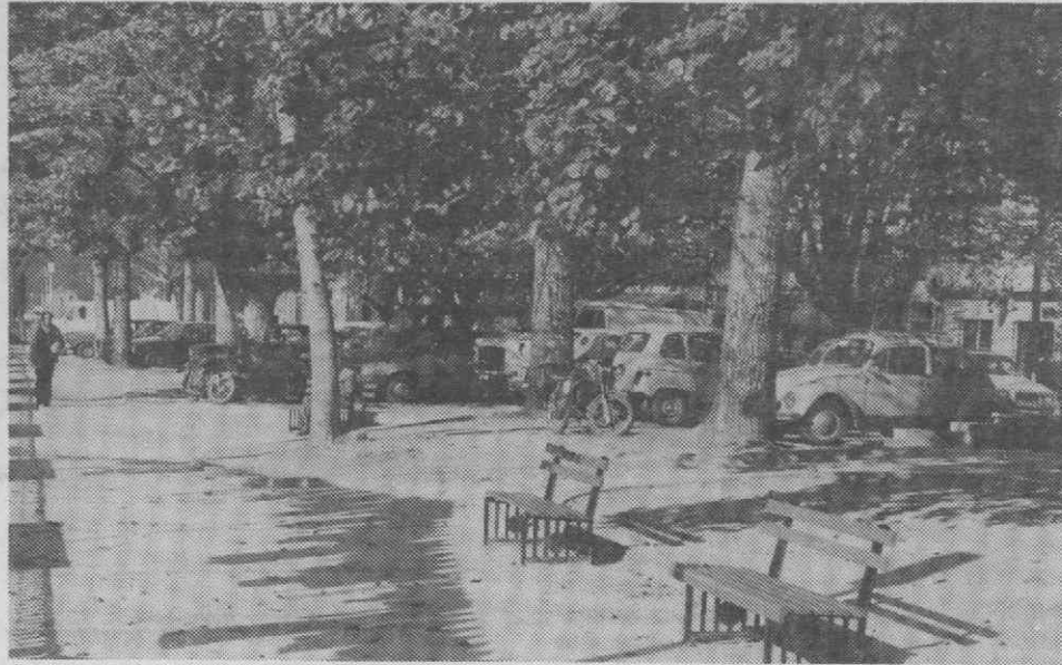
O Jardim do Largo Elísio Sucena é um dos «parques de estacionamento» de Águeda

A entrada em funcionamento do parque subterrâneo dos novos Paços do Concelho pode, quanto a nós, também contribuir para um melhor ordenamento no estacionamento naquela zona, porém, o estado actual dos seus acessos não convida os automobilistas a utilizarem aquele espaço. Um dos «parques de estacionamento» mais concorridos de Águeda situa-se no jardim do Largo Elísio Sucena, junto ao Posto de