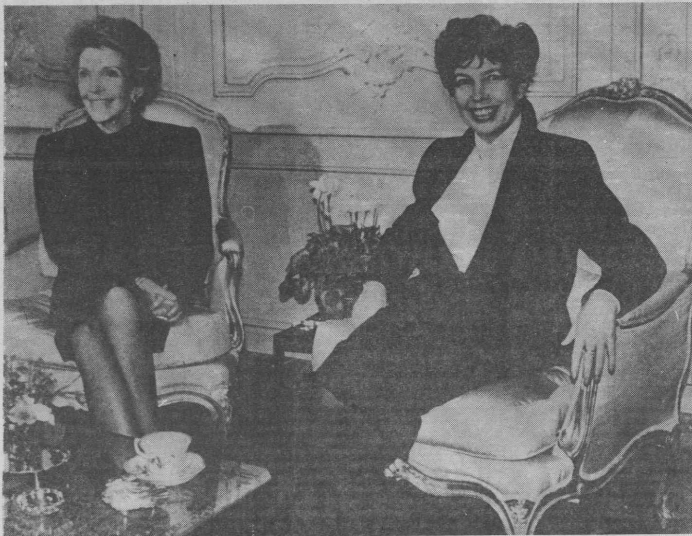
GENEVA — Nancy Reagan e Raisa Gorbachev tomam chá.

Reagan informará o Congresso norte-americano dos resultados da cimeira ainda antes de enfrentar a imprensa mundial em Washington.