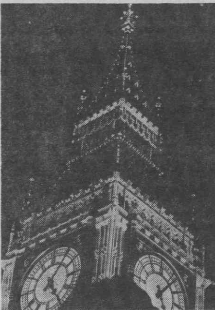
LONDRES — Aspecto da torre do famoso «Big Ben» toda iluminada.