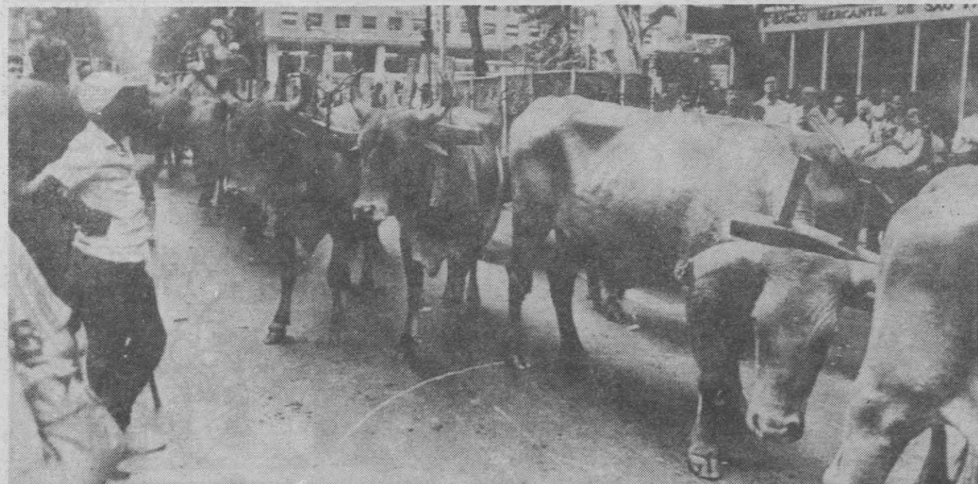
RIO DE JANEIRO — Aspecto de um verdadeiro desfile de bois no centro da cidade, marcando a abertura da exposição agrícola estadual.

A autoria do ataque foi reivindicada pelas Células Comunistas Combatentes (CCC), um grupo belga que levou a cabo 27 atentados à bomba nos últimos 14 meses.