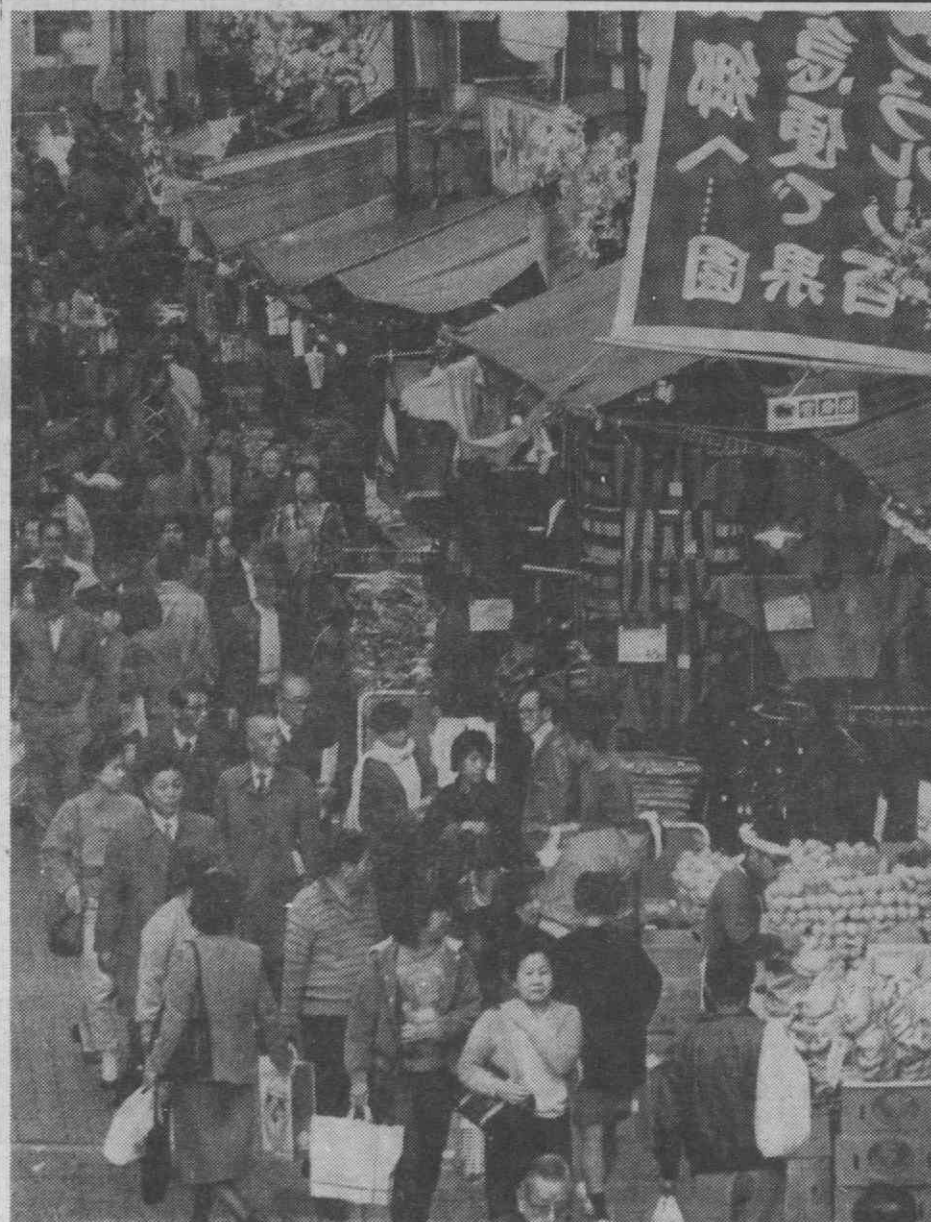
TÓQUIO — Aspecto de uma das ruas da cidade, repletas de consumidores, que chegam a atingir o bonito número de 120 milhões.