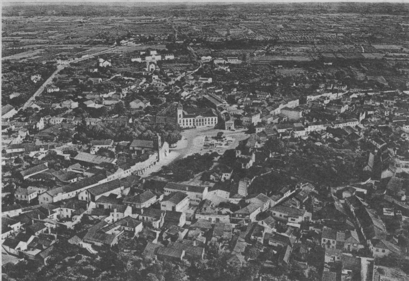
Uma panorâmica aérea (parcial) de Cantanhede ficando ao fundo a Norte da via férrea a Nova Cantanhede em embrião.

Do muito projectado no Plano de Actividades da Câmara Municipal para 1986 para a sede e seu concelho, de uma Edilidade que construiu e reconstruiu 102 quilómetros de estradas na vasta rede de mais de 300 quilómetros da sua jurisdição administrativa, em 1985, atente-se que no plano