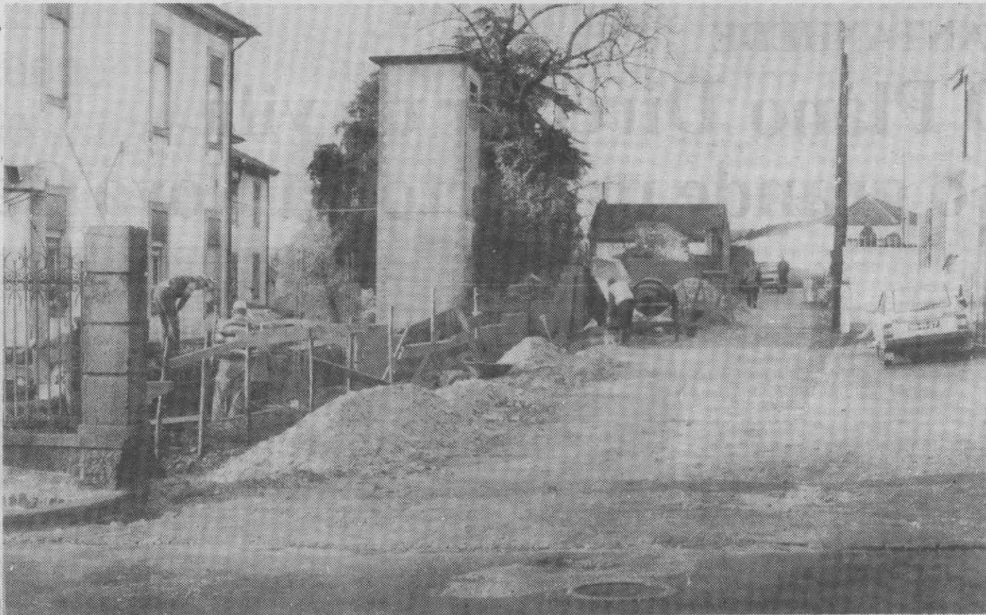
Aspecto dos trabalhos na Rua do Caldeireiro

Concluídas as obras, mais um dos graves problemas que Águeda sente no que respeita ao ordenamento do trânsito terá sido resolvido.