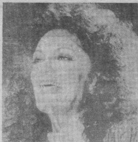
MIAMI — Foto de arquivo da cantora Connie Francis que foi internada num Centro de Saúde Mental, após ter sido evacuada do hotel onde se encontrava por bombeiros, a pedido da policia.