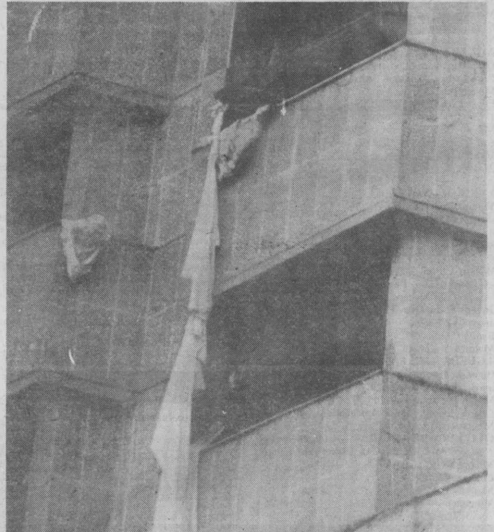
NOVA DELI — Cordas improvisadas com lençóis usadas pelos hóspedes do hotel para fugirem às chamas.

A gerência do hotel foi entretanto processada pela polícia por ter causado mortes por negligência.