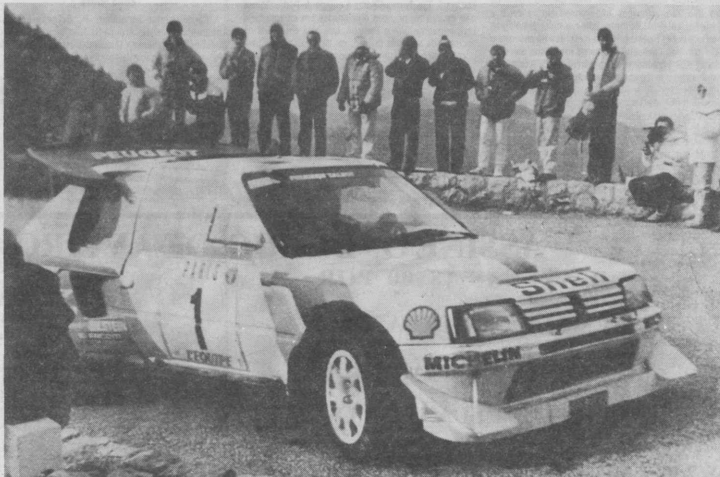
MÓNACO — Timo Salonen em acção no Rali do Mónaco.