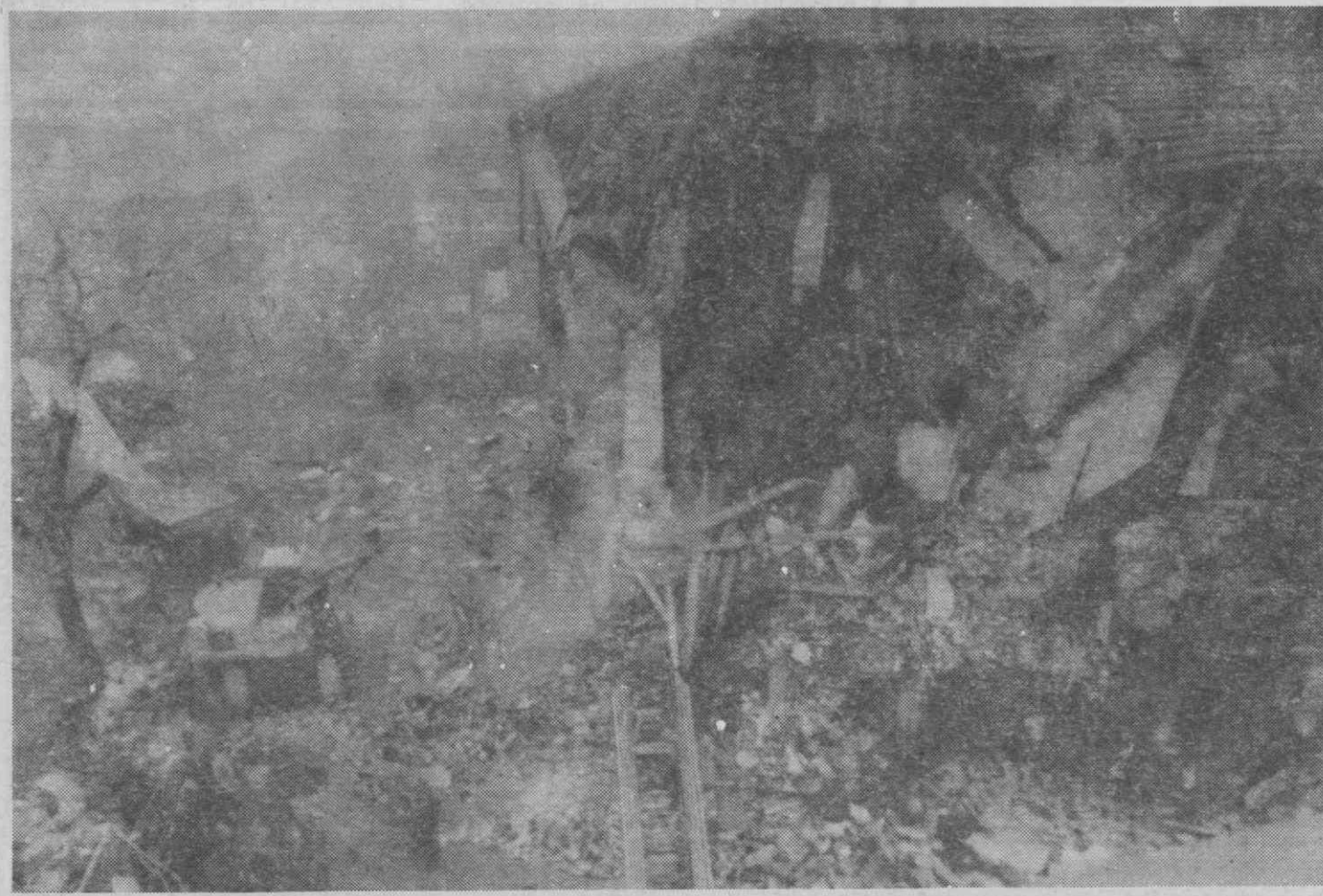
MODENA — Aspecto do prédio depois da explosão de bilhas de gás que matou duas pessoas.

Um petroleiro grego carregado de «crude» colidiu ontem de madrugada com um arrastão holandês e incendiou-se, sem que houvesse vítimas entre os 32 tripulantes — informou a Guarda Costeira britânica. Os tripulantes do «Orleans» um petroleiro de 76.142 toneladas, foram salvos de helicóptero. O petróleo em chamas derramado pelo «Orleans» estava a avançar em direcção a duas plataformas petrolíferas do Mar do Norte, pelo que 460 homens tiveram de ser retirados dessas plataformas. O «Orleans» estava a arder a cerca de 80 milhas ao largo da costa oriental britânica. A companhia Lloyd's disse que o petroleiro grego saiu na quarta-feira de Sullon Voe, nas Ilhas Shetland, com destino à Refinaria da Esso em Fawley, perto de Southampton, na costa sul britânica.