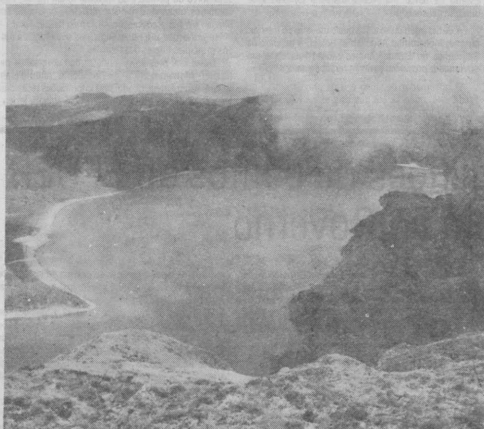
Um magnífico aspecto da bela terra açoriana (Lagoa das Sete Cidades). Essa beleza, porém, não pode fazer esquecer a perigosidade dos seus vulcões, cuja actividade está a ser objecto de estudo científico.

O Vale das Furnas que possui várias caldeiras vulcânicas em actividade, constitui um dos pontos de atracção turística das ilhas açorianas.