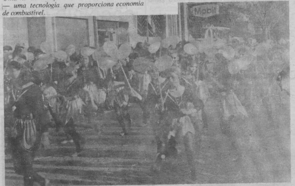
Carnaval de Ílhavo.