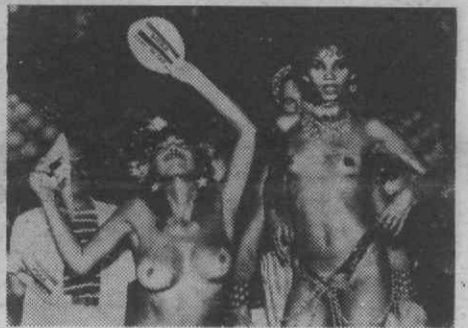
Ler na última página