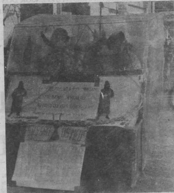
Uma nova invenção — o automóvel movido a pedais, — uma tecnologia que proporciona economia de combustível.

Amigo leitor, siga o nosso conselho: aproveite bem esta terça-feira de Carnaval, onde quer que se desloque — a escolha é sua — mas não deixe para amanhã aquilo que já só pode fazer hoje.