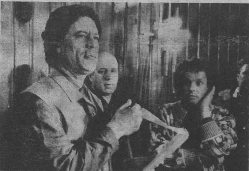
TRIPOLI — Conferência de imprensa de Kadafy em que anuncia que mandou interceptar todos os aviões israelitas que voem sobre o Mediterrâneo.