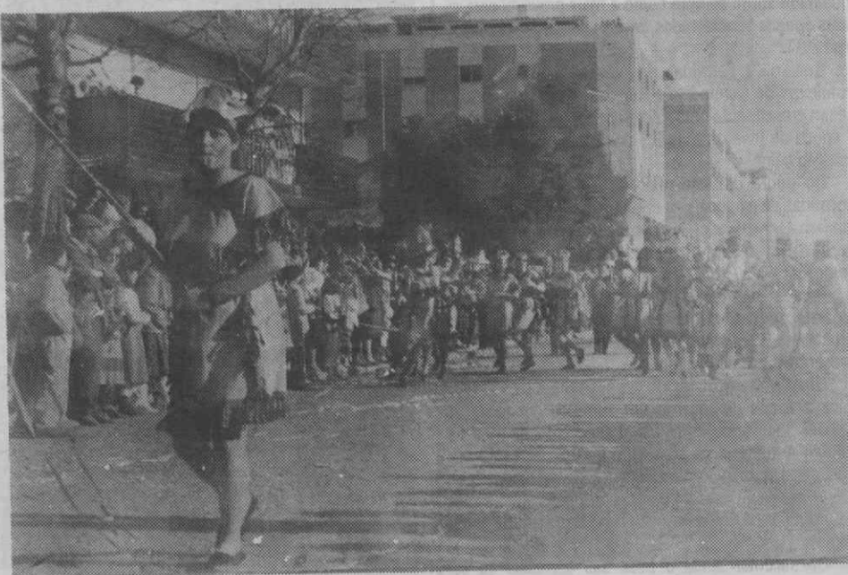
Carnaval de Ílhavo.