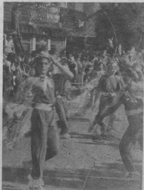
Ler na página 2