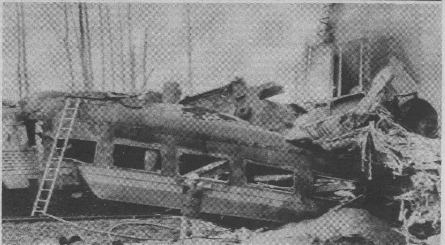
HINTON, ALBERTA — Aspecto de algumas das carruagens destruídas após colisão de dois comboios em que perderam a vida entre 30 a 40 pessoas.

Em resposta ao mesmo requerimento o tribunal salientou também ser sua faculdade interrogar qualquer réu a qualquer momento.