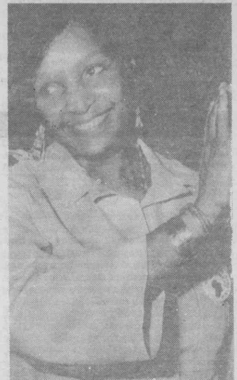
CIDADE DO CABO — Winnie Mandela fala aos jornalistas à saída da prisão depois de visitar o marido.