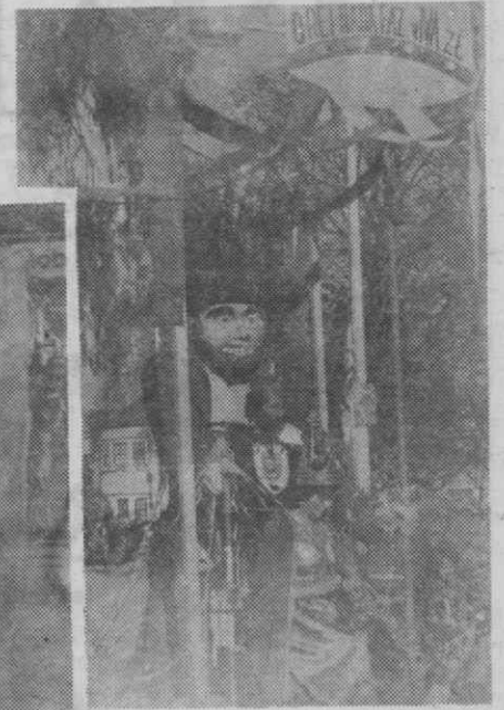
Os «reis» do Carnaval «galanteador» e «D. Lamparina» seguem no corso sentados no «o do «Zé Povinho».