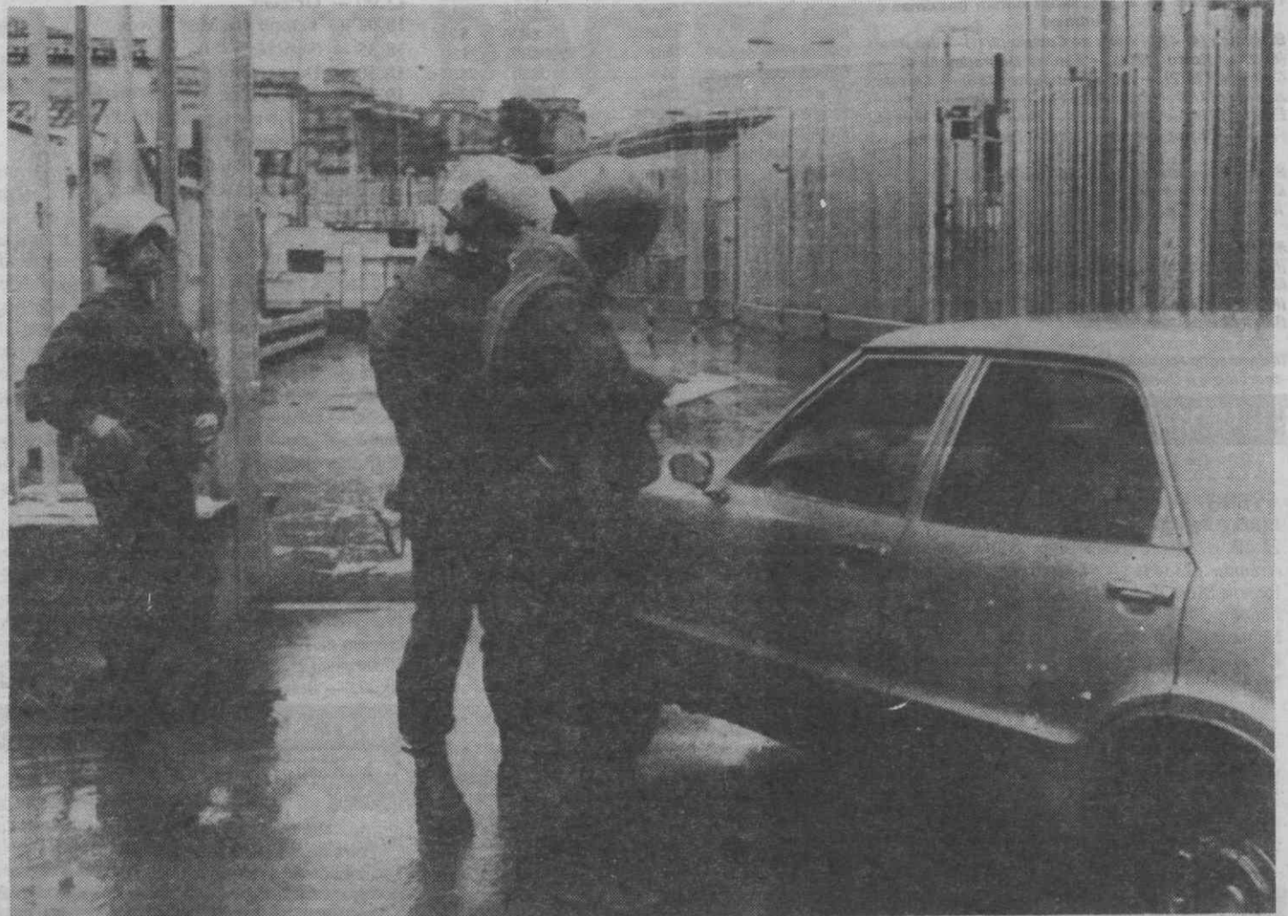
PALERMO — Polícias de segurança ao tribunal fortificado onde vai decorrer julgamento de membros da Máfia.

O maior processo contra a Mafia teve ontem início num Tribunal de Palermo, onde estão presentes 474 réus.