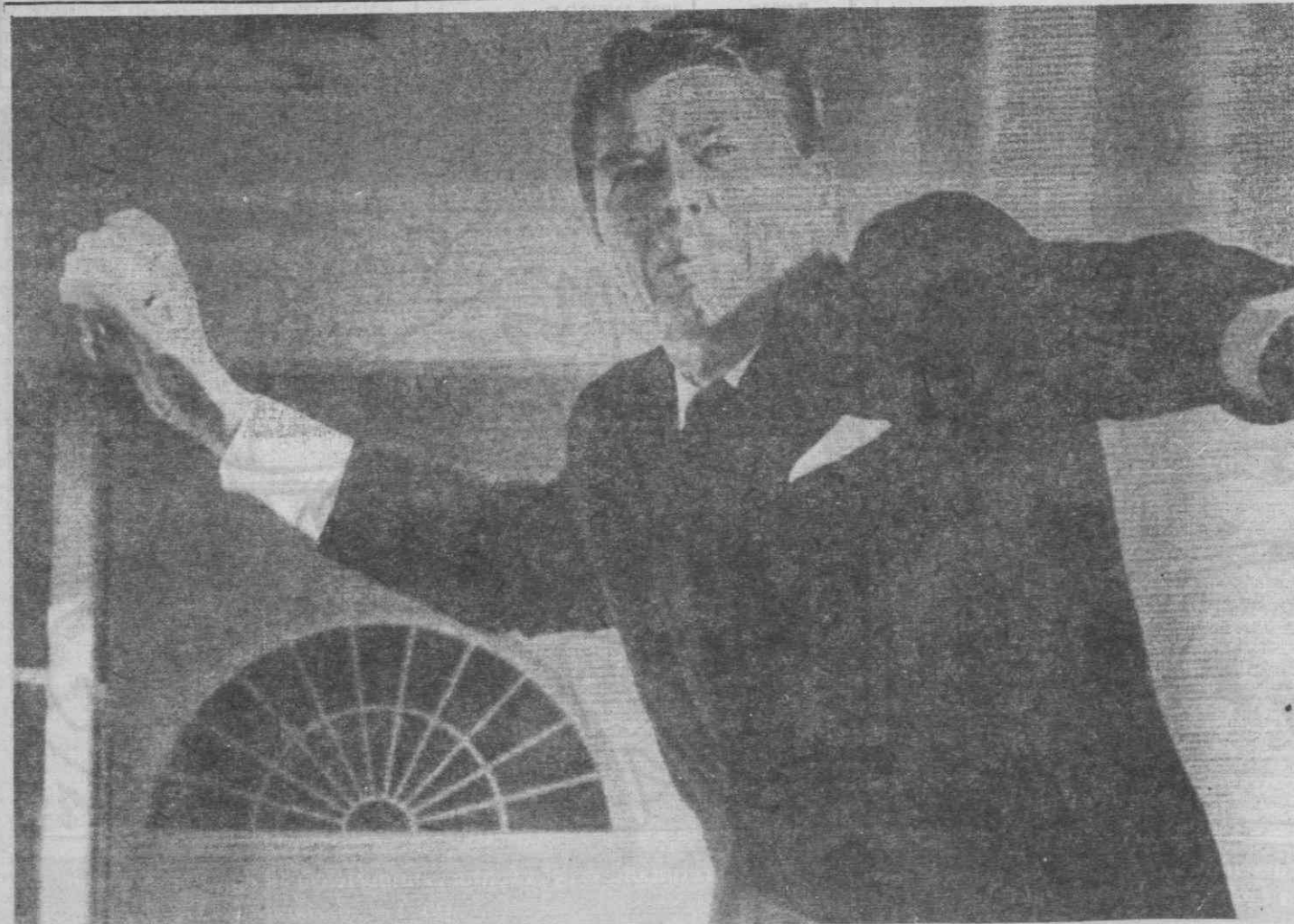
WASHINGTON — O Presidente Reagan atira bola de neve para os repórteres fotográficos ao chegar à Casa Branca.

O 27.º Congresso do Partido Comunista Soviético reiniciou-se ontem com ataques às novas propostas sobre controlo de armas apresentadas pelo Presidente norte-americano, sendo afirmado que elas provocaram «desolação e desapontamento». No segundo dia do Congresso, onde participa uma delegação do PC português chefiada por Álvaro Cunhal, os cinco mil delegados debruçaram-se sobre a discussão de um extenso relatório apresentado terça-feira pelo líder Mikhail Gorbachev.