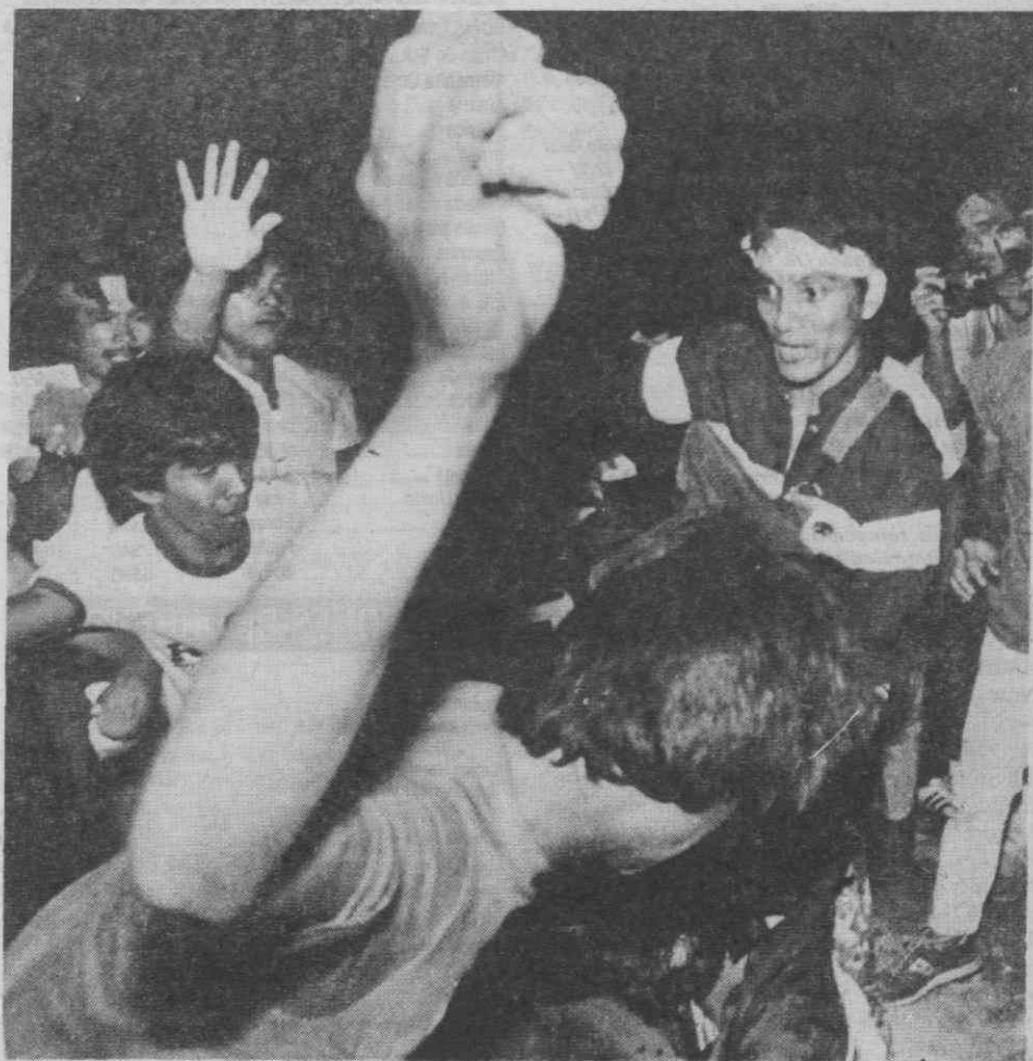
MANILA — Jovens apoiantes de Corazon Aquino preparando-se para atirar pedras a um apoiante do ex-Presidente Marcos que sangra abundantemente, sentado no chão.

«Claro está, com a partida de Marcos e uma atmosfera tranquilizada, podemos começar a curar as feridas» — disse Aquino aos jornalistas.