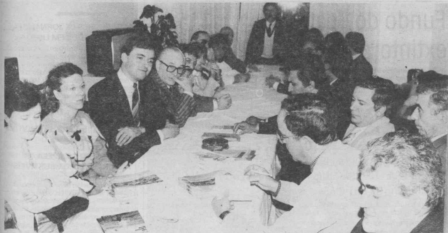
Um aspecto da reunião dos operadores turísticos franceses com hoteleiros da região da Figueira da Foz, realizada no restaurante «Tamarqueira».

Uma dezena de representantes de operadores turísticos da região parisiense terminou ontem uma visita de dois dias à Região de Turismo do Centro, no âmbito de uma acção patrocinada pelo Centro de Turismo de Portugal em Paris e TAP — Air Portugal.