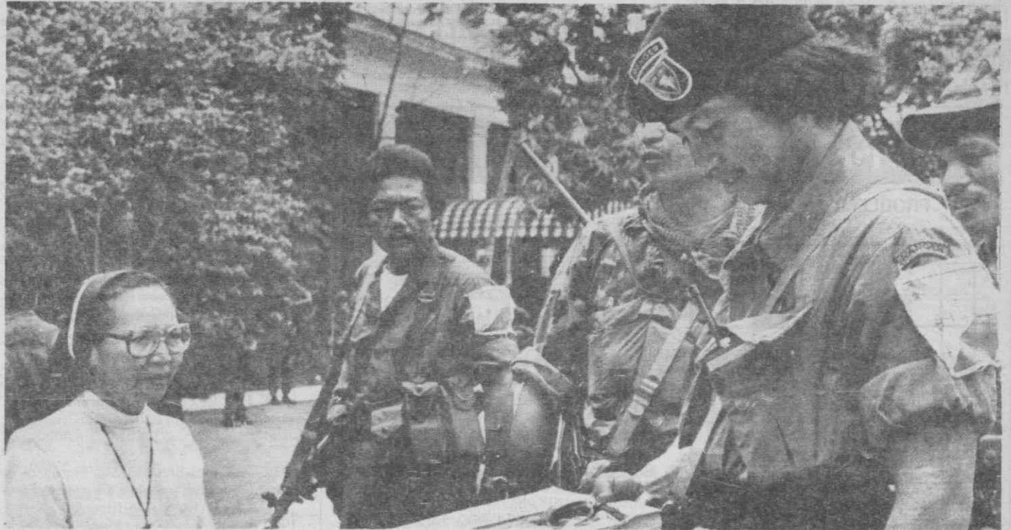
MANILA — Uma freira observa apreensiva uma bomba que um soldado exhibe, após as operações de limpeza levadas a cabo no Palácio Presidencial.

As autoridades situaram ontem em 16 o número de mortos nos três dias da revolta militar que precipitou o fim de Marcos, e fizeram notar que durante a controversa eleição presidencial de 7 de Fevereiro morreram 90 pessoas.