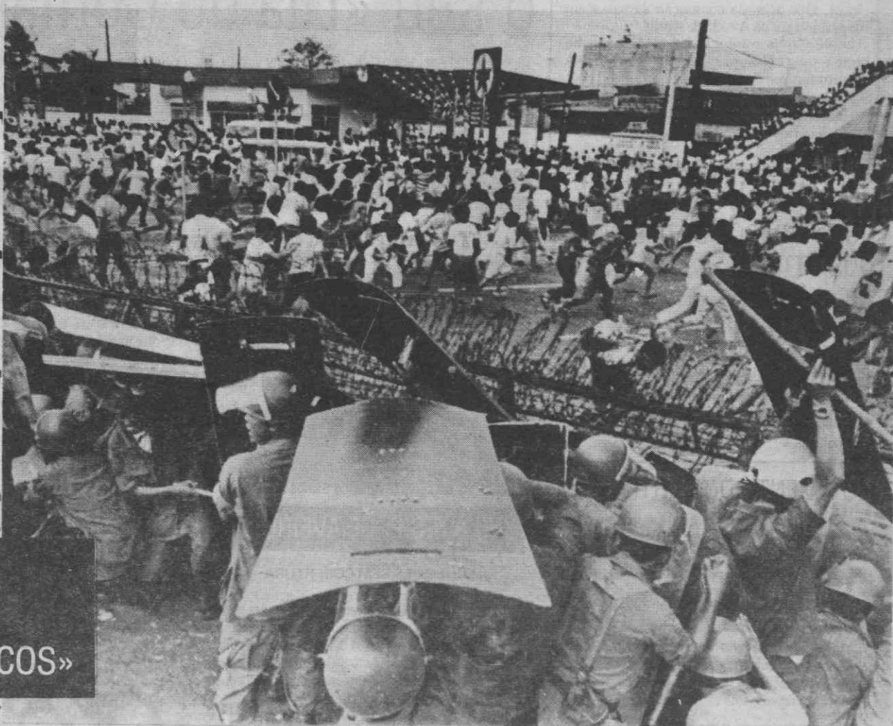
MANILA — Polícias escondem-se atrás dos escudos para se protegerem das pedras de populares que saltam o arame farpado para irem saquear o Palácio Presidencial.

— PREVISTA AMNISTIA PARA TODOS OS «DELITOS POLÍTICOS»