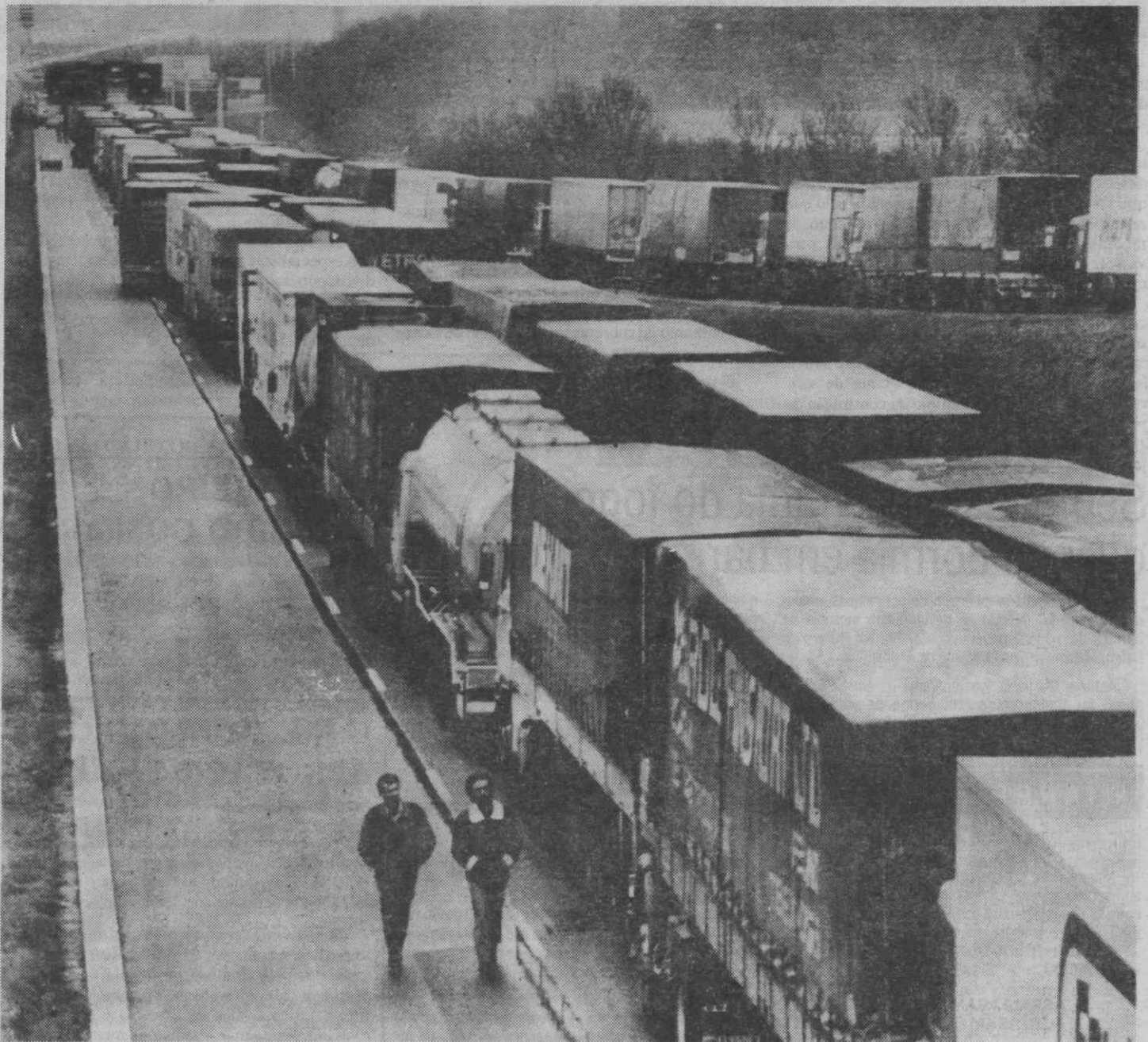
Greves que envolvam camiões TIR têm sempre provocado engarrafamentos monstruosos nas estradas.

Os trabalhadores dos Transportes Internacionais Rodoviários (TIR) do terminal de Alverca continuaram ontem numa greve cujos efeitos se alastram às fronteiras de Vilar Formoso e do Caia, onde está bloqueada a passagem de camiões.