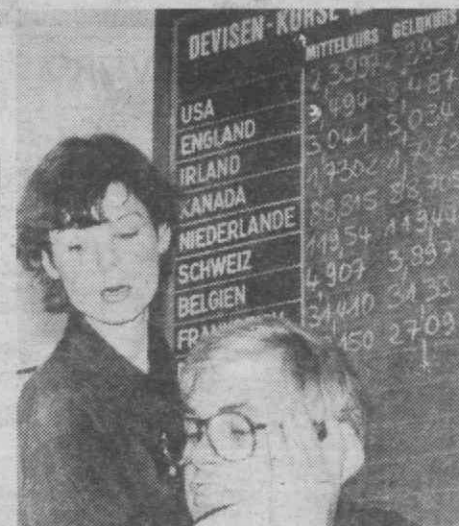
FRANCFORTE — Primeiras cotações de moedas depois do realinhamento de cotação de moedas do Sistema Monetário Europeu.

(Telefoto NP/Reuter) - Diário de Aveiro -