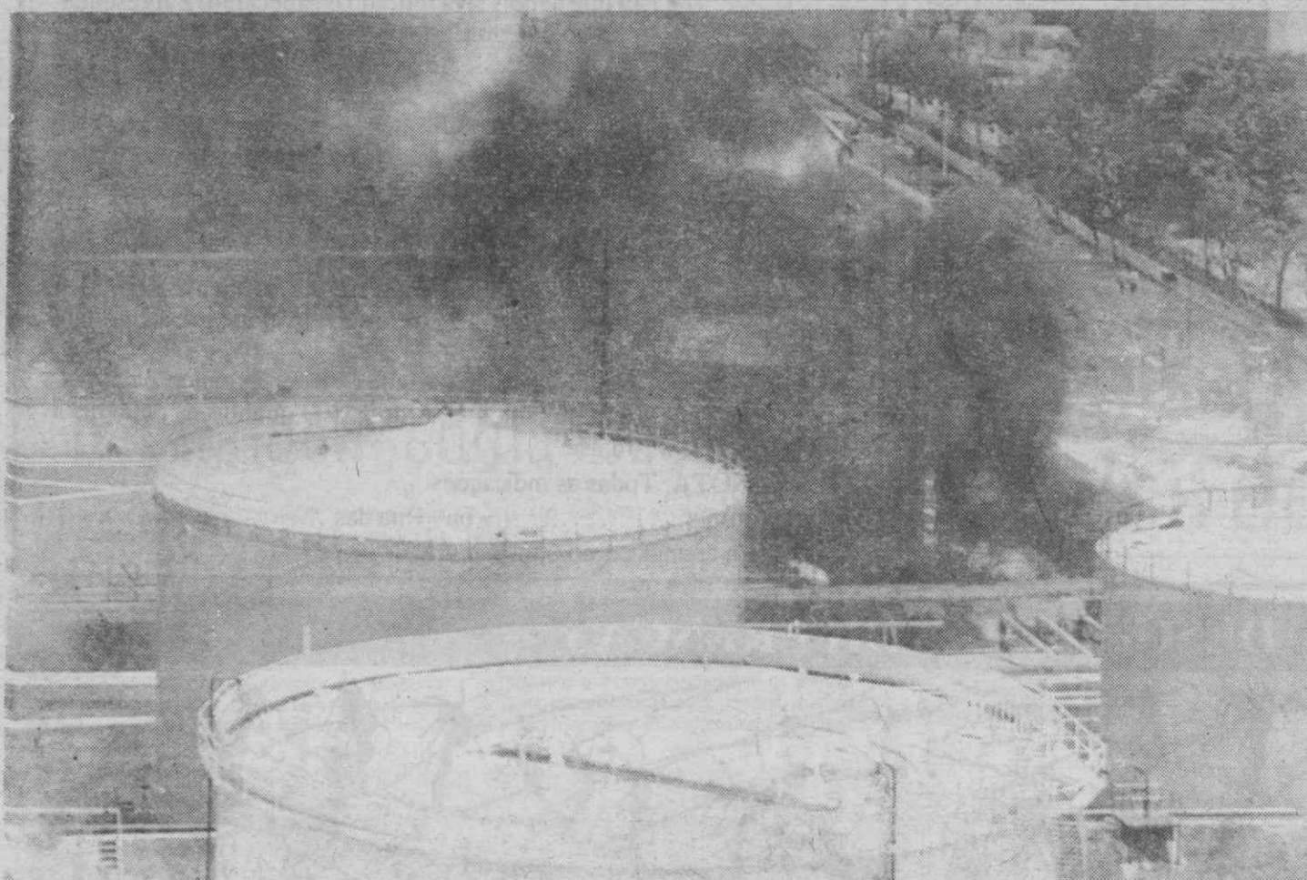
CARACAS — Grandes nuvens de fumo elevando-se no ar, provenientes duma fábrica de armazenamento de combustível onde ocorreu um incêndio.

Um industrial grego de 79 anos foi ontem morto a tiro por um homem armado, no centro de Atenas — disse a polícia. O industrial, Dimitris Angelopoulos, foi ajeitado pelo menos quatro vezes no abdómen, quando se dirigia a pé para o seu escritório — acrescentou a polícia. Angelopoulos veio a falecer no hospital, enquanto o seu atacante, segundo testemunhas oculares, fugia numa motorizada conduzida por um cúmplice. O grupo extremista «17 de Novembro» reivindicou o atentado num comunicado de quatro páginas encontrado no local. O «17 de Novembro» tem reivindicado uma série de assassinatos políticos ao longo dos últimos 11 anos, incluindo o de dois diplomatas norte-americanos.