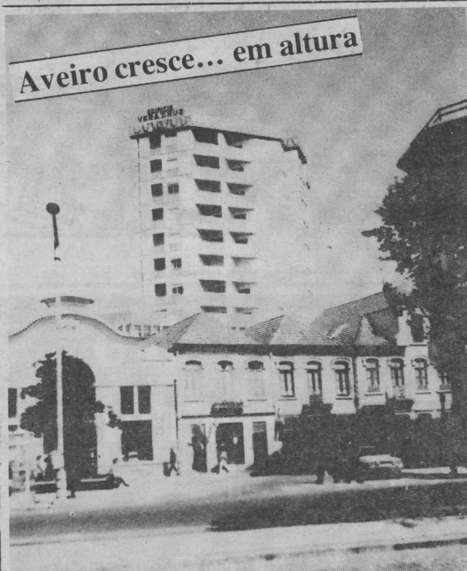
Emergindo do casario da parte velha da cidade, os prédios de maiores dimensões conferem à cidade uma outra fisionomia.