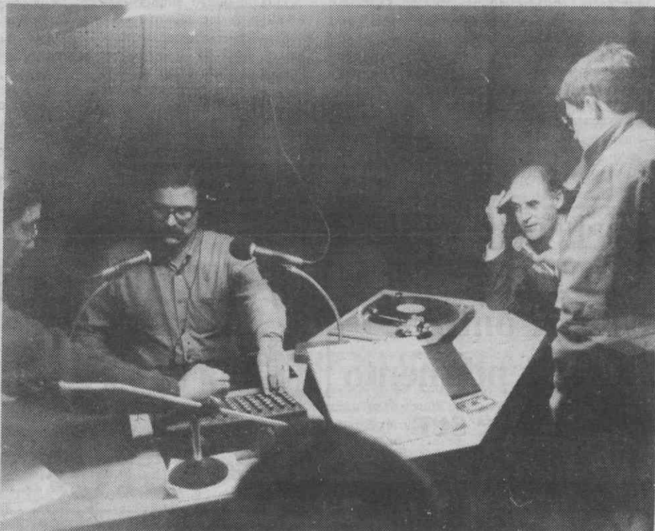
O poder local esteve presente na inauguração das emissões regulares da Rádio Botaréu.

Após algumas semanas de emissões experimentais, a Rádio Botaréu, emissora independente de Águeda, iniciou na passada segunda-feira as suas emissões regulares. Assim, aquela voz radiofónica pode ser agora ouvida das 18 horas até às 24 horas, com uma grelha de programas muito variados.