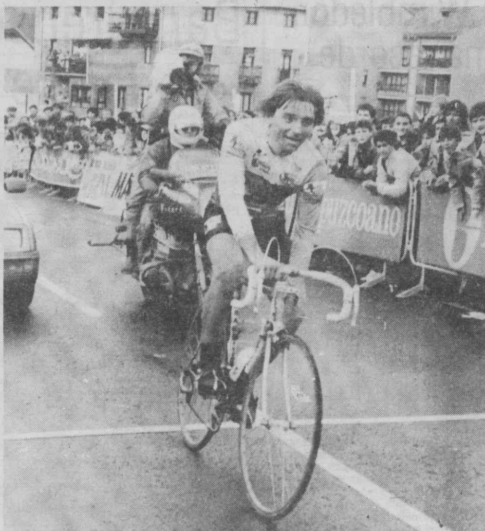
ANZUELA (ESPANHA) — Ciclismo — O italiano Maurizio Rossi vence a primeira etapa da Volta ao País Basco.

O Liverpool, tal como os restantes clubes ingleses, não pôde disputar as competições europeias após os incidentes registados na final da Taça dos Campeões no ano passado em Bruxelas, onde morreram 39 pessoas.