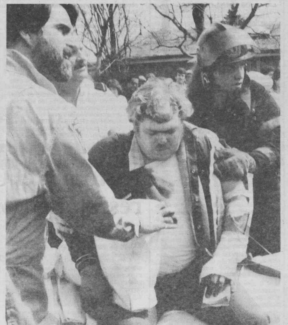
TORONTO — O condutor de um autocarro, com um pedaço de madeira espetado no ombro, depois do despiste do autocarro que conduzia. No acidente ficaram feridos mais de 15 passageiros.

O adiamento, pela segunda vez consecutiva, da aprovação do conjunto de projectos portugueses apresentados por autarquias locais para financiamento pelo FEDER inscreve-se nessa estratégia, de acordo com meios próximos da Comissão.