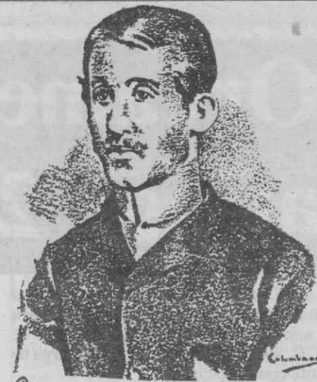
Cesario Verde 1855-1886

Um apontamento apenas, nestes cem anos da morte do poeta. E o reverter a Silva Pinto, que melhor o conheceu. Para acabarmos com as palavras desse escritor e jornalista, do grande amigo de Cesário, volvendo à hora a que o conduziram à última jazida: Foi às cinco da tarde, — ainda agora. Caía o sol a prumo sobre a estrada do Lumiar e nós vínhamos arrastando a nossa miséria, —