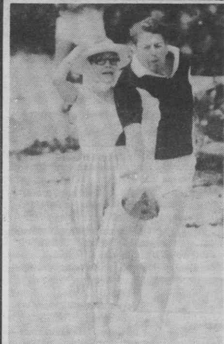
HONOLULU — O casal Reagan brincando na praia, vendo-se Ronald Reagan, lançando um côco.