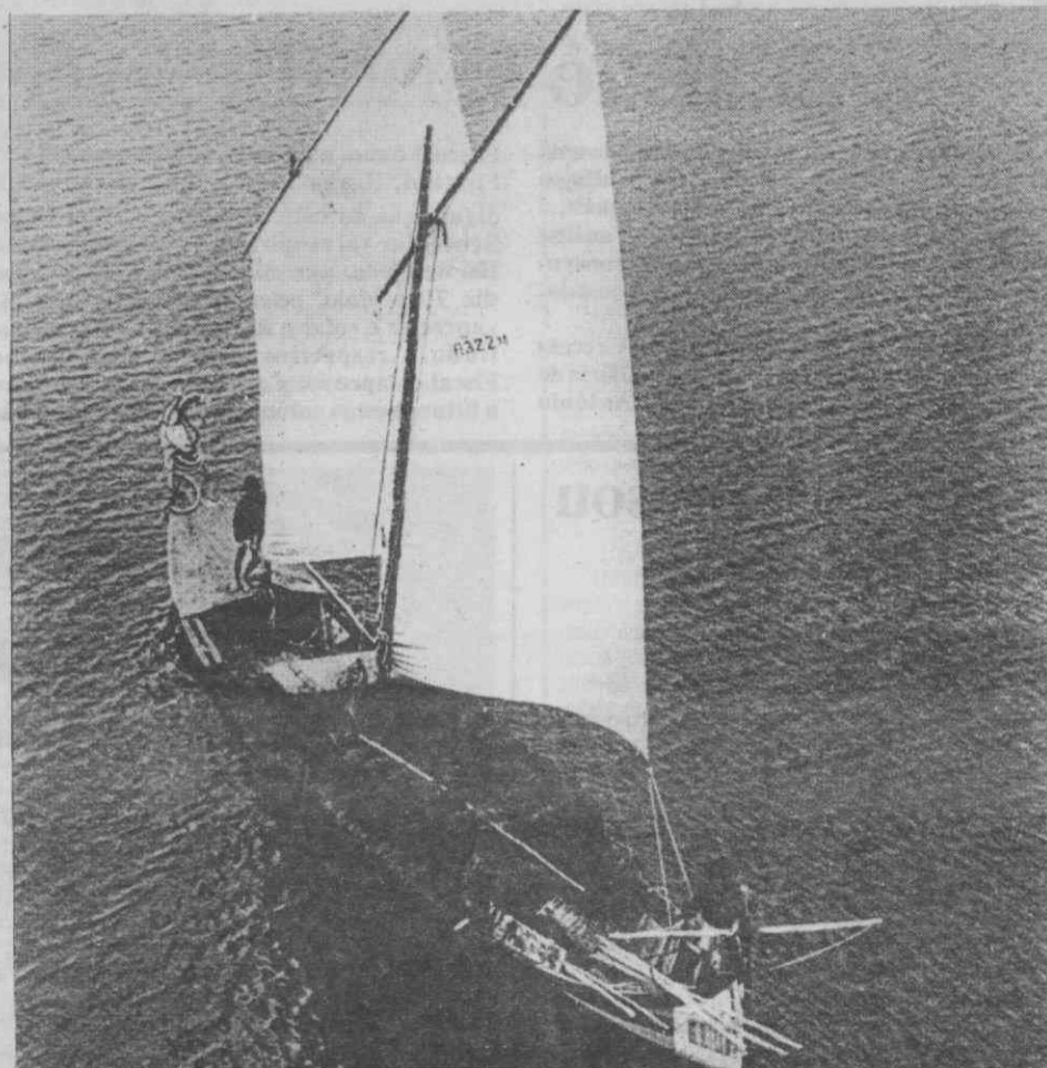
Velho moliceiro gigante, de dois mastros, hoje desarmado, construído por mestre Preguiça em 1965.

utilizados na apanha, que expôs na Galeria Saluden, em Quimper, de 2 a 29 de Maio de 1984, e no Verão desse mesmo ano em Port de Douarnenez, o grande porto do Finisterra, de tão profundas tradições na pesca da sardinha, do atum e da lagosta. De tudo isso ressuma a imagem autêntica da vida ancestral das gentes lagunares que, mais que em outro espaço, a água e a terra individualizou, barqueiros-lavradores penteando no esforço dos sessenta e quatro pentes dos ancinhos de arrasto os fundos lodosos para assim nascer, de marneis e gafanhas, a terra jovem e úbera. Os moliceiros de Aveiro já conhecem meio mundo de museus, e retinas de fotógrafos, e paletas de pintores, e vale a pena ir ali, ao Museu de Ílhavo, dar-lhes um aceno de saudade e no Bico e no Bunheiro ler com eles ainda as páginas de Raul Brandão e soletar a beleza às escancaras das redondilhas menores, Trabalha que logo cantas.