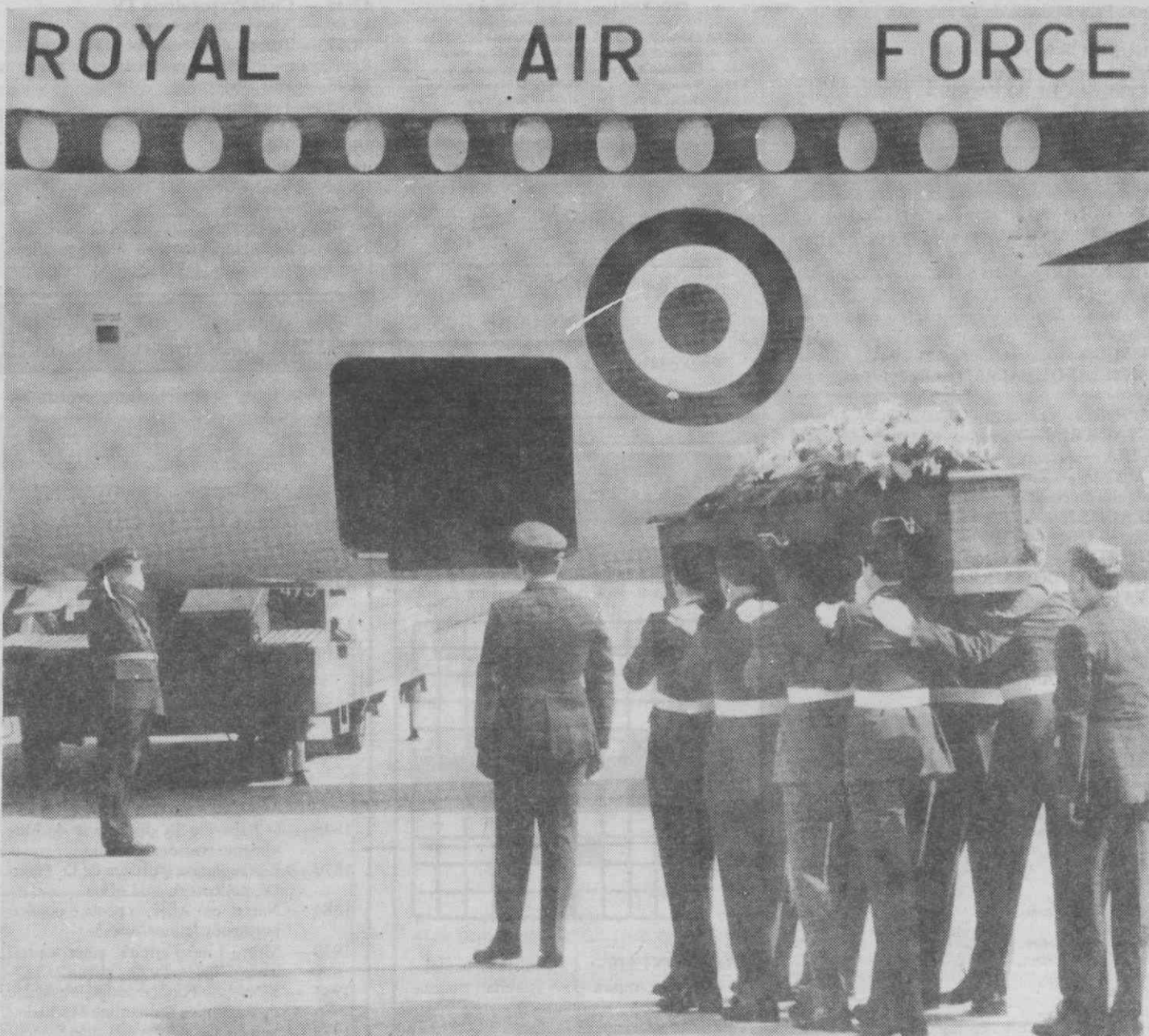
PARIS — Membros da Real Força Aérea carregam aos ombros o caixão contendo os restos mortais da Duquesa de Windsor em direcção ao avião que o levará até à Inglaterra.

Em 1985, o total da produção de bens para alimentar os 45 milhões de iranianos é quase idêntico ao nível de 1978, ainda antes da revolução, embora o nível «per capita» tenha decrescido 23 por cento.