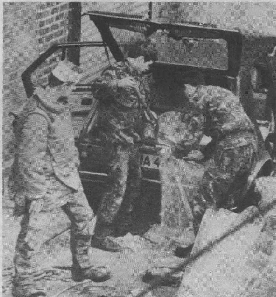
BELFAST — Especialistas do Exército em explosivos retiram cerca de 238 Kg de material dum carro armadilhado descoberto no caminho que seria percorrido pelo cortejo fúnebre dum jovem lealista morto pelo Exército britânico.