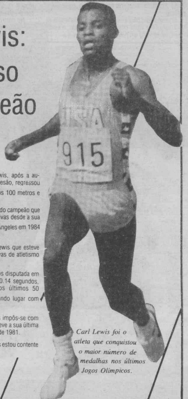
Carl Lewis foi o atleta que conquistou o maior número de medalhas nos últimos Jogos Olímpicos.

«Estava a tentar os 8.35 metros, mas estou contente com a marca obtida» referiu Lewis.