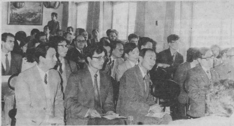
Aspecto da recepção à delegação chinesa.