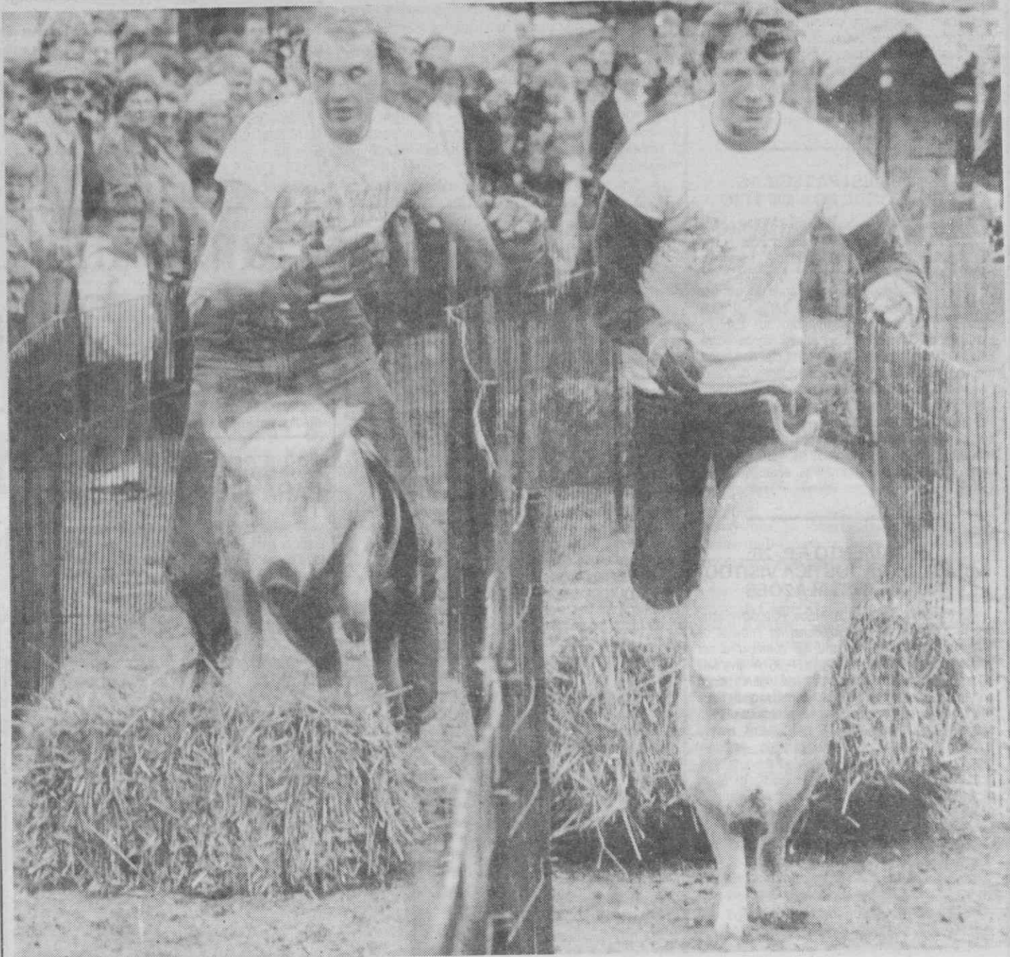
HAMBURGO — Fase inicial da tradicional corrida de porcos, vendo-se dois corpulentos animais em acção.

A autoria do atentado não foi reivindicada.