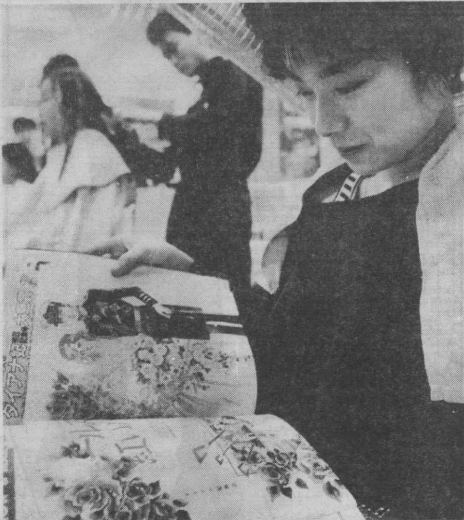
TÓQUIO — Uma jovem lendo uma das muitas revistas sobre os Príncipes de Gales o que, segundo os observadores, é já chamada a «febre de Diana», numa antecipação à próxima visita daquele casal real.

A verdade é que «choveram» telefonemas na nossa Redacção a «reclamar» do nosso lapso. Do facto pedimos desculpas aos visados — Beira Mar e União de Santarém — e muito especialmente aos nossos leitores.