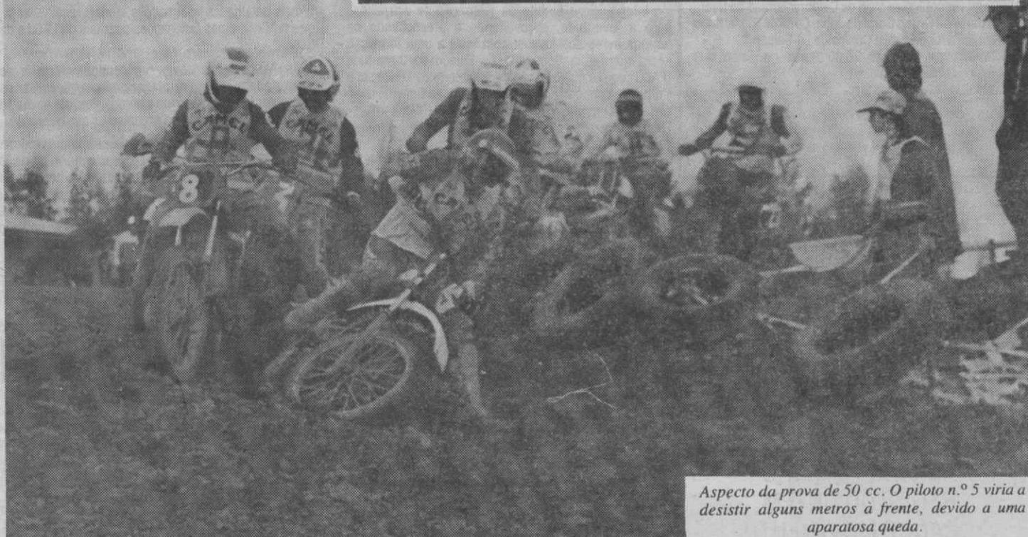
Aspecto da prova de 50 cc. O piloto n.º 5 viria a desistir alguns metros à frente, devido a uma aparatosa queda.