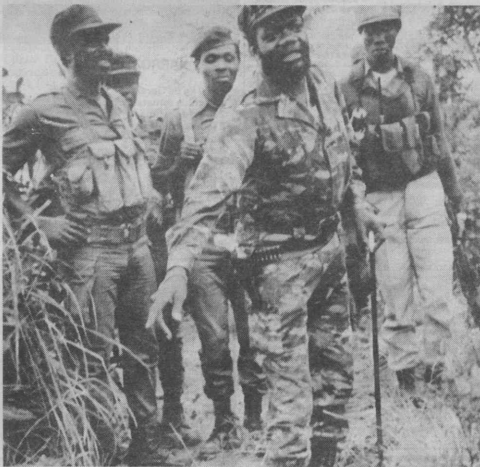
MUNHANGO (ANGOLA) — O líder da UNITA, Jonas Savimbi, verifica as suas tropas entrenchadas, pois segundo ele próprio afirmou aos jornalistas, o Governo angolano está a preparar a sua maior ofensiva militar de sempre, contra a UNITA.

Os jornalistas que viajaram 700 quilómetros durante três dias e duas noites num camião aberto desde uma pista de aviação improvisada na selva perto da fronteira com a Namíbia até se encontrarem com Savimbi, chegaram ontem à África do Sul.