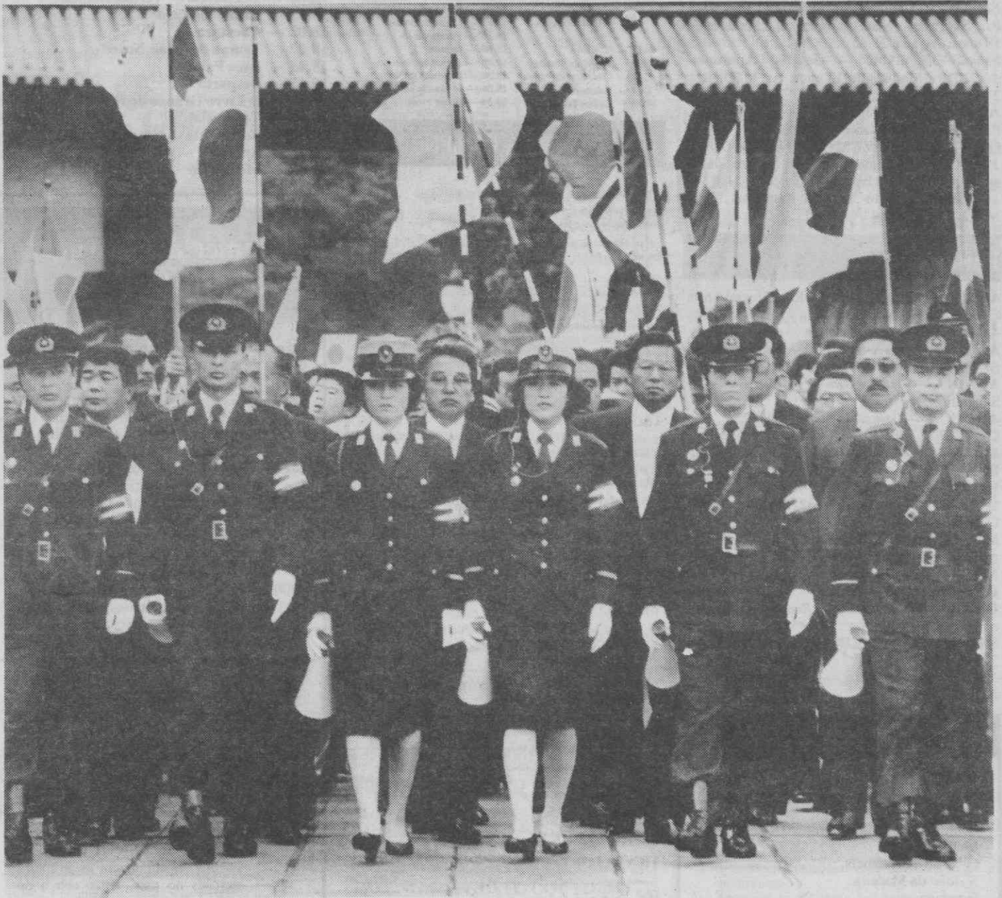
TÓQUIO — Cordão de polícias à frente da multidão empunhando bandeiras junto do Palácio Imperial para saudar o imperador Hirohito que celebrou o seu aniversário.

Foi outrora considerado um Deus vivo e titular das Forças Armadas japonesas que ocuparam a Coreia e partes da China e do sueste asiático. Depois da derrota do Japão na Segunda Guerra Mundial, foi forçado a renunciar à pretensão à divindade e os seus deveres limitaram-se em grande parte a funções protocolares.