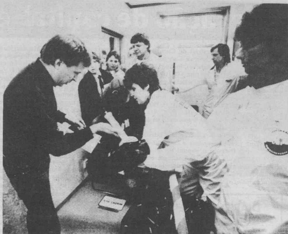
FORMSARK (SUECIA) — Médicos suecos consultam populares para verificarem se foram contaminados pela nuvem radioactiva vinda de uma central nuclear em Kiev, União Soviética. (Ler na pág. 10)