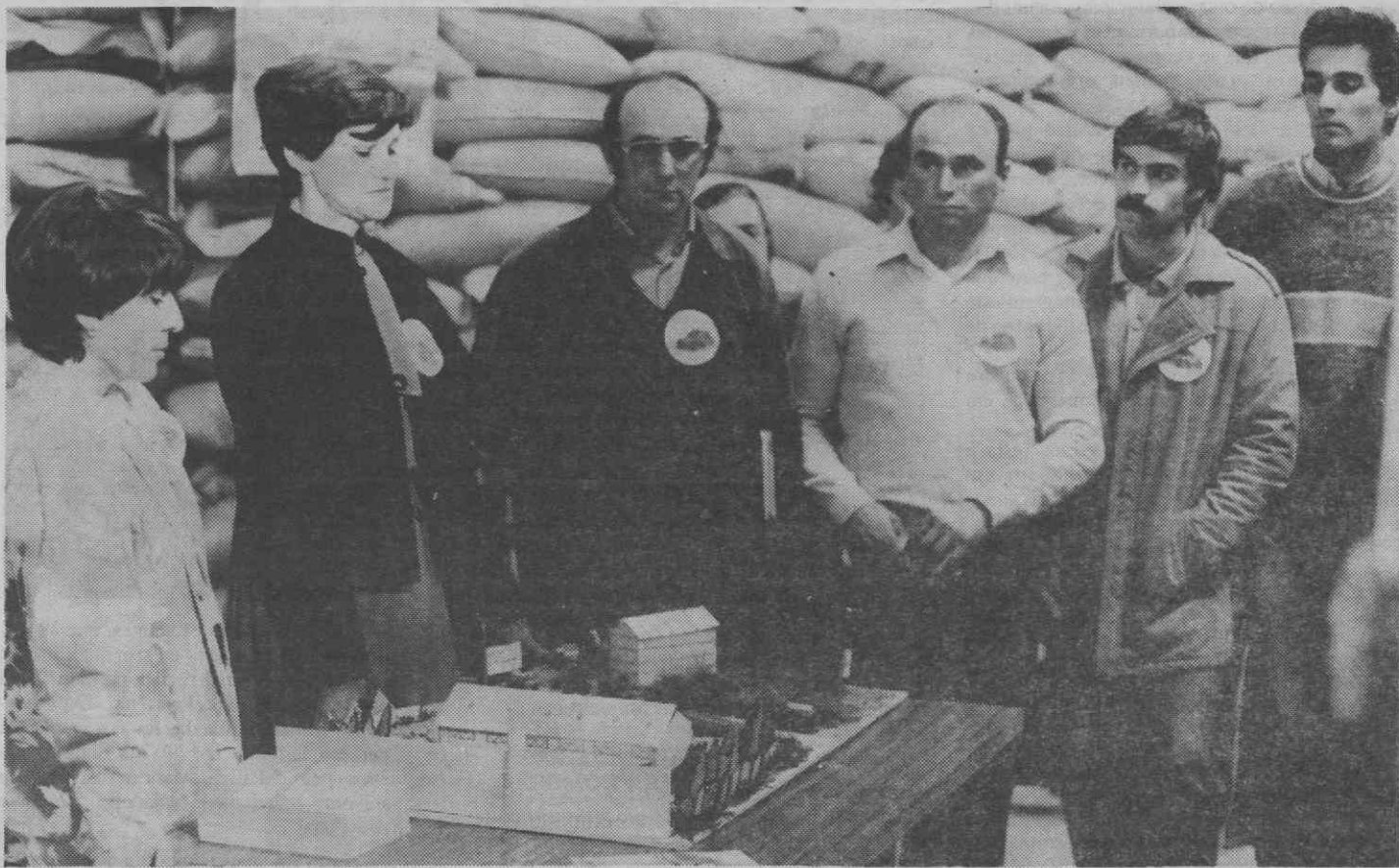
Aspecto de uma das estações do dia de demonstração.

O dia de demonstração contou com a presença de cerca de 130 agricultores e foi constituído por diversas estações, designadamente, uma introdução (diaporama), informação sobre o consumo de calcário, avaliação económica e demonstração de equipamento.