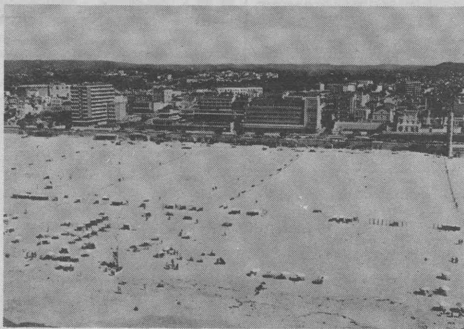
É neste areal de areias douradas, principalmente a meio do mesmo, não só nesta área mas também até Buarcos, que os tais «prados» nascem entre Outubro e Junho.