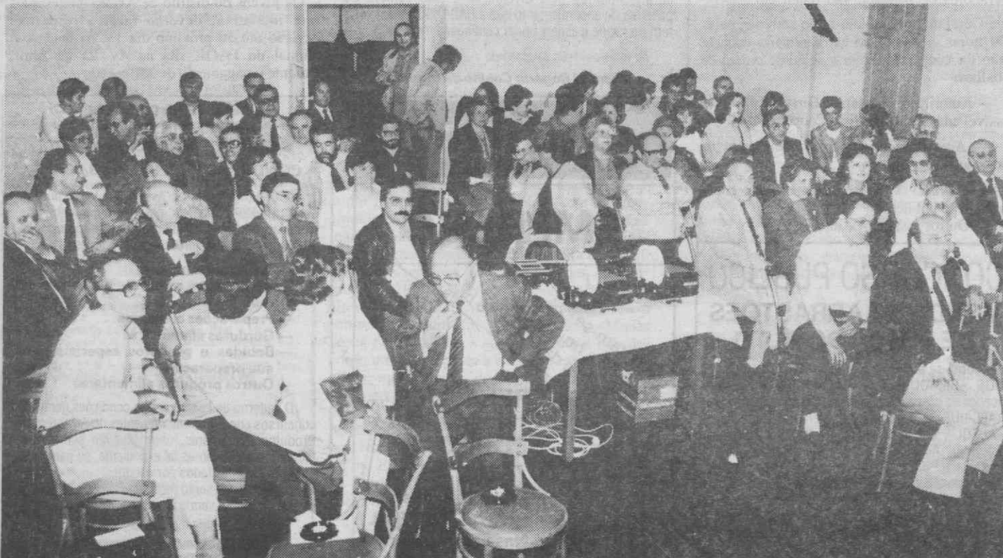
Um aspecto da assistência na última sessão da Assembleia Figueirense.