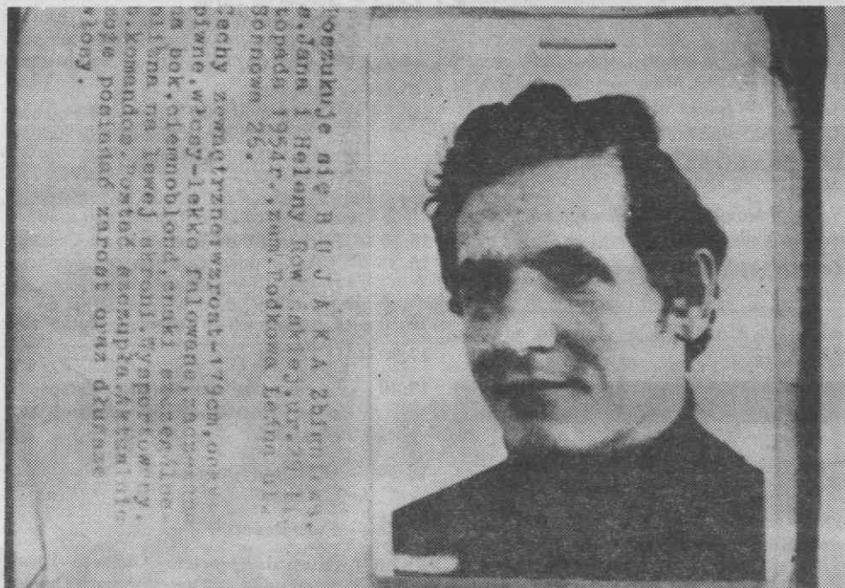
VARSOVIA — Um cartaz com a foto de Zbigniew Bujak lançada pelas autoridades policiais polacas em que pediam aos habitantes para darem informações sobre o dirigente do Solidariedade.

- Diário de Aveiro -