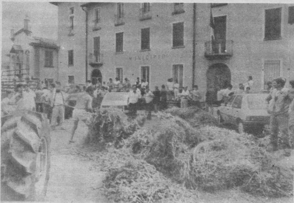
ERBA — ITALIA — Agricultores empilham feno em frente à Câmara Municipal para protestarem contra a ordem que manda a destruição do feno devido ao aumento da radioactividade.

carne de coelho revelaram níveis de radioactividade acima dos limites permitidos. Guzzetti afirmou desconhecer o número exacto de coelhos que foram afectados, embora se julgue que é da ordem dos milhares. A província de Como tem cerca de 100 000 coelhos criados para consumo.