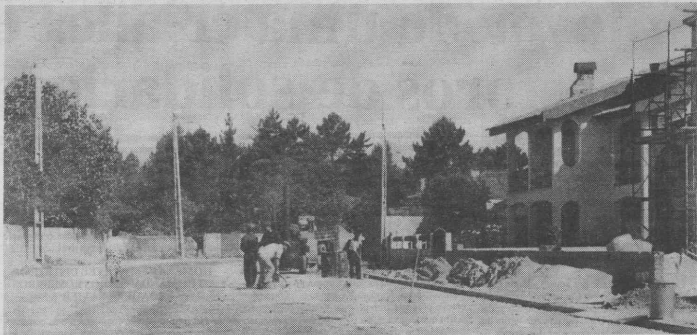
Aspecto da Rua 27 de Janeiro.

Em edições anteriores do nosso Jornal já foram abordados os problemas do estado lastimoso em que se encontra a Rua 27 de Janeiro, problemas esses agravados pela importância do referido arruamento que serve alguns pontos importantes da cidade, designadamente o Quartel da GNR e a Escola Secundária N.º 1.