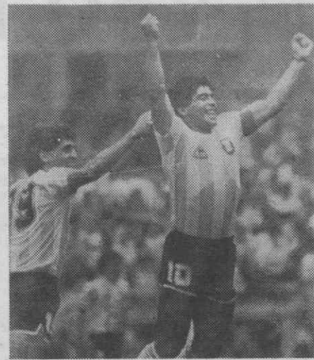
CIDADE DO MEXICO — Maradona levanta os braços de contentamento depois de a Argentina ter aberto o activo.