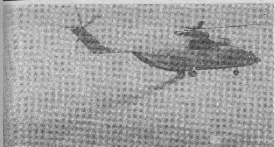
UCRÂNIA, URSS — Um helicóptero lança um pó desactivante sobre a região de Chernobyl onde ocorreu o acidente nuclear em Abril passado.