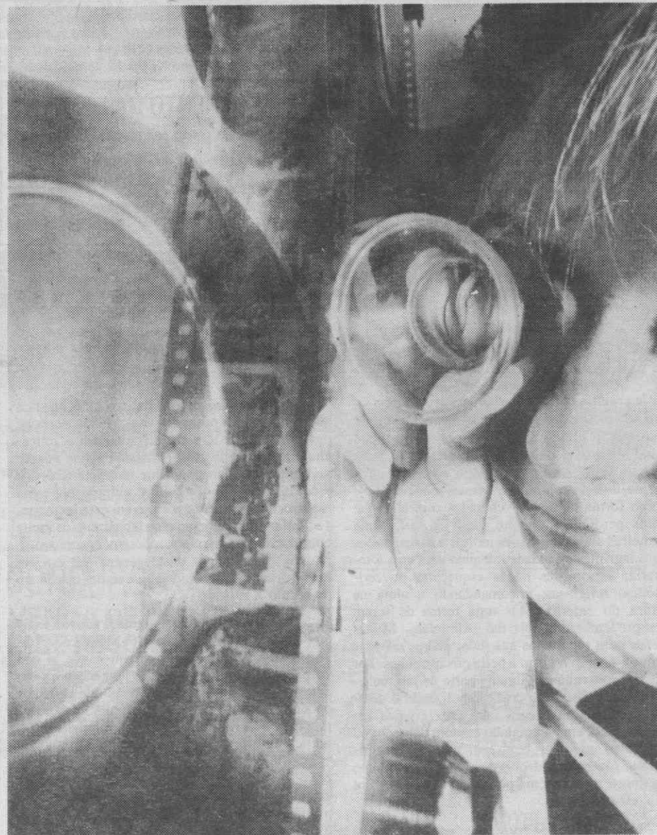
TETERBORO — NOVA JERSIA — Um técnico coloca um filme fotográfico numa máquina impressora automática capaz de fazer 18.000 cópias numa hora. Durante 1986 vão ser impressas 13 biliões de fotos a cores.

A NP apurou que as forças de segurança conseguiram determinar que o telefonema foi feito da zona de Nuêvo Leon, prosseguindo as investigações.