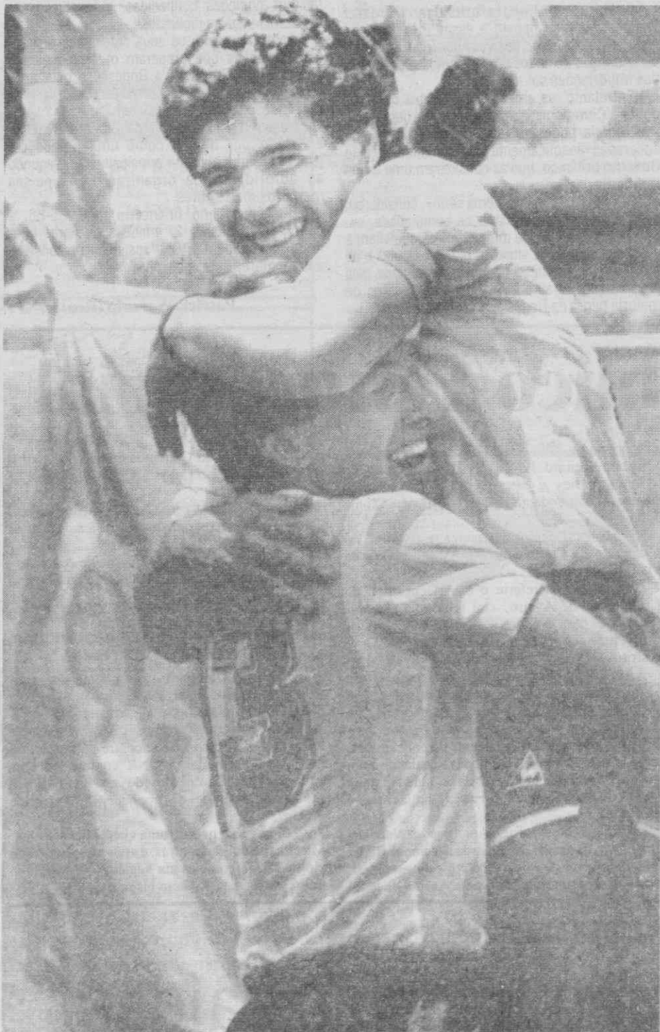
PUEBLA — Maradona celebra golo do empate contra a Itália.