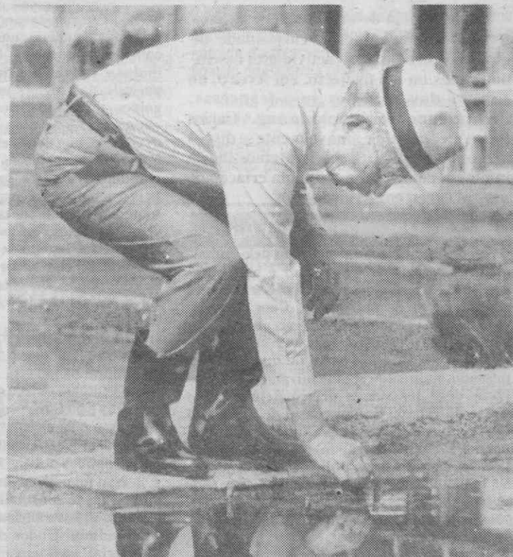
TÓQUIO — O imperador Hirohito, parecendo querer desmentir os seus 85 anos, dedica-se à plantação de arroz, num ritual antiquíssimo do Japão, ao qual o próprio monarca quis aderir.

O aumento da verba para os militares destinam-se a responder aos aumentos de combustíveis que poderiam colocar as Forças Armadas numa situação de ausência de verbas dentro de algum tempo.