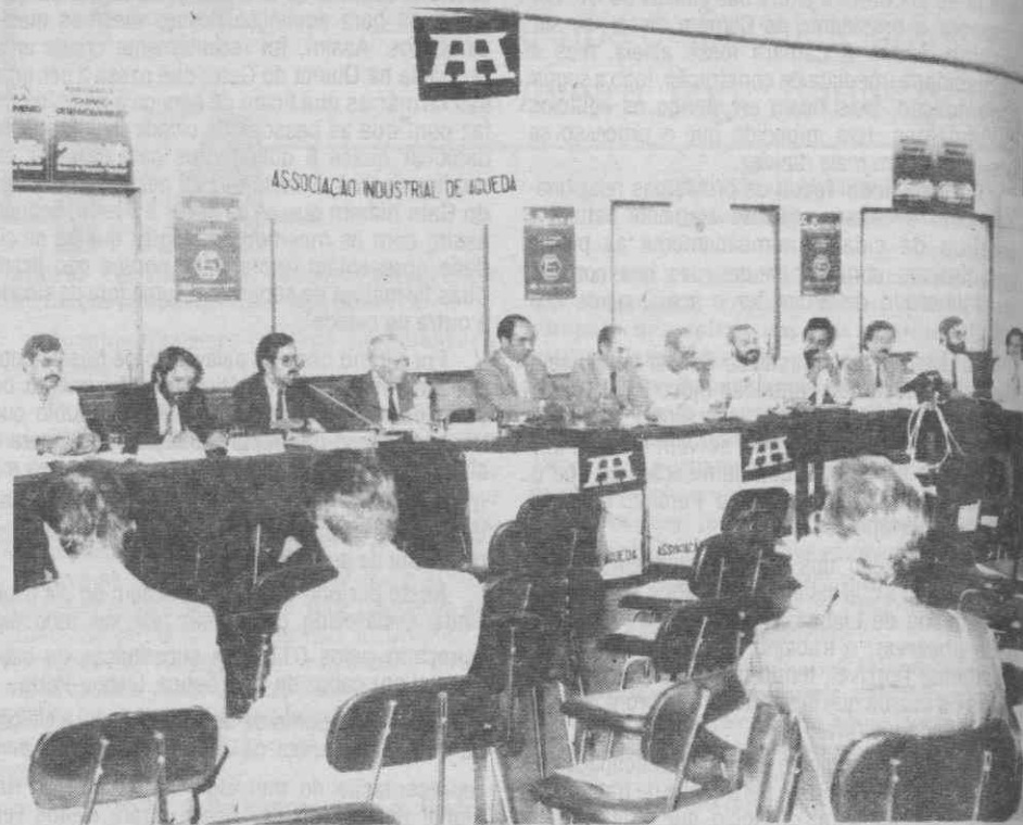
Aspecto da Conferência sobre Subcontratação.

No período de perguntas e respostas, os empresários presentes colocaram várias questões relacionadas com o sector da subcontratação às quais os técnicos deram respostas adequadas.