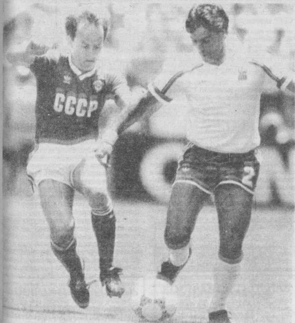
Fase do jogo França-URSS