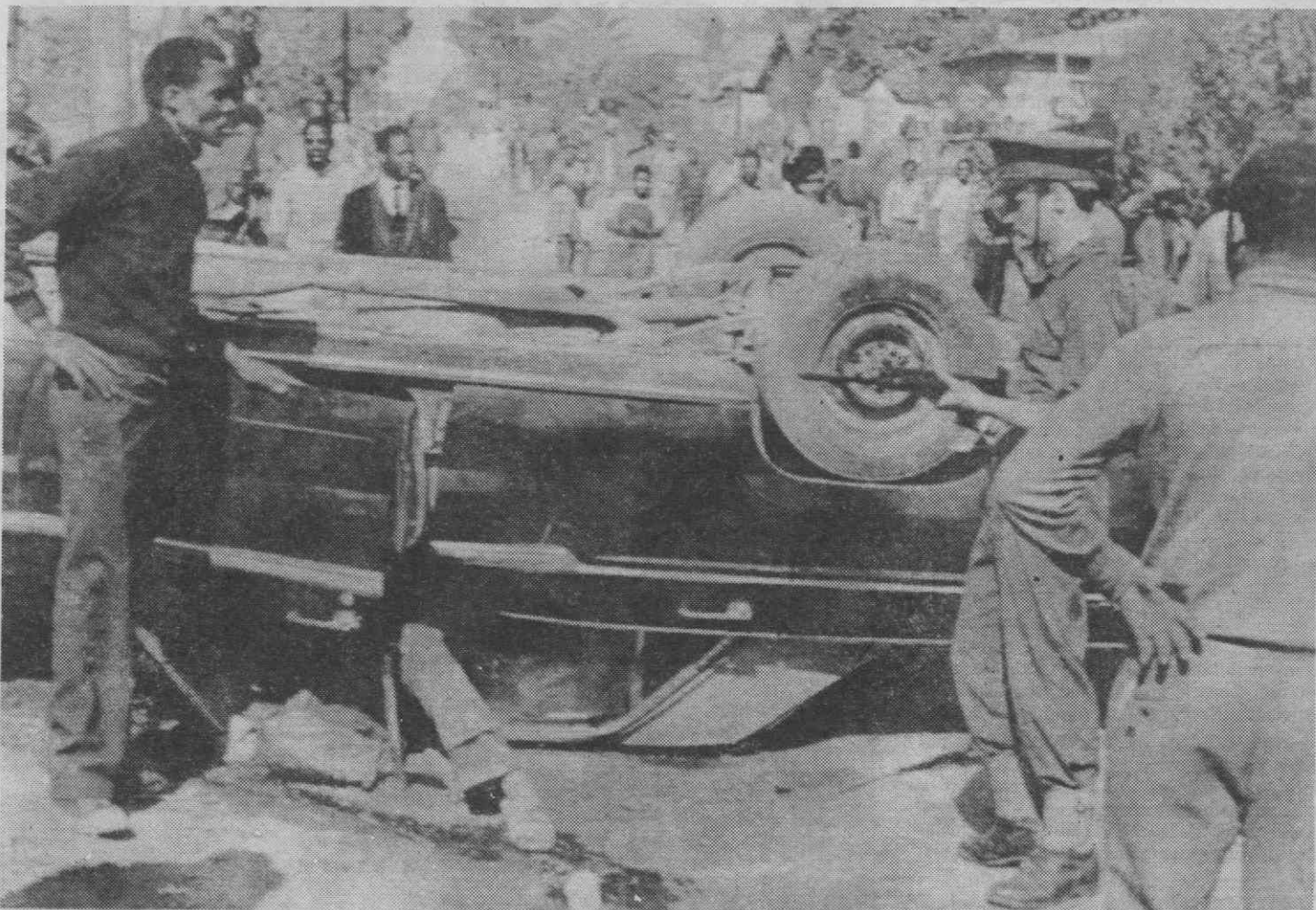
JOANESBURGO — Um polícia guarda um manifestante negro junto a um carro virado com uma vítima no interior durante os distúrbios de há dez anos em Soweto. «Diário de Aveiro».