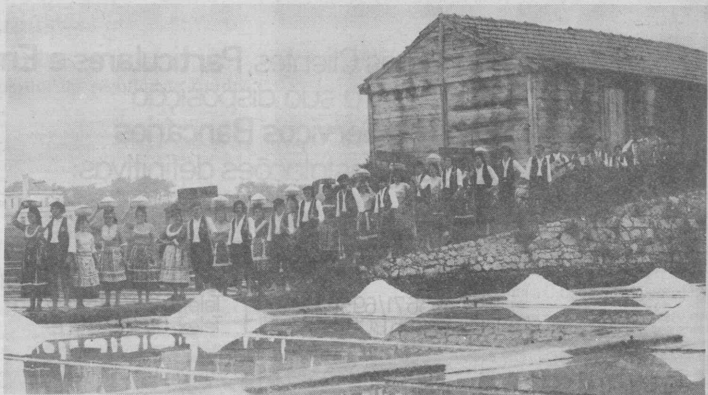
Enquadrado pelo ambiente típico da freguesia, o Rancho das «Salineiras de Lavos» é digno representante do folclore e etnografia da margem sul do Mondego.

No dia 23, à noite, haverá «Fogueiras de S. João» e actuarão a Charanga local, o Conjunto Musical Infantil «Juventa» e o Rancho Folclórico Infantil «As Salineiras de Lavos». Finalmente no dia 24 (dia de S. João), às 9 horas, realizar-se-á uma manhã desportiva que incluirá provas de ciclismo, para todas as idades e, às 20 horas, terá lugar um arraial abrihantado pelo Conjunto «Gloub Sounds».