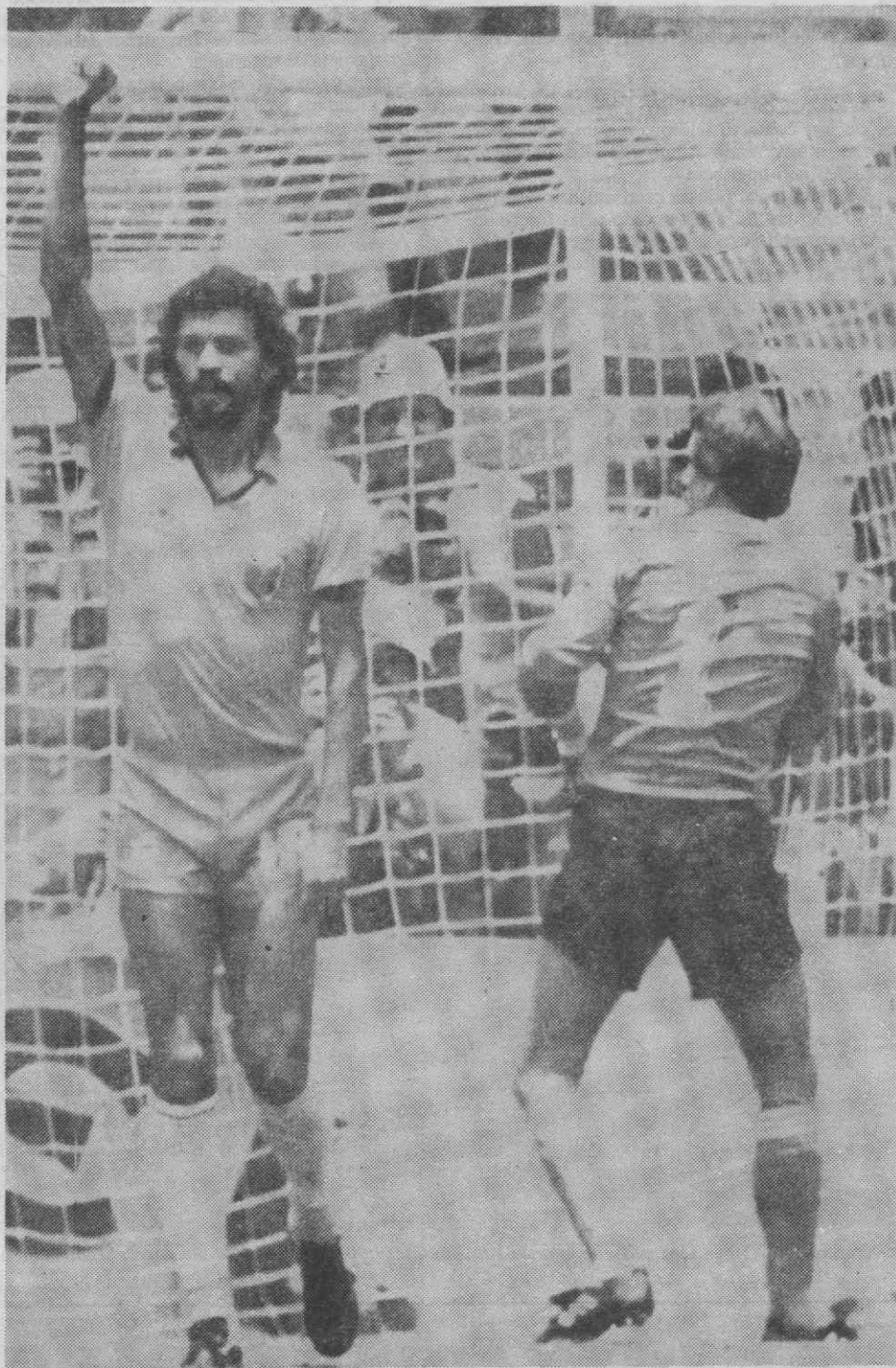
GUADALAJARA — Sócrates celebra primeiro golo do Brasil com o guarda-redes polaco em desalento.

Os dois treinadores prevêm um jogo muito difícil para as suas equipas e manifestam respeito pelo adversário, embora Piontek seja mais positivo na sua apreciação: «agora é a vida ou