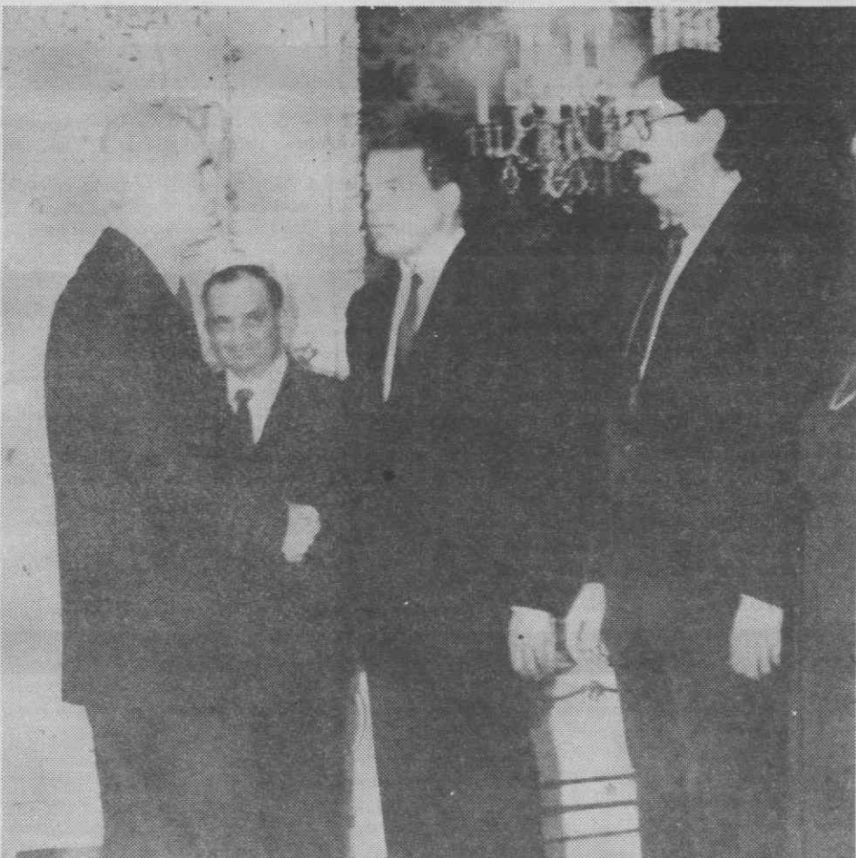
VIENA — O novo Chanceler austriaco Franz Vranitzksky presta juramento perante o Presidente Rudolf Kirchlaeger.

Reagan tem reiterado por diversas ocasiões a posição norte-americana segundo a qual qualquer resolução terá de passar pela retirada de todas as tropas soviéticas e por um método que permita aos afegãos determinar a sua própria forma de Governo.