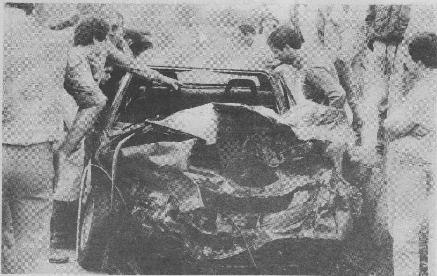
O ligeiro de passageiros ficou quase completamente destruído.

Como noticiámos na nossa edição de ontem, do acidente resultaram dois feridos, os condutores do pesado e do ligeiro. Segundo apurámos junto de fonte do Hospital de Águeda, os feridos tiveram já alta, pelo que puderam seguir os seus destinos.