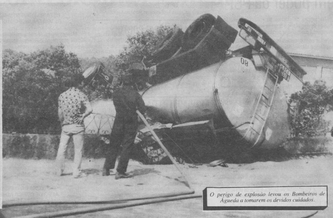
O perigo de explosão levou os Bombeiros de Águeda a tomarem os devidos cuidados.