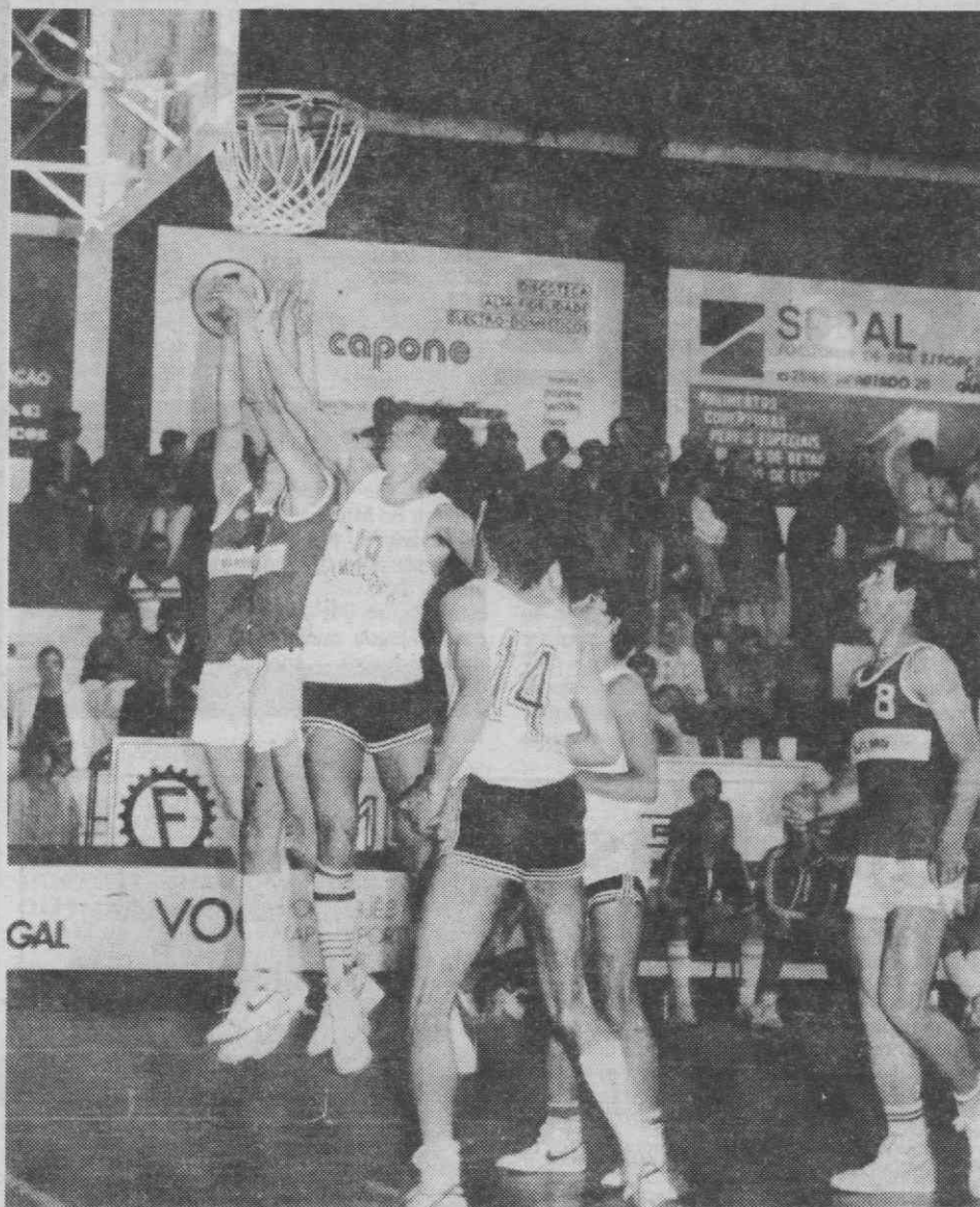
Esta época a equipa do ARCA só uma vez venceu o Ginásio Figueirense, mas nesta partida a que a foto se reporta, podiam ter dado mais luta mas os «nervos» não deixaram.

Uma surpresa nesta prova foi a derrota do ARCA frente ao Atlético e que não estava nas privações, dado que a equipa do Norte é de valor muito superior.