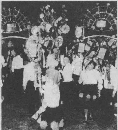
As «marchas» dão, sem dúvida, um ar alfacinha à noite de S. João da Figueira da Foz. Porém, pela sua vida e cor este acto é um dos que mais prende a atenção do público.

No final, também em procissão, a imagem de S. João regressará à Igreja Matriz.