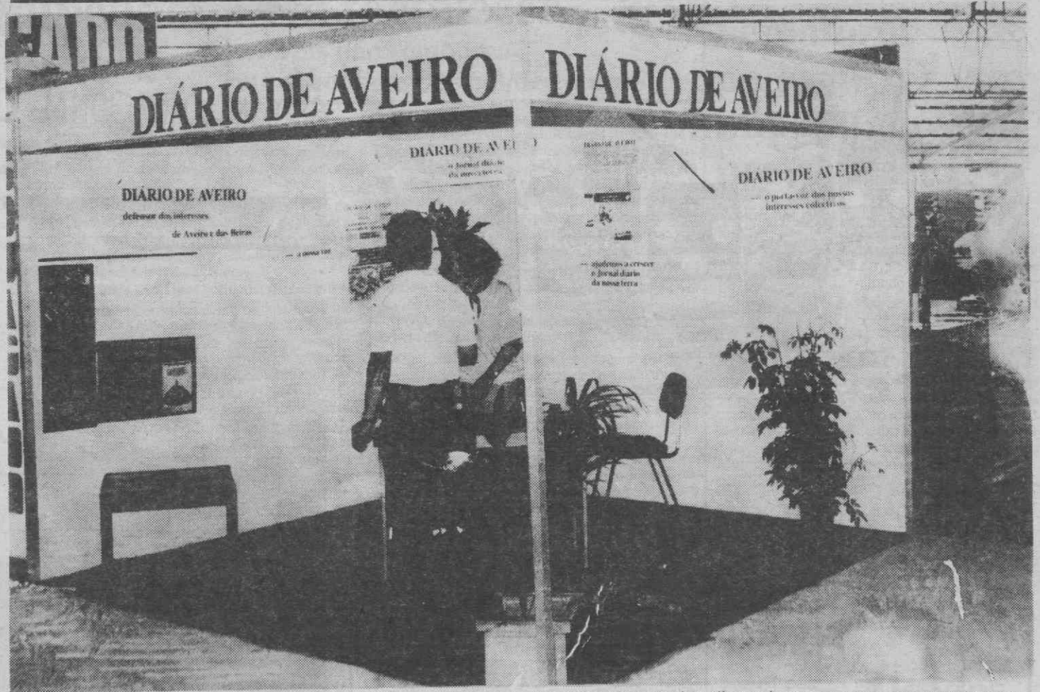
Pelo nosso «stand» na Agrovouga têm passado milhares de pessoas que tomam contacto com a realidade de um jornal diário ao serviço da região de Aveiro e das Beiras e que ao mundo agrícola dedica uma atenção especial.