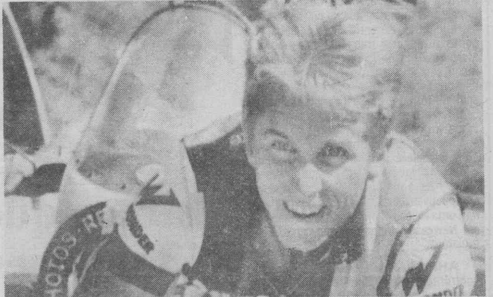
SUPERBAGNERES (França) — Tour de França — o ciclista norte-americano, Greg Lemond, a caminho da vitória na etapa de ontem do Tour.

O francês Bernard Hinault, cinco vezes vencedor da Volta à França, conservou a camisola amarela da prova.