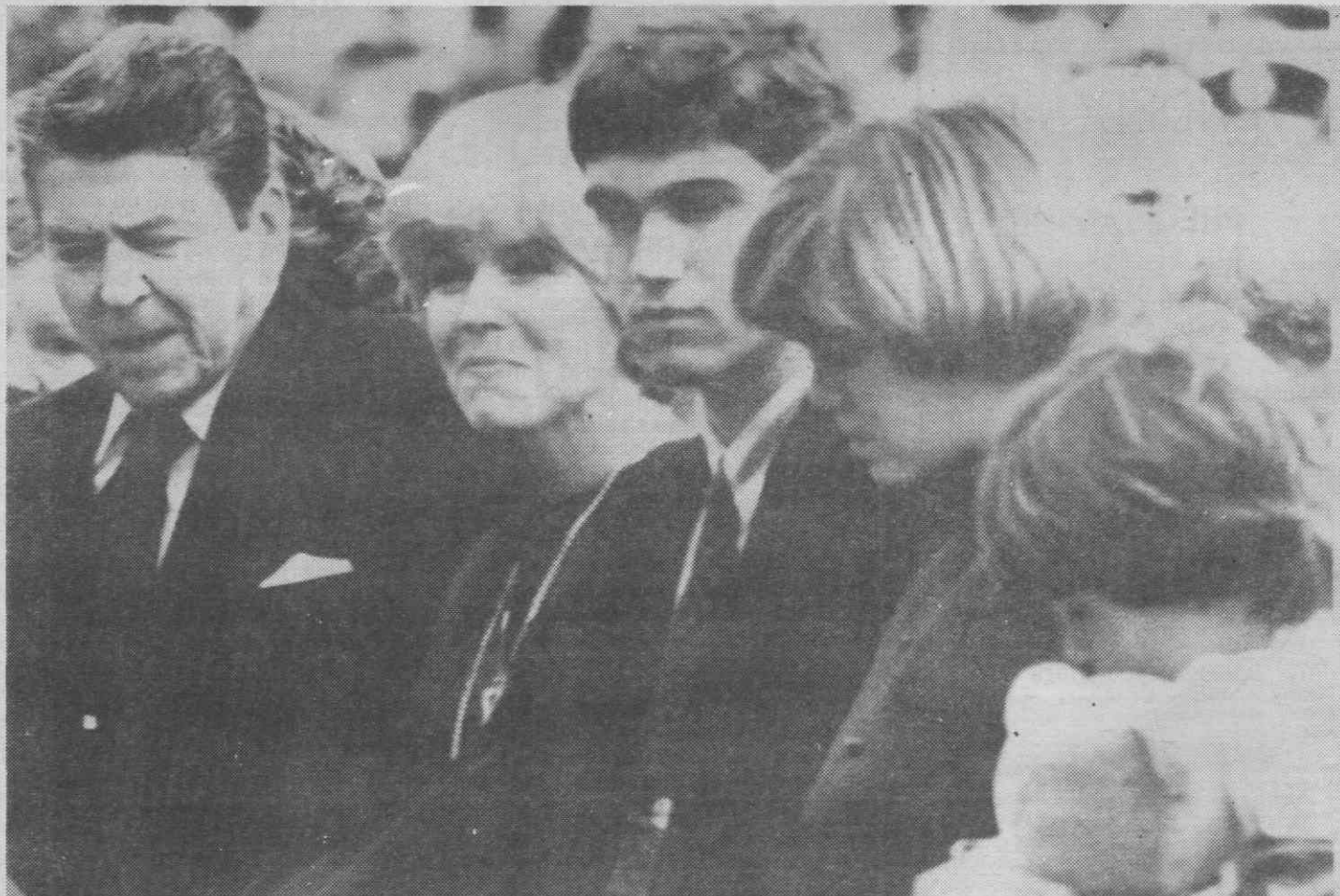
WASHINGTON — Foto de arquivo tirada durante as cerimónias fúnebres do co-piloto da nave «Challenger», Michael J. Smith, os seus familiares foram os primeiros a reclamar uma indemnização à NASA de 15,1 milhões de dólares. «Diário de Aveiro».

O senador pede uma pena de prisão até cinco anos e uma multa de 250 000 dólares para quem for condenado por casamento fraudulento.