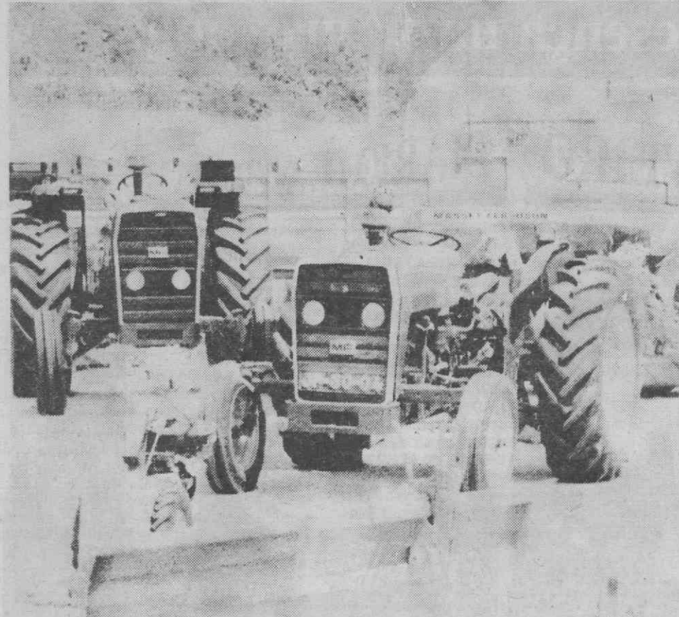
Maquinaria agrícola é outra das fortes presenças na Agrovouga. Um largo sector da Feira está preenchido pela exposição de maquinaria agrícola.