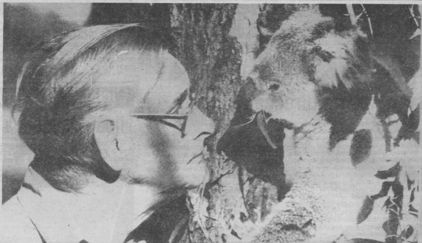
SYDNEY — O recentemente retirado especialista em tratamento de koalas do Zoo de Taronga, observa uma espécie daquela engraçada raça, junto dum eucalipto. Os koalas estão a ser afectados pelo «stress» que os especialistas pensam ser o responsável pela pouca resistência dos koalas à doença.

A Indonésia invadiu a parte ocidental de Timor-Leste em Dezembro de 1975.