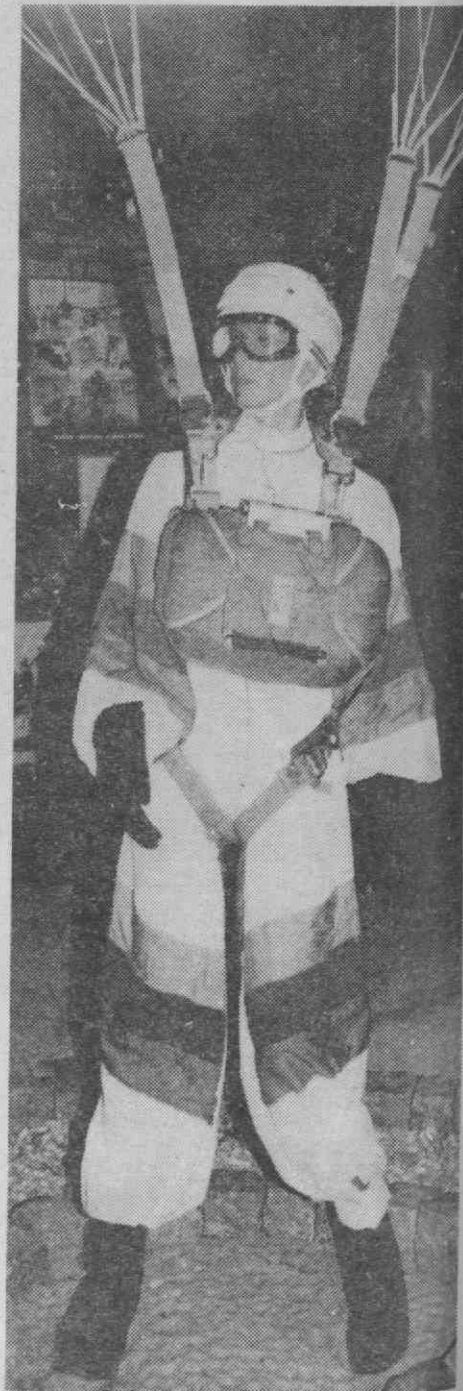
Um moderno equipamento de salto.