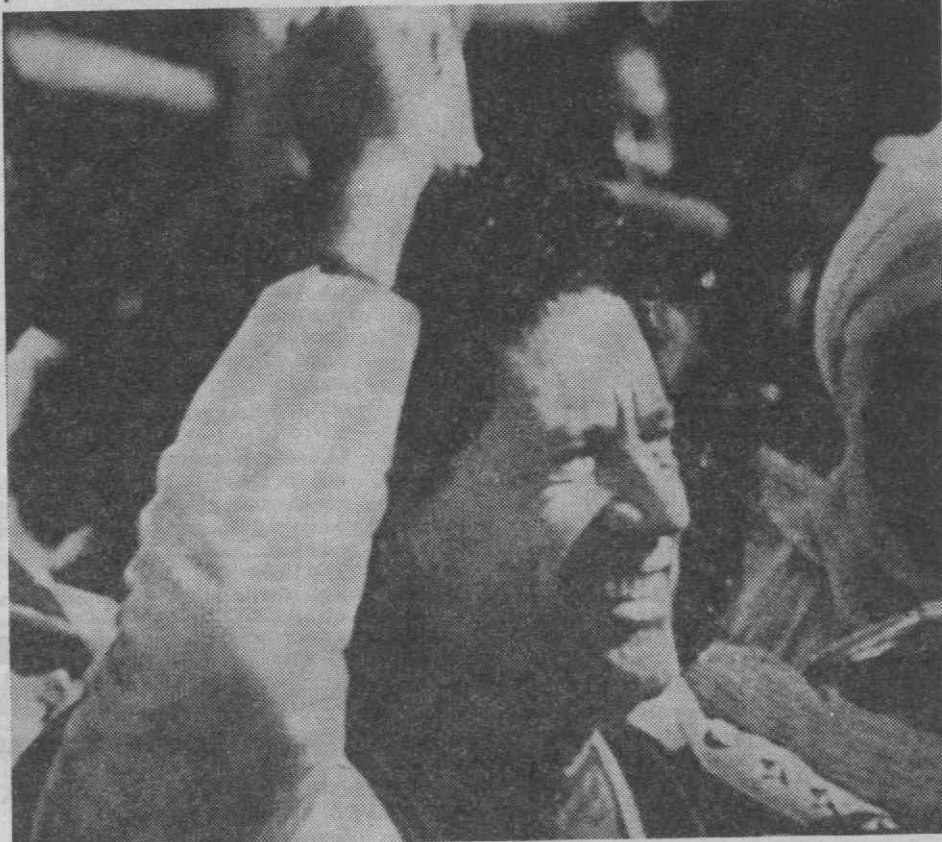
HARARE — O líder líbio, Khadafy, gritando «slogans» anti-americanos, à saída da Conferência dos Não-Alinhados.

«Devemos fazer um bloco para destruir o campo do imperialismo» — disse, sugerindo que, para fazer esse bloco, todos se unam aos «países socialistas e ao Pacto de Varsóvia».