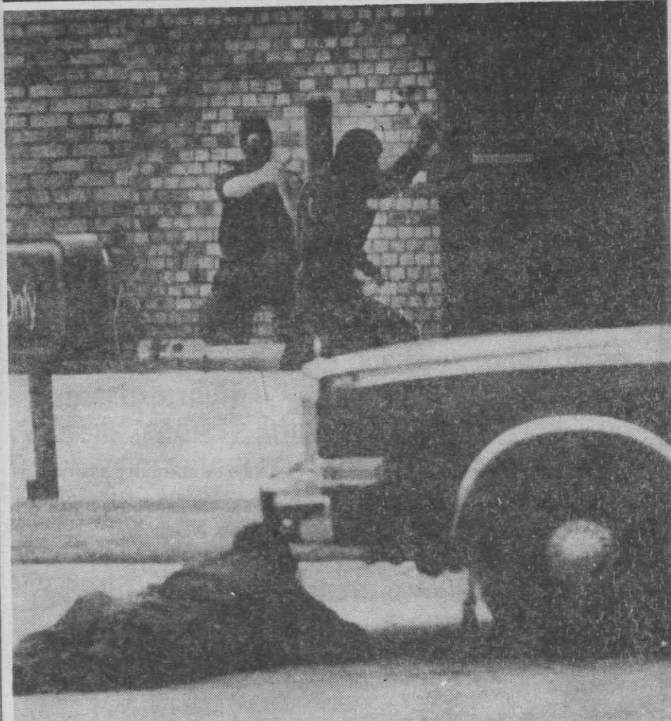
OKLAHOMA, (EUA) — Policiais mascarados partem as janelas dum restaurante nesta cidade, depois de terem abortado um assalto feito por dois ladrões a este estabelecimento. Quando entraram encontraram os assaltantes mortos. Aparentemente cometeram suicídio.

No que concerne ao E-111, o tal «passaporte azul» que confere ao proprietário o direito à assistência médica e medicamentosa quando em viagem pelos países da CEE, no mês de Agosto passado na região de Aveiro foram passados 339.