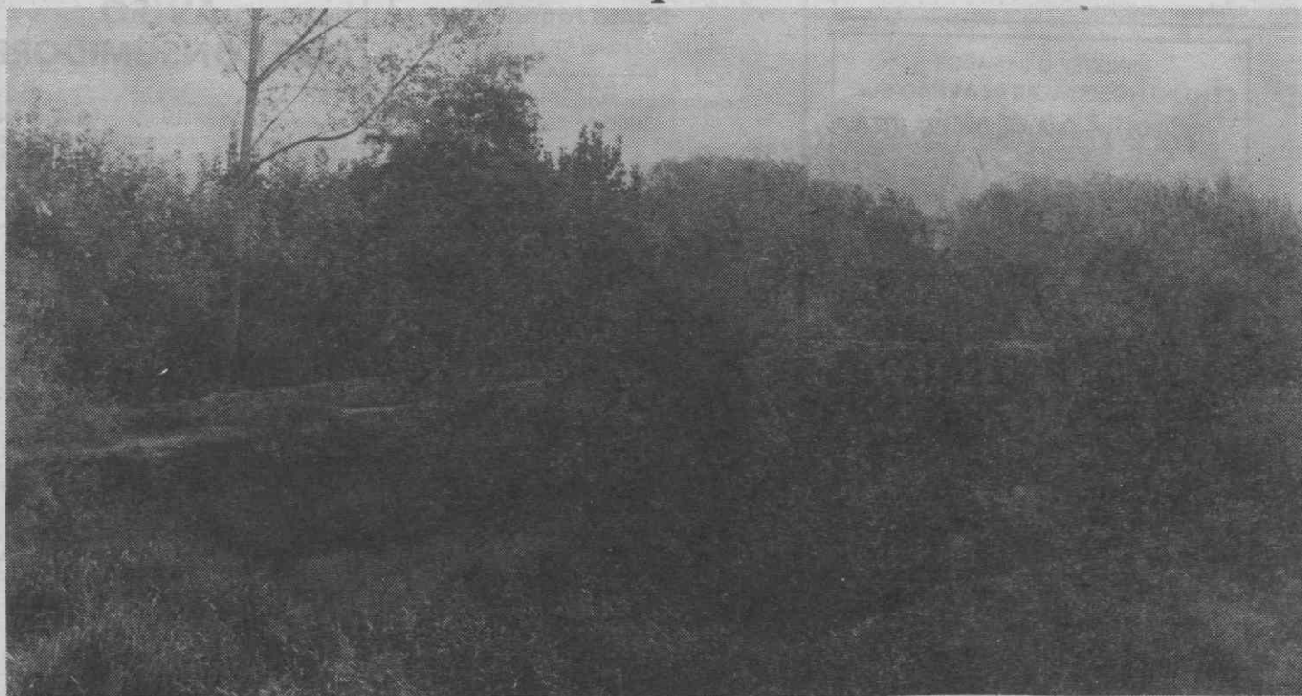
Um aspecto da ponte sobre o Marnel.

Tema frequentemente abordado nos mais diversos meios, a necessidade de preservar o património histórico existente não é, muitas vezes, satisfeita. No concelho de Águeda, mais propriamente na freguesia de Lamas do Vouga, esse facto é evidente. Naquela freguesia localizam-se dois dos mais importantes legados históricos, as ruínas romanas do Cabeço do Vouga e a ponte sobre o Marnel.