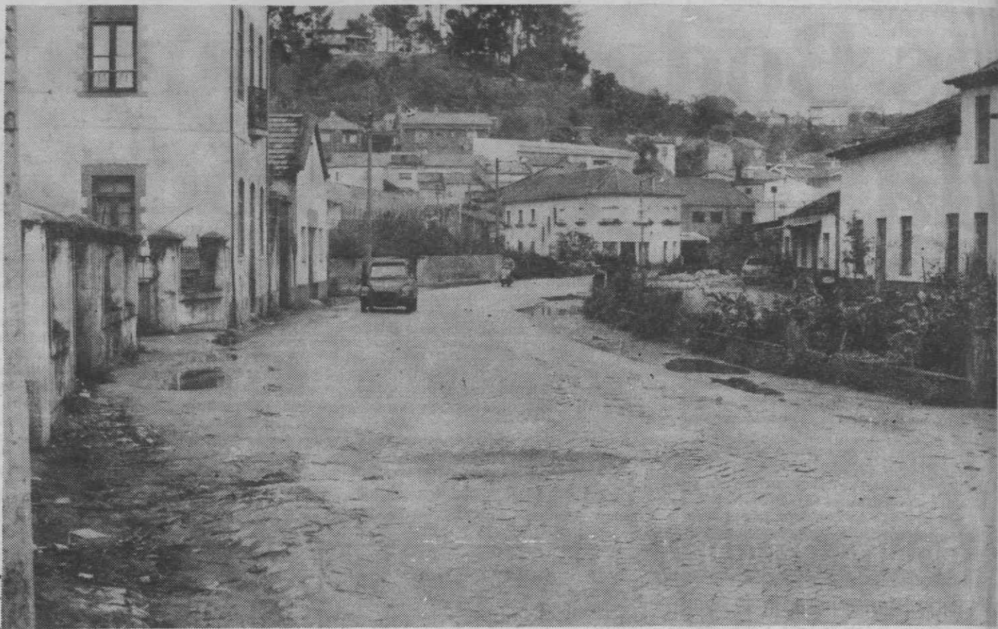
Em Assequins, a EN 230, apesar das promessas, continua em estado lastimoso.

Decorre o mês de Setembro e os automobilistas que são obrigados a utilizar a EN 230 continuam a circular por uma via cuja degradação é cada vez maior apesar das promessas, o troço de Assequins da EN 230 continua na mesma, com todos os prejuízos que esse facto acarreta, não só para os condutores de veículos, mas também para as populações. Aproxima-se a temporada das chuvas e, decerto, não será nessa altura que a JAE irá executar os melhoramentos prometidos. Assequins vai ter de esperar pelo próximo Verão?