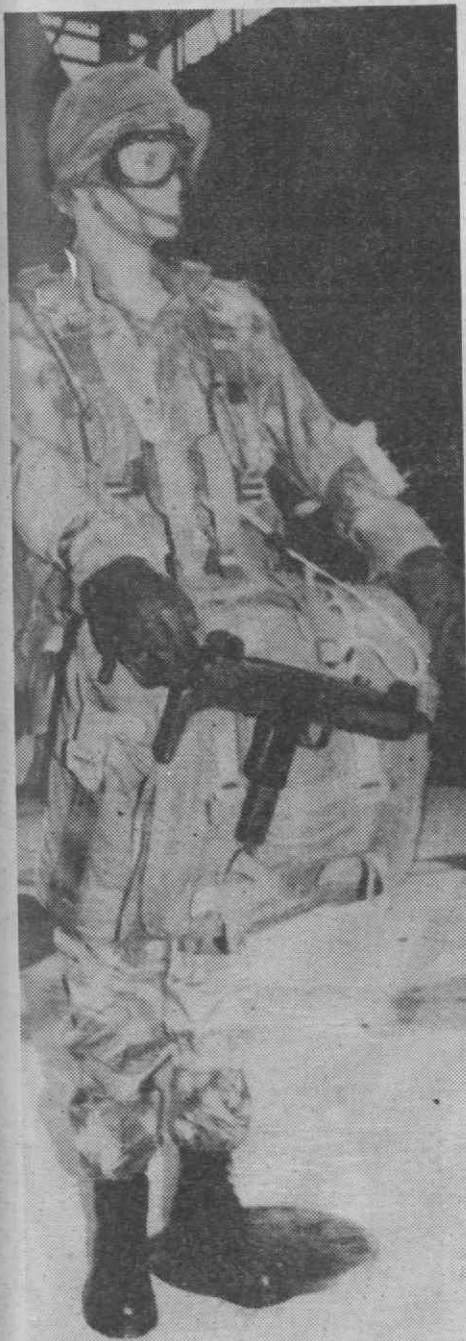
Um equipamento clássico de para-quadista, em combate.

Pára-quedaismo militar é tema de exposição em Aveiro