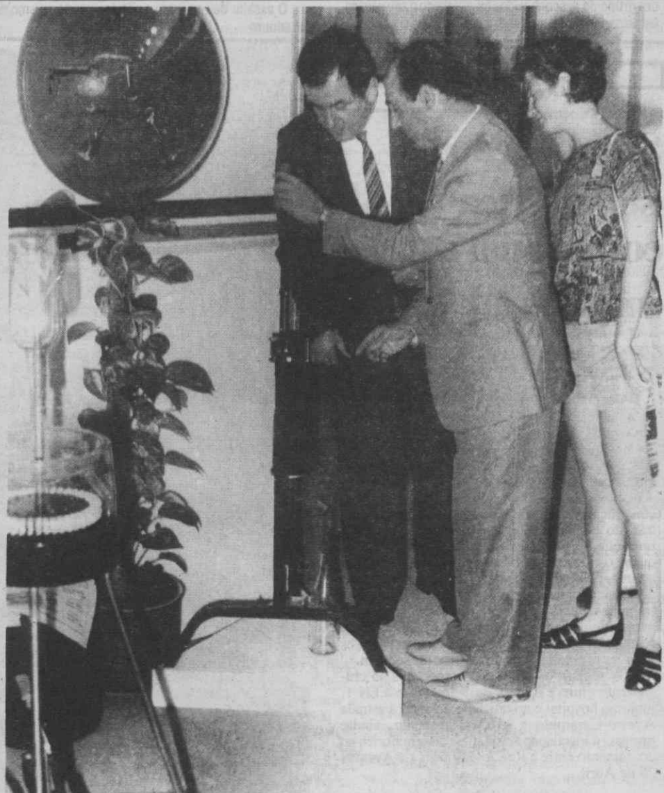
O embaixador da Polónia quando visitava a Expoágueda/Subcontrata, acompanhado por Augusto Gonçalves, presidente da AIA.

Sobre as possibilidades de incrementação das relações comerciais entre empresas da região e a Polónia, o embaixador daquele País em Lisboa diria: «as possibilidades existentes de trocas comerciais entre os nossos países devem ser estudadas por especialistas e, desde já, penso que vale a pena incrementar os contactos com o conselheiro comercial da Embaixada polaca». A rematar, Boguslaw Zakrzewski opinou que «Portugal e a Polónia estão ainda numa fase de reconhecimento mútuo», acrescentando que «a Polónia está interessada em cooperar com Portugal».