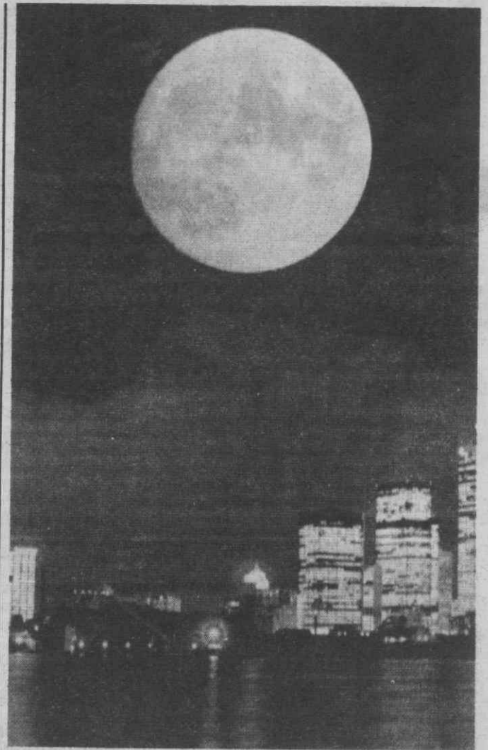
TORONTO — Montagem de dois disparos numa foto sobre esta cidade à noite e da Lua cheia formando uma agradável composição.