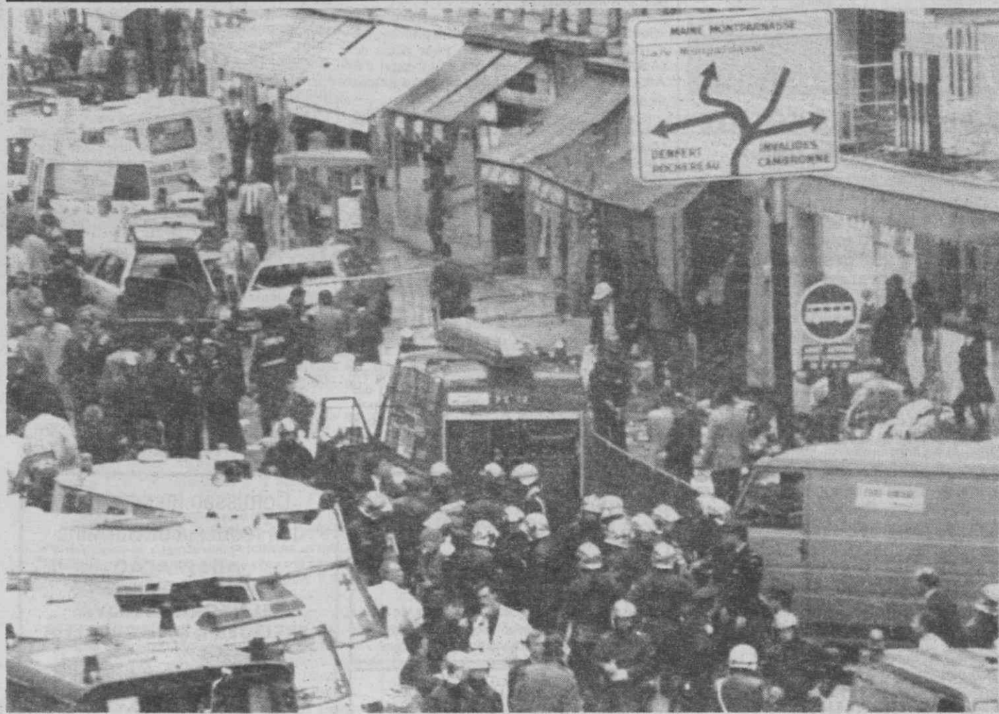
PARIS — Cena da explosão em pronto-a-vestir com bombeiros e ambulâncias no local. (Telefoto Reuter/NP) - Diário de Aveiro -

Foi igualmente aprovado um diploma que reforça as exigências às empresas responsáveis pela segurança dos elevadores, em ordem a evitar «acidentes» que lamentavelmente se vêm verificando». A legislação agora aprovada sobre esta matéria vem substituir outra «já completamente desactualizada que datava de há quase 20 anos».