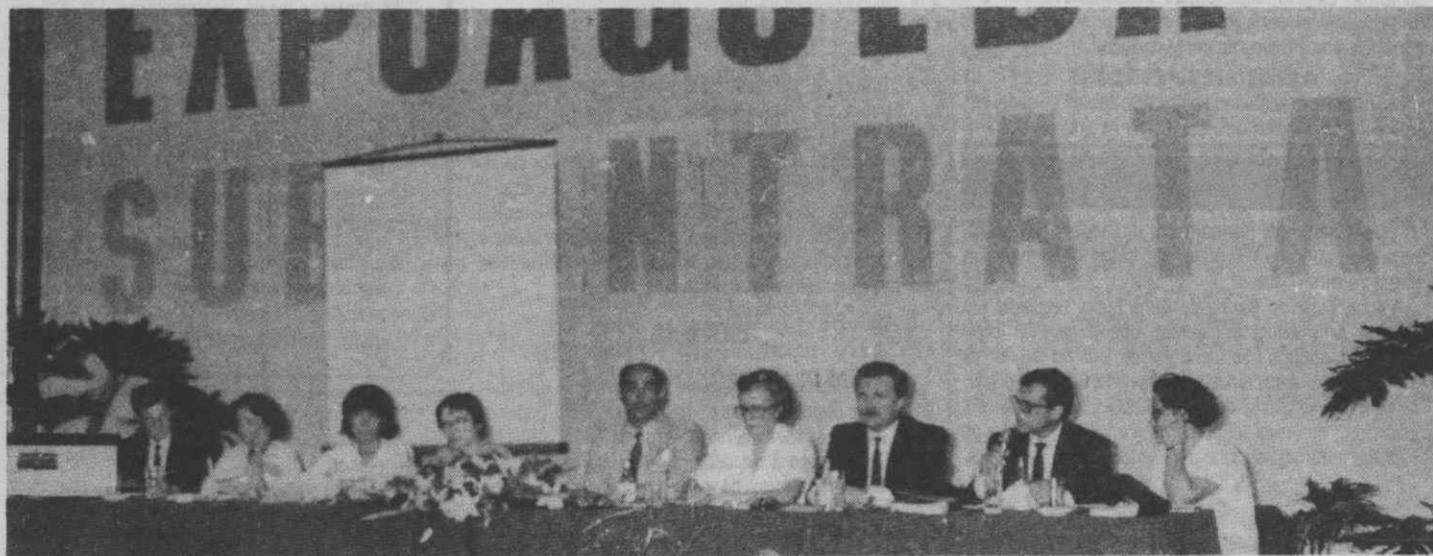
Aspecto do primeiro colóquio realizado na Expoágueda/Subcontrata-86.