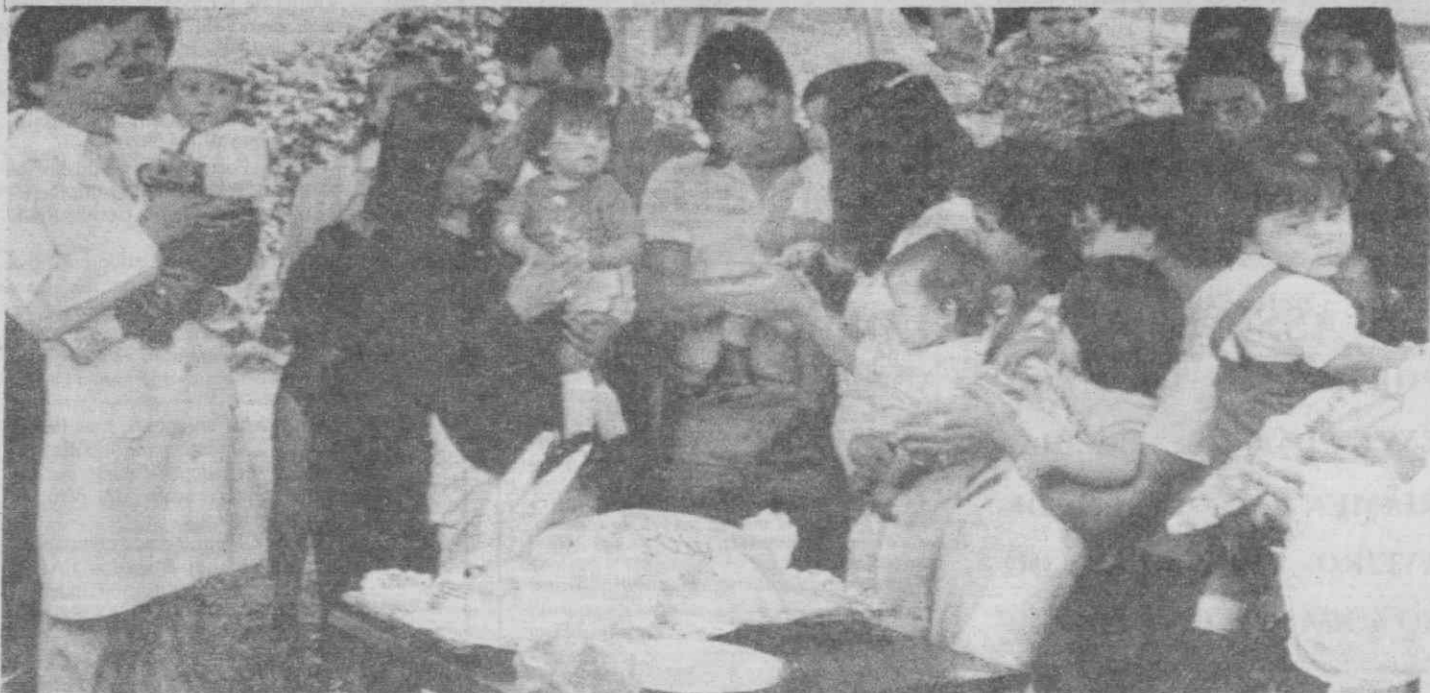
CIDADE DO MEXICO — Algumas das crianças sobreviventes do tremor de terra do ano passado, e que na altura estavam no hospital infantil desta cidade, com os seus familiares numa festa em sua honra.

O terramoto, que atingiu a magnitude de 8,1 na Escala de Richter, fez mais de 20 mil mortos e cerca de quatro mil milhões de dólares de prejuízos materiais.