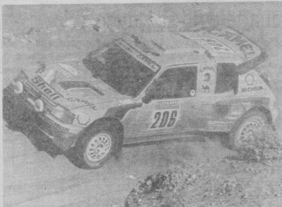
EL GOLEA (Argélia) — Rali Paris-Dakar: A dupla queniana Nehta-Doughty em «Peugeot 205 Turbo» em acção.

«Seria pena — adianta a editorialista — pois os resultados da Seleção Portuguesa nos últimos anos demonstram a boa saúde e as possibilidades dos jogadores portugueses».