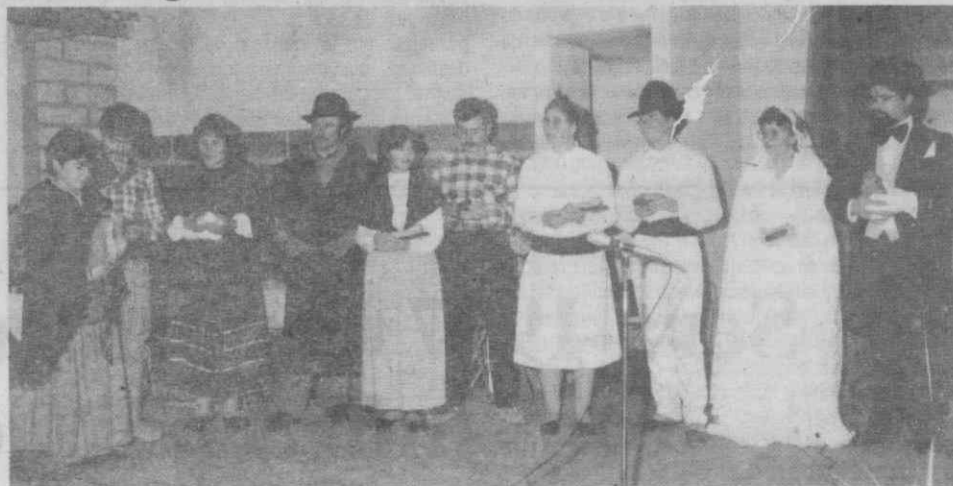
Grupo Folclórico do Centro Social e Paroquial de Santo António.

Apesar de previamente convidada, a Câmara Municipal de Vagos não se fez representar na final do concurso «História da Nossa Terra», que o Grupo Folclórico do «Centro Social e Paroquial de Santo António» levou a efeito.