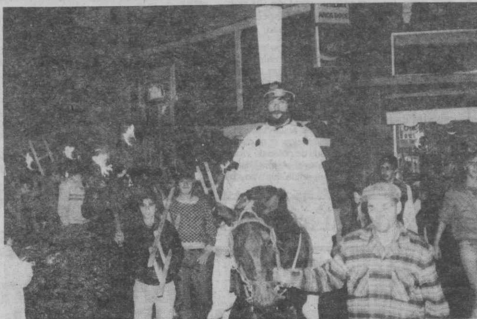
Os tradicionais archotes, empunhados por jovens, enquadram a figura de um dos Reis Magos, cuja montada é conduzida não por qualquer figura bíblica mas sim por típico «pescador» figueirense.

Apesar de tudo o que tem sido dito, ainda não foi desta vez que os indiferentes ou detractores viram a tradição dos Reis banida dos hábitos artístico-culturais figueirenses. No entanto, justo será distinguir tanto a colectividade promotora como os participantes nesta curiosa manifestação, como acto da mais elementar justiça.