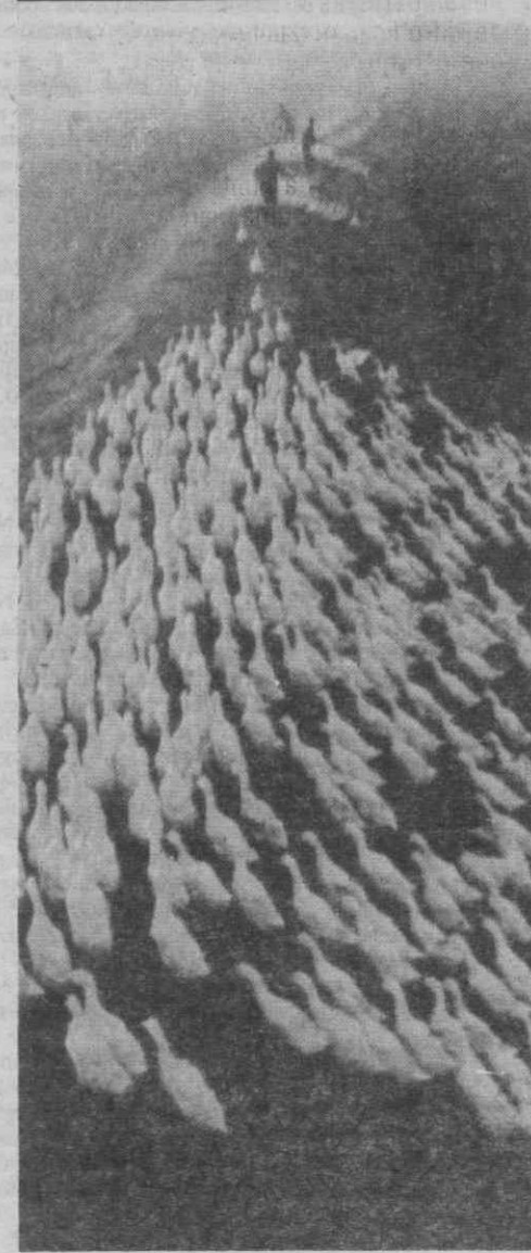
HUZHOU (China) — Camponeses de Huzhou na província de Zhejiang na sua tarefa diária de levar os seus gansos e patos para o lago mais próximo.