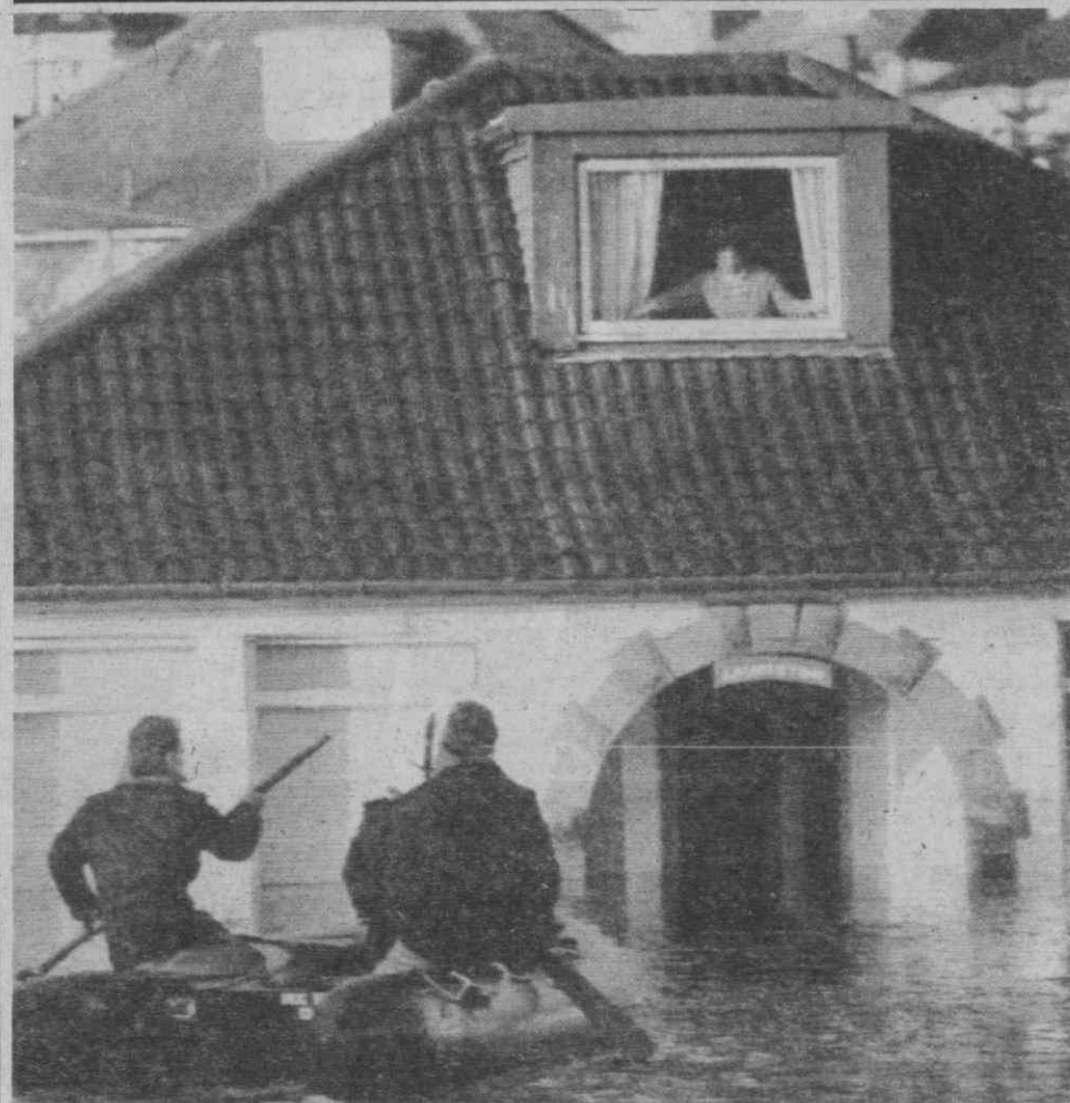
GLASGOW (Escócia) — Dois polícias utilizam botes de borracha para irem em auxílio duma residente que ficou presa em sua própria casa devido às inundações provocadas pela ruptura numa conduta principal.