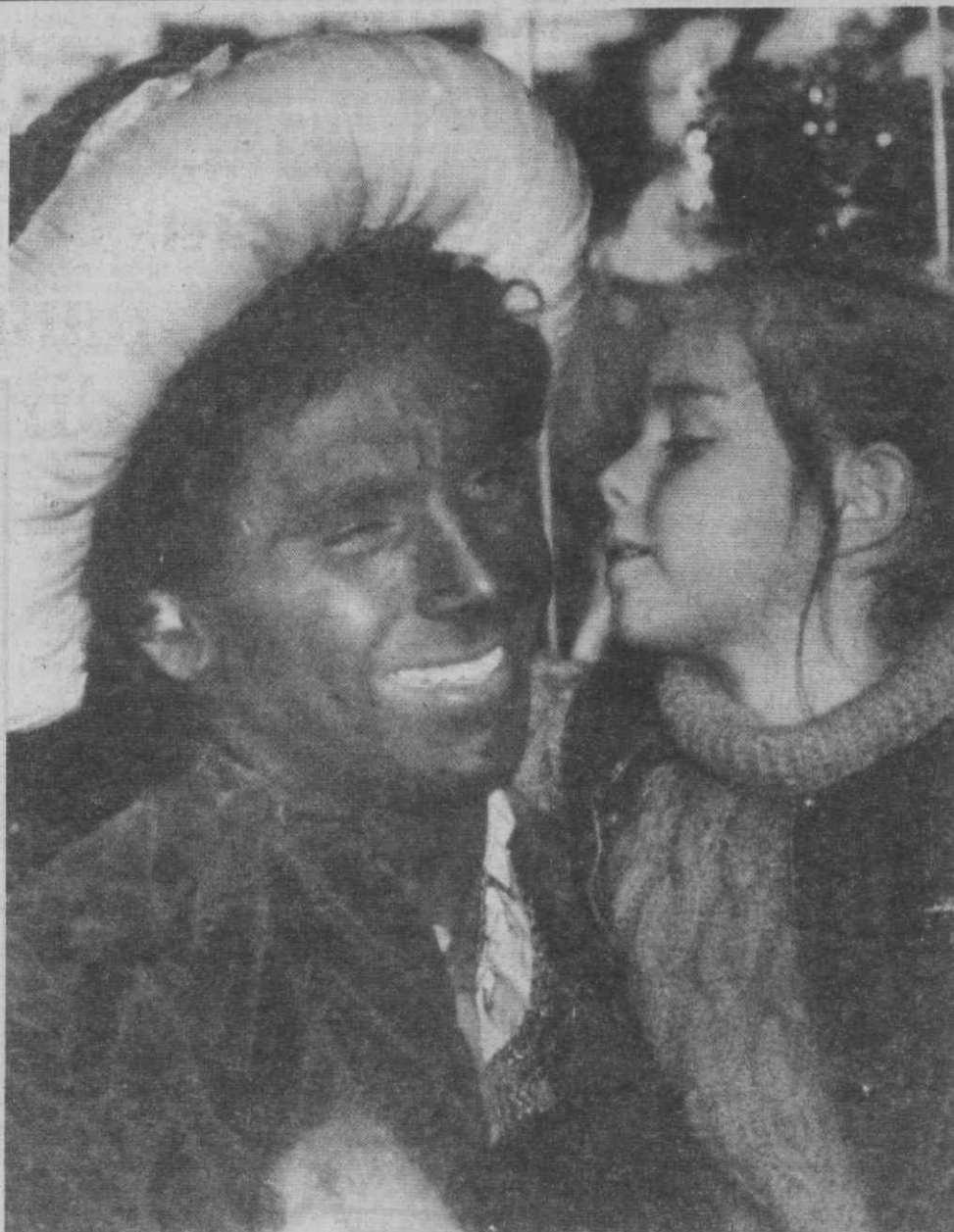
MADRID — O famoso futebolista mexicano, Hugo Sanchez, com a cara pintada de preto para se assemelhar a Baltazar, um dos 3 Reis Magos, com uma criança ao colo durante uma festa de caridade em que participaram alguns jogadores do Real Madrid.