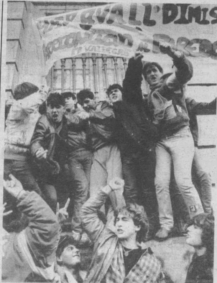
MADRID — Estudantes com cartazes a exigirem a demissão do ministro da Educação durante manifestação.