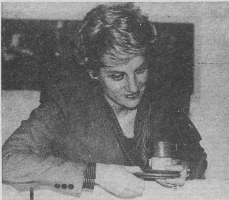
LONDRES — A princesa Diana sorridente ao tomar chá durante visita à escola de surdos mudos.