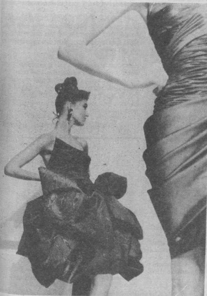
PARIS — Moda de Emanuel Ungaro.

Fontes políticas salientaram que inquérito terá por objectivo melhorar a imagem da força policial do país, afectada por disputas públicas e pelo fracasso em encontrar o homem armado que assassinou Palme há 11 meses.