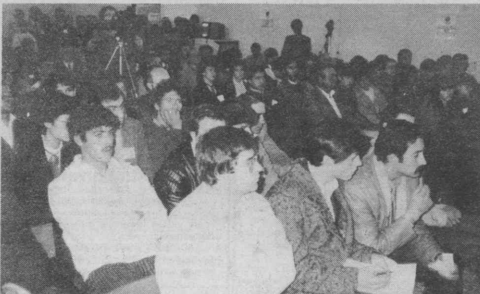
Aspecto de assistência que participou no II Encontro Distrital de Jovens e Associações Juvenis, organizado pelo FAOJ.

Era importante no entanto que as associações se fossem capacitando, cada vez mais, que o apoio que podem receber dos diversos organismos não têm que ser forçosamente financeiros mas sobretudo formativo, na certeza de que este é o primeiro e mais importante passo para o alicerçar correcto de uma associação. E isso parece que está a ser compreendido pelos jovens, que cada vez mais se vão valorizando, catapultando nas suas acções as comunidades em que se inserem.