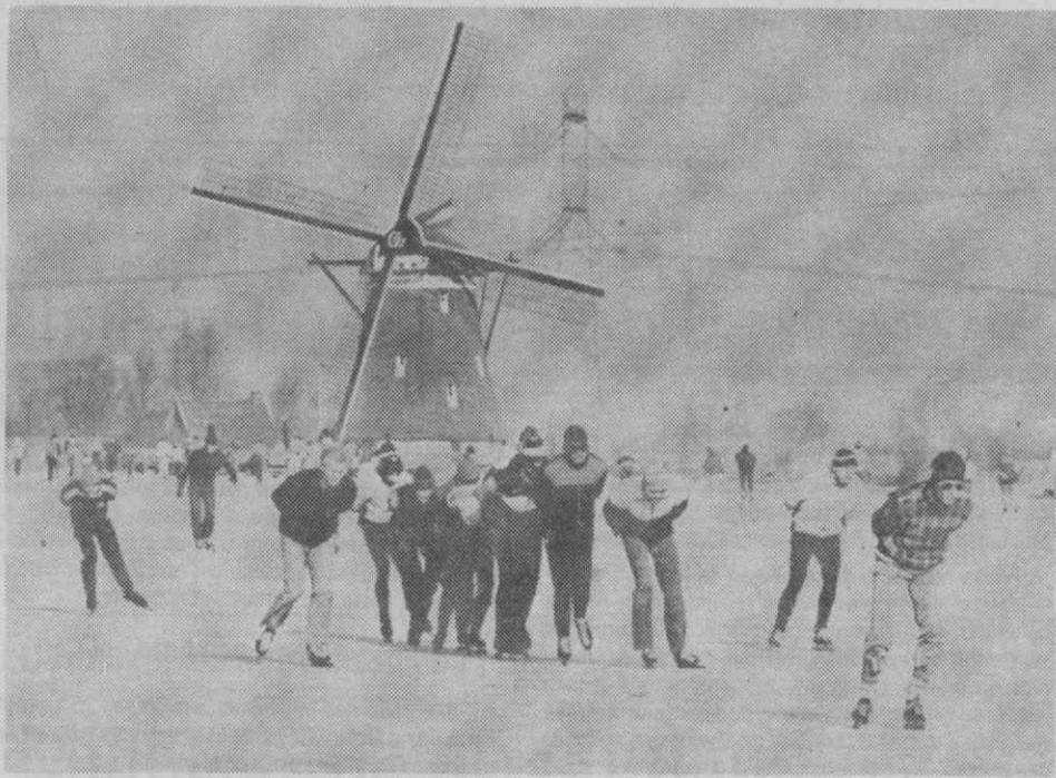
ZEVENHUIZEN (Holanda) — Jovens aproveitam a continuação do Inverno para praticarem corridas de patins tendo por fundo os conhecidos moinhos de vento.

Um porta-voz do Departamento da Defesa revelou ainda que o Exército dos Estados Unidos terá a responsabilidade pelo cumprimento da transacção, acrescentando que as armas serão fornecidas através da «abertura de concurso».