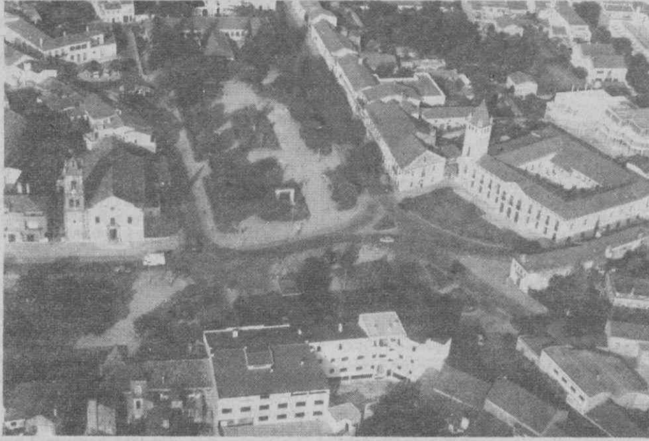
Panorâmica aérea (recente) do perímetro central da vila de Cantanhede vendo-se à direita o edifício da 'Domus Municipalis' com o seu torreão e à esquerda com a sua torre a Igreja Matriz Paroquial.

Julgamos, no entanto, que tal projecto vai demorar para a sua realização, o que não invalida de que tenhamos fé e saibamos esperar — como conceito aplicado pelo Conde de Monte Cristo.