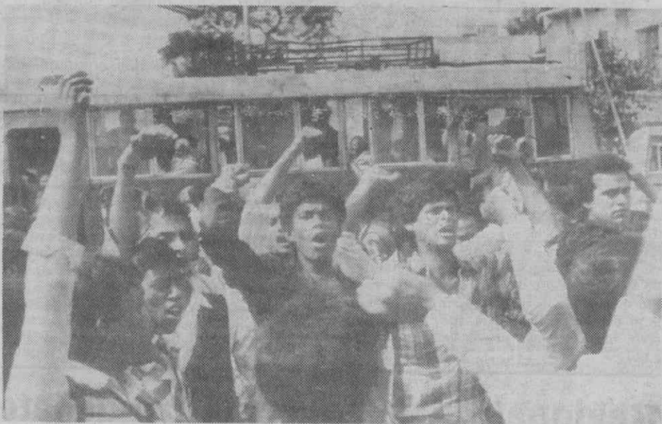
DHAKA — Manifestação estudantil contra a decisão governamental de aumentar os preços dos bilhetes dos transportes públicos.

Os ladrões do quadro, vários dos quais foram presos, estão implicados no assassinio de um homem cujo cadáver foi encontrado há um mês e que esteve ligado ao furto, disse a mesma fonte.