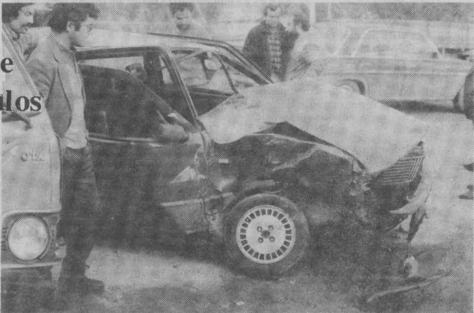
Os estragos numa das viaturas é bem visível.

A noite haverá um espectáculo de variedades, que dará por terminada a festa comemorativa dos seis meses de emissões regulares da Rádio Bairrada.