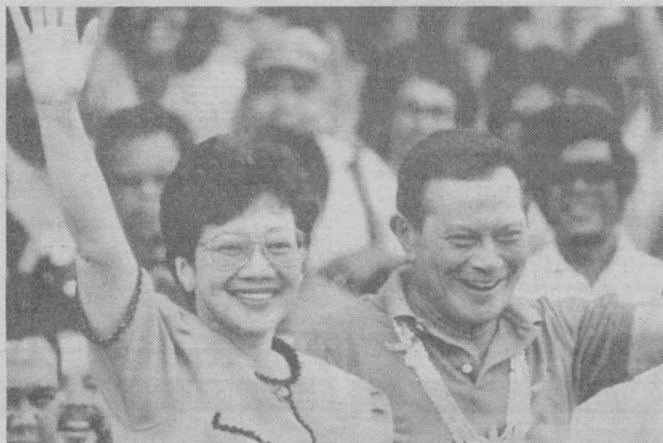
Corazon Aquino e o vice-presidente Salvador Laurel

A ratificação da nova Constituição deverá