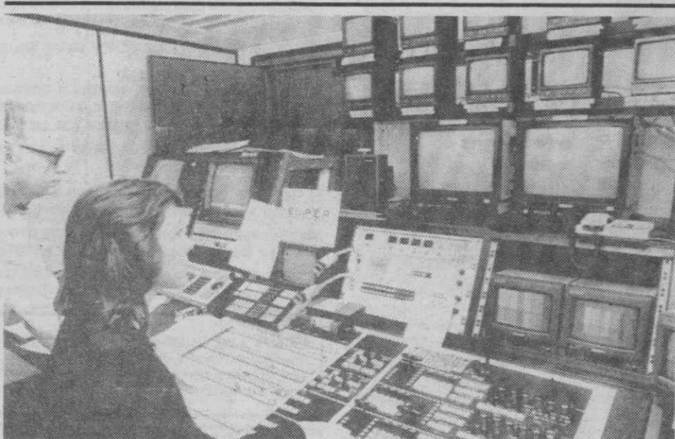
LONDRES — Aspecto interior duma das salas de controlo do «Super Canal», um serviço pan-europeu de televisão via-satélite que foi lançado no passado dia 30 de Janeiro.

em comunicado divulgado em Libreville, capital do Gabão, que decidiu juntar-se às forças do Presidente Habré e trabalhar pela unidade nacional.