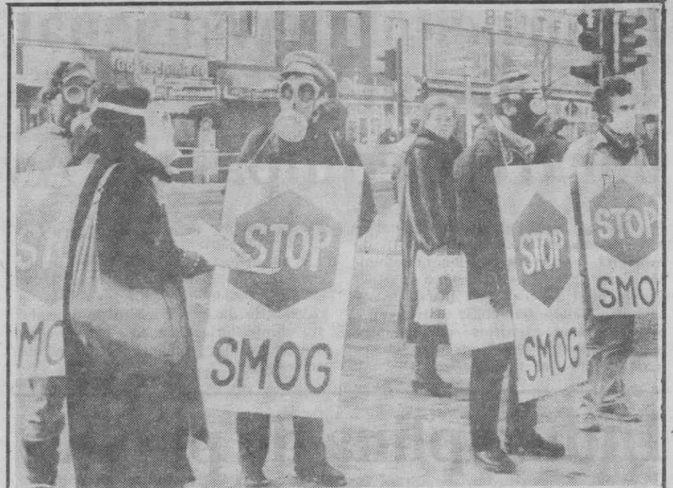
BERLIM — Um grupo ecologista, com máscaras e fatos especiais, durante manifestação contra à poluição causada pelo tráfico.