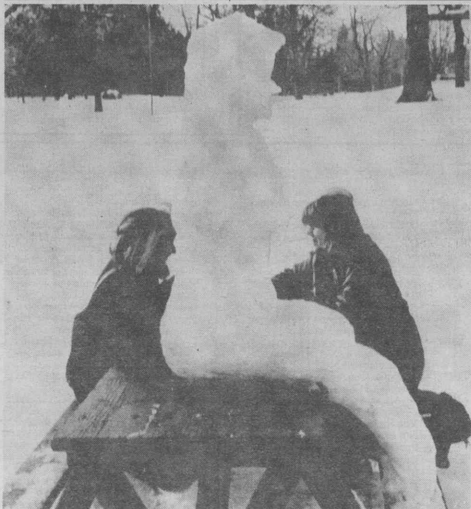
TORONTO — Duas jovens sentadas a uma mesa de piquenique, tendo como companhia uma escultura de gelo representando uma mulher sem braços, em pleno parque de Toronto.

As carteiras de encomendas globais degradaram-se em todos os ramos, salvo na indústria automobilística e petrolífera, refere o Instituto.