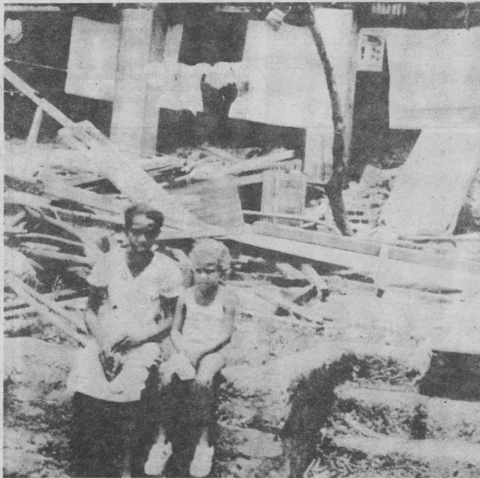
PORT VILA (Ilhas Pacífico) — Dois residentes locais junto aos destroços da sua casa, na sequência da passagem do tufão «Uma».