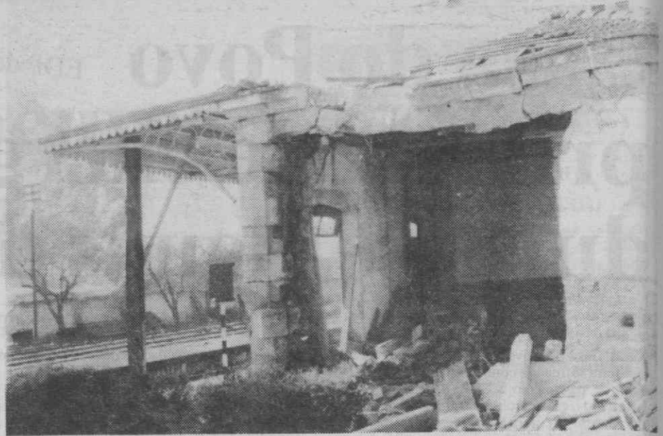
Aspecto lateral do edifício da estação ferroviária de Cantanhede, após embate de um vagão desgovernado.

Uma outra curiosidade: o chefe da estação que estava em serviço aquando se deu a ocor-