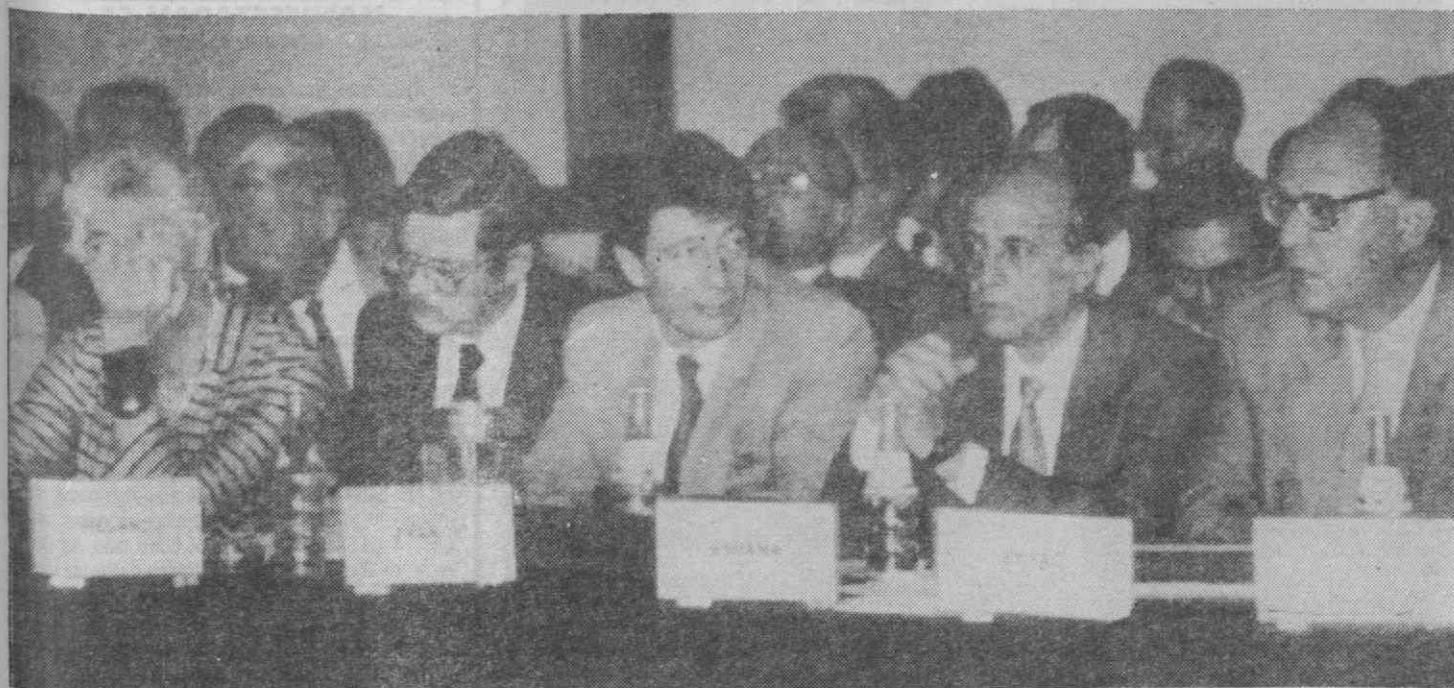
CIDADE DA GUATEMALA — Membros da CEE durante a sessão de encerramento da III Conferência dos MNE's dos países da América Central, da CEE e do Grupo de Contadora.

(«Diário de Aveiro», N.º 499, de 12-2-87).