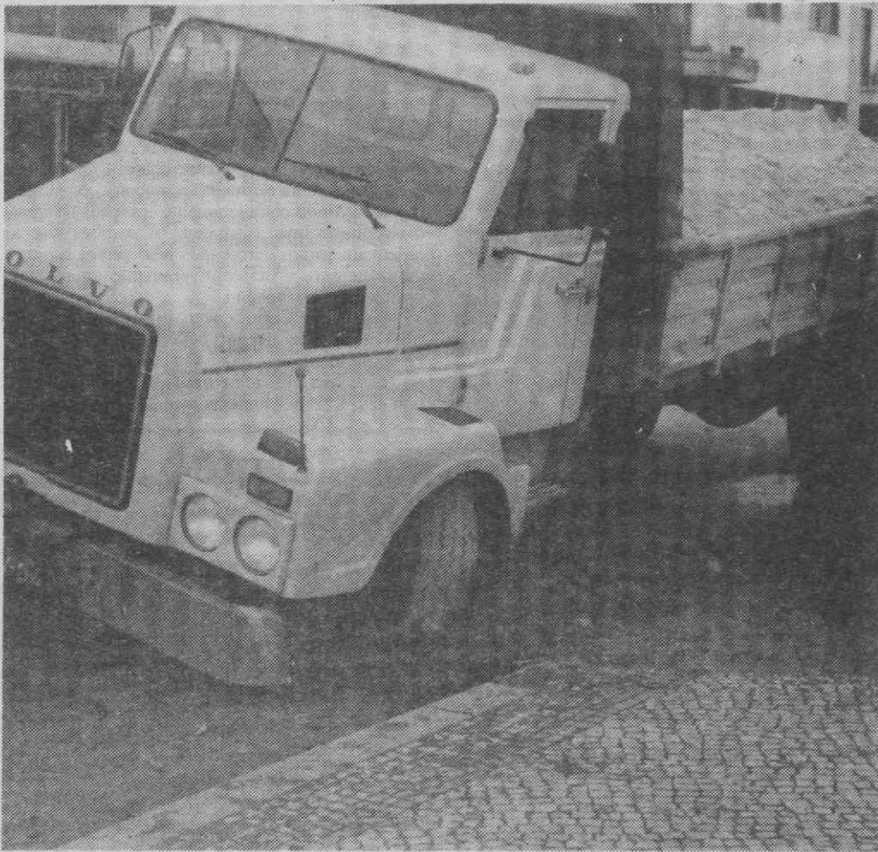
A «armadilha» montada no Largo Dr. António Breda deu os resultados que se podem ver na imagem.

Esquecimento? Incuria? Fosse o que fosse. Que situações inadmissíveis como esta não se repitam!