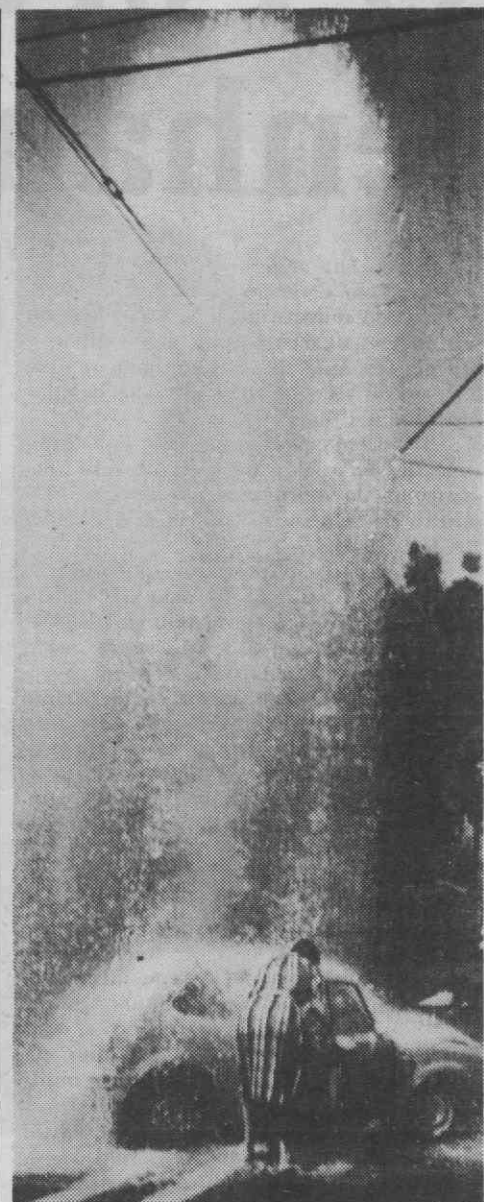
MELBOURNE — Uma automobilista tenta fechar as janelas do seu veículo após ter colidido com uma boca de incêndio, provocando o seu rebentamento.