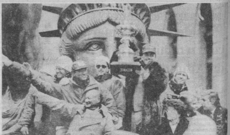
NOVA IORQUE — A tripulação do veleiro «Stars and Stripes», vencedora da Taça da América, mostra o troféu à multidão durante uma parada na 5.ª Avenida.