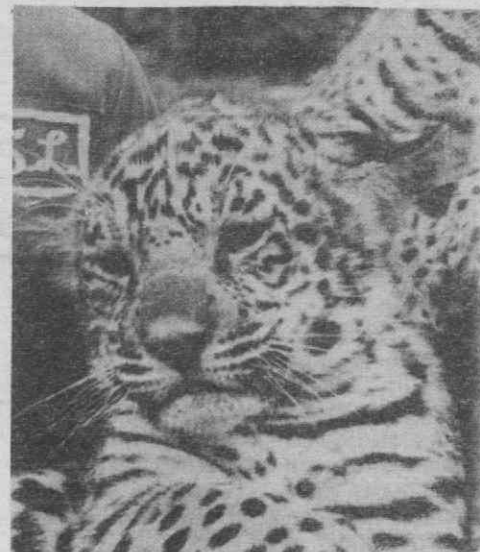
«Porque será que vemos apenas leopardos, lobo-tigres ou rinocerontes? Dantes os animais estavam por todo o lado», dizia o velho guia.

«Mas para onde foram todos os animais? Lamentava-se recentemente um antigo guia de safaris que, nos anos 50 e 60, mostrava os parques nacionais aos visitantes que, naquele tempo, eram contudo restritos.