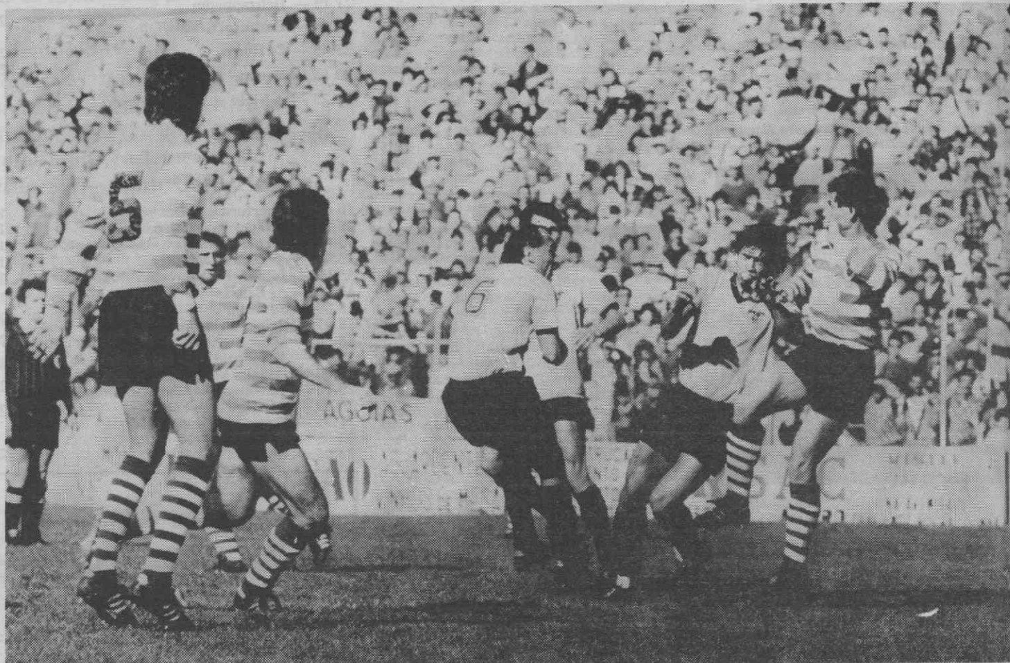
Uma jogada confusa do Beira Mar-Covilhã, com os jogadores todos a monte.

Ao contrário do que muito boa gente pensa acho que ainda é muito cedo para cantarmos vitória. Faltam ainda nove jogos e não posso esquecer que o Belenenses foi até considerado candidato ao título, veio por ali abaixo num instante porque durante dois meses não ganhou um único jogo. Vamos continuar com a nossa humildade e mesmo que esteja a exagerar um bocado dada a diferença pontual mais vale ter os pés bem assentes no chão e depois então faremos a testa bem tranquilos. Não contava ganhar este jogo, digo-o sinceramente, vinha para pontuar isso sim, como veio a acontecer e há uma coisa que também quero dizer: o Covilhã provou aqui em Aveiro, que não é por favores ou por acaso que vai na frente.