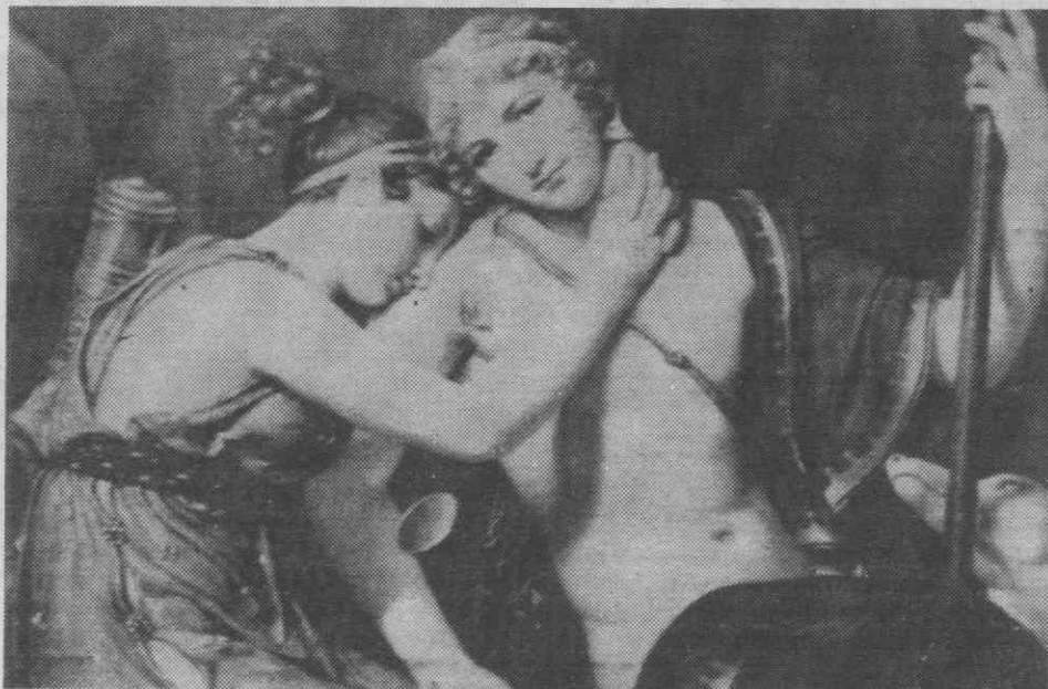
NOVA IORQUE — Mais uma obra de arte foi vendida num leilão desta cidade. Desta vez, trata-se do célebre quadro de David «Despedida da Telémaco e Eucaris».

A noticia, da agência EFE, é omissa quanto à reacção da mãe que provavelmente terá deserdado tal «filho tão querido».