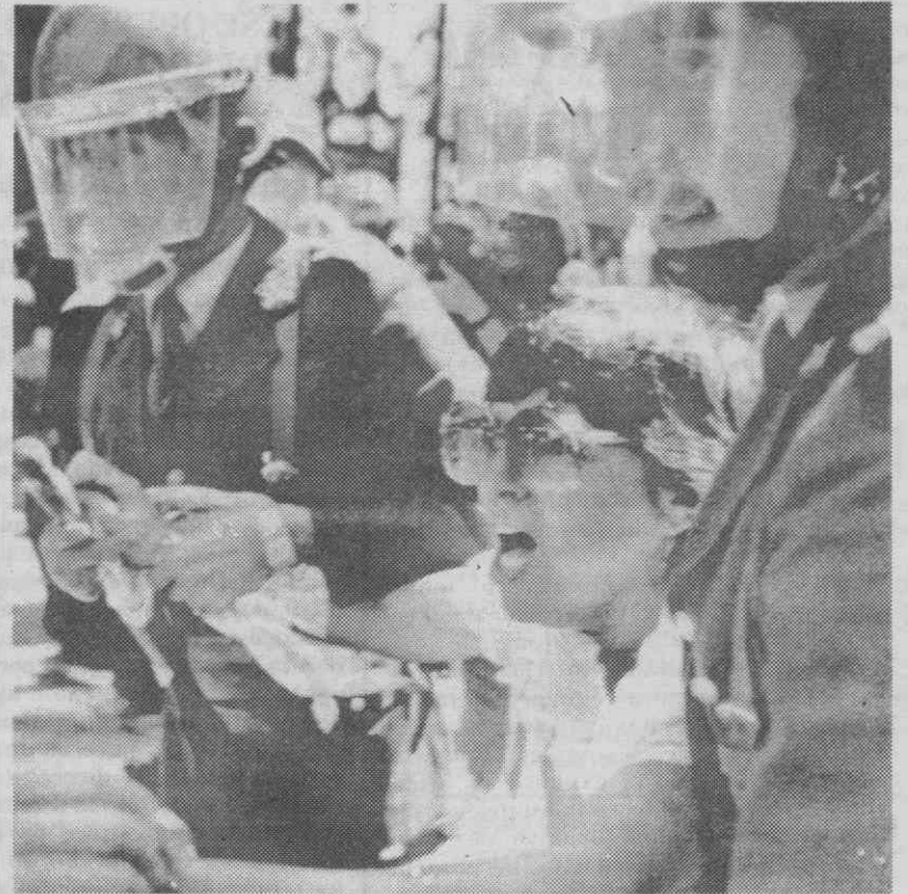
SANTIAGO DO CHILE — Mulheres chilenas são impedidas pela polícia de se manifestarem, contra a visita do Papa João Paulo II ao Chile, na próxima semana.