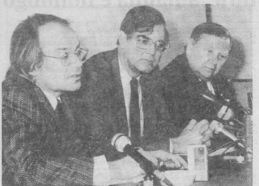
VIENA — O psiquiatra norte-americano F. Weinberger, fala durante uma conferência de imprensa, sobre os métodos de tortura na URSS.

Nesta Assembleia será ainda apresentado o Relatório e Contas referente ao biênio 85/87, e serão tratados outros assuntos de interesse para a colectividade.