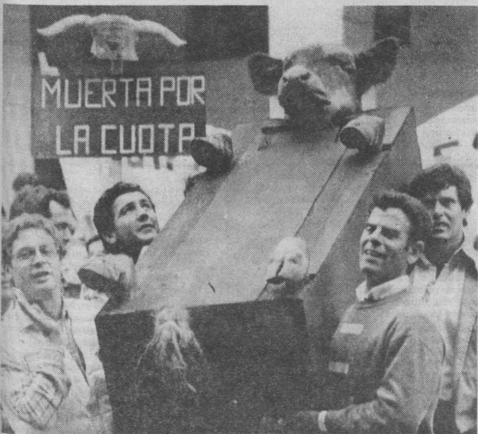
SEVILHA — Agricultores espanhóis carregam um caixão com uma vaca, pelas ruas de Sevilha, em protesto contra as quotas impostas pela CEE.