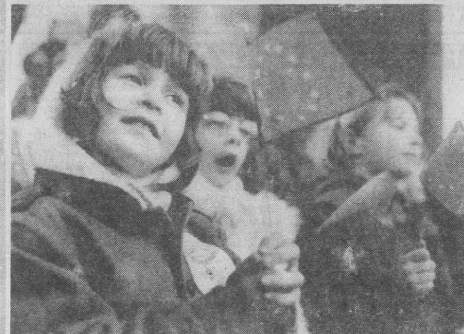
PARIS — Crianças acenam com bandeiras da CEE, durante as comemorações do 30.º aniversário do acordo de Roma.

Os especialistas reunidos no México concordaram que devido aos gastos em armamentos e aos efeitos da crise económica mundial, muitos Governos não atribuem recursos suficientes para atender as necessidades sanitárias e médicas dos seus cidadãos.