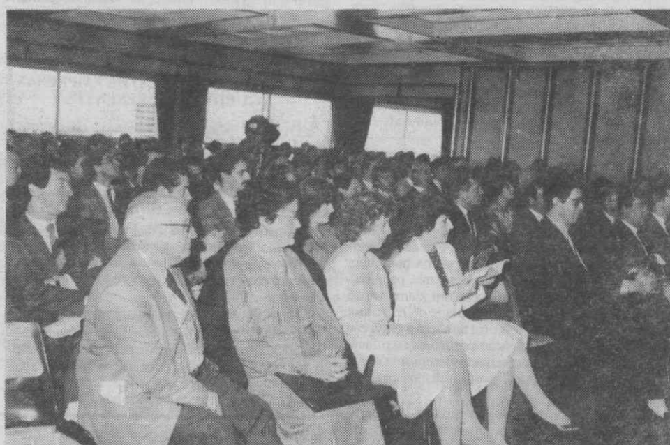
Um aspecto da assistência à sessão.

Promovido pela AIDA, realizou-se ontem uma sessão sobre "Os fundos comunitários de apoio à actividade empresarial", que registou a participação de centenas de empresários da região de Aveiro.