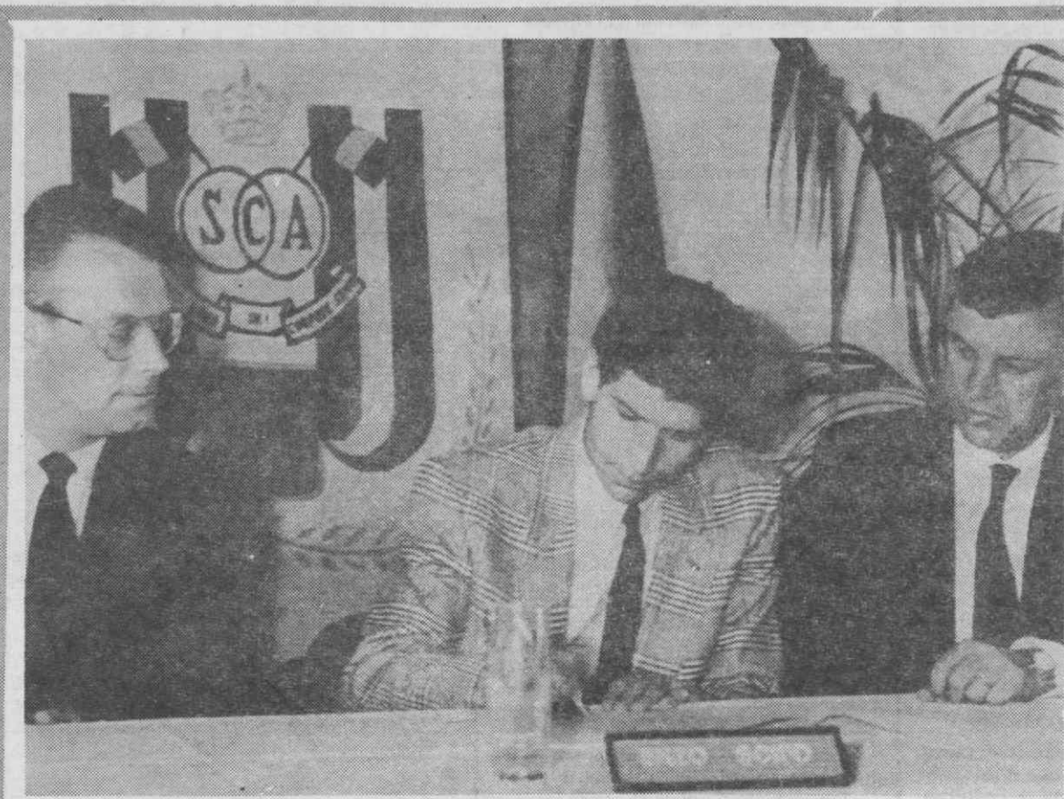
Enzo Scifo, o italo-belga ao serviço do Anderlecht, no momento em que assinava o contrato com o Inter de Milão, no valor de 4,5 biliões de liras.

«Aliás, a mentalidade no atletismo, a nível mundial, está a mudar e, embora não acredite que se vá profissionalizar, como aconteceu no ténis, irá dar mais possibilidades aos praticantes da alta competição».