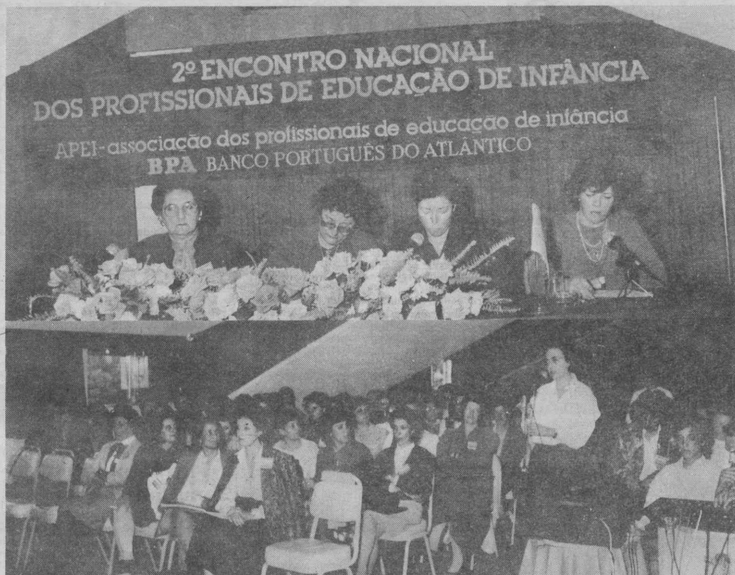
Durante três dias os problemas dos profissionais de educação de infância foram discutidos em Aveiro.

— recomendaram os educadores de infância durante o Encontro Nacional