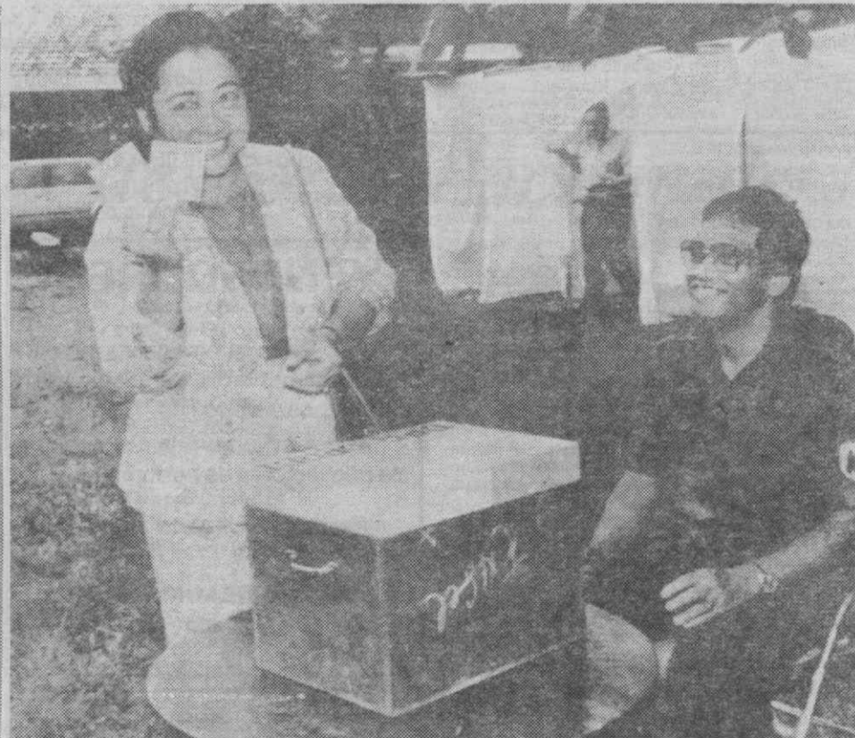
JAKARTA — Megawati Sukarnoputri, filha do antigo Presidente Sukarno, vota para as eleições gerais.

Aparentemente, o «Hengist» descrevia uma curva de 180 graus a caminho do molhe do porto quando foi abalroado, na popa, pelo arrastão.