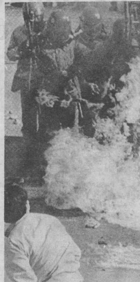
SEUL — Estudantes atiram «coktails molotov» contra polícias de choque.

O director-geral do Património referiu que é necessário «conhecer e conhecer bem» todo o Património do Estado, para que seja possível a sua boa administração.