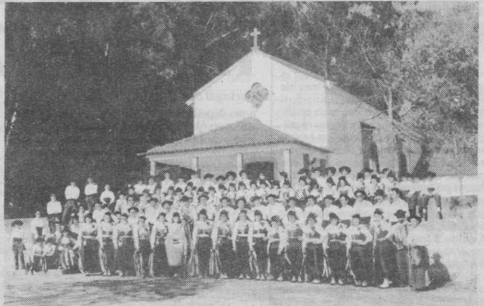
O Rancho Regional «Os Esticadinhos» de Cantanhede — Adultos e Infantis — posando para a época folclórica de 1987.

Por sugestão do autor destas linhas, o Município da vila vizinha e amiga de Vagos deliberou dar o nome de uma sua artéria urbana de: «Rua de Cantanhede». Entretanto a Câmara Municipal de Cantanhede, em reciprocidade, pois foi nesta base que assentou a referida iniciativa, vai oficializar a conhecida Rua dos Lameiros que sai do