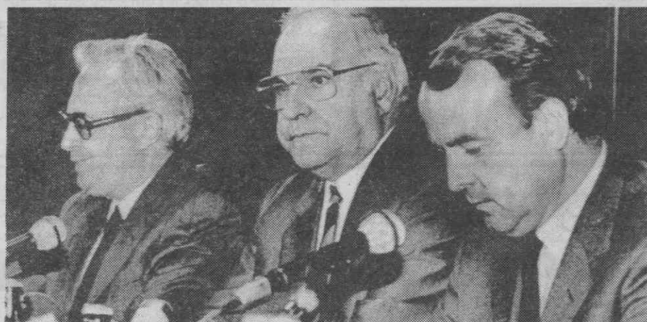
BONA — O chanceler Helmuth Kohl e os dois candidatos da CDU em Hamburgo e Reno-Palatinado, com ar sombrio, durante conferência de imprensa depois das eleições.