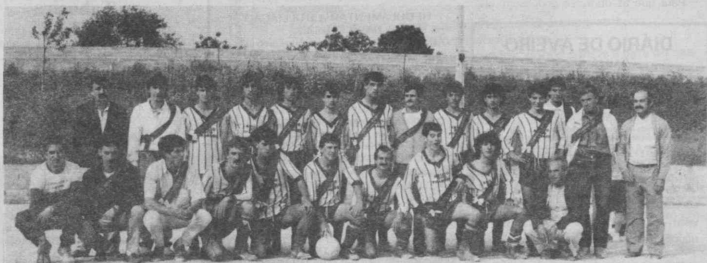
O plantel do Bom Sucesso, já com a faixa de campeões distritais da III Divisão, vendo-se também o presidente da Direcção, seccionistas e técnicos.