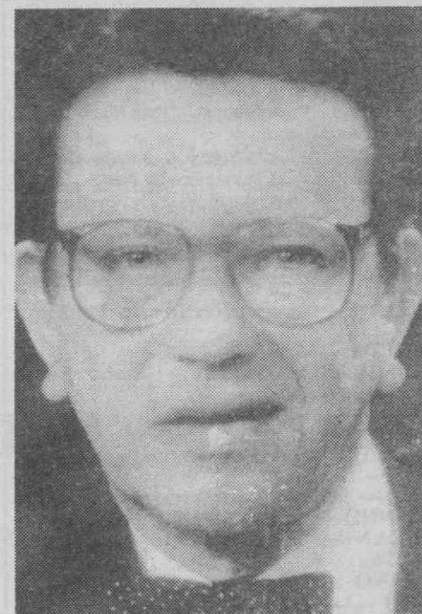
CARBONDALLE (Illinois) — Grande plano do senador Paul Simon que anunciou a sua candidatura à Presidência pelo Partido Democrático.

«Tudo isto não é senão, e finalmente, o resultado do encontro do jornalismo brasileiro com os seus deveres cívicos», afirma o autor da notícia, Jânio de Freitas.