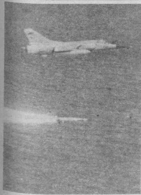
PARIS — Foto de arquivo de um caça-bombardeiro «Mirage» a disparar um míssil «Exocet» igual ao que atingiu a fragata norte-americana no Golfo.