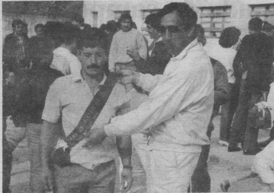
Um seccionista impõe a faixa ao roupeiro do clube.