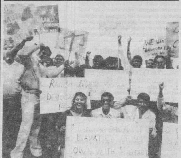
SIDNEY — Manifestação contra o golpe de Estado nas Ilhas Fiji.

Segundo a nota da Guarda Fiscal, trata-se «da maior apreensão de haxixe de que se tem conhecimento em Portugal».