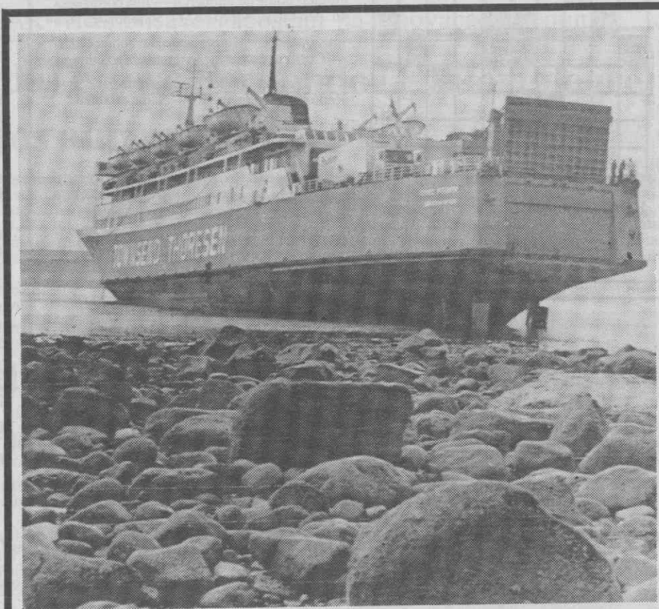
VENEZA — O «ferry-boat» «Ionic» da Townsend Thoresen protagonista do acidente na Irlanda do Norte, em que, felizmente, não houve vítimas a lamentar.

O jornal conservador «Le Figaro» notou que Mitterrand deveria estar a divertir-se com o «espectáculo» da luta entre os seus opositores.