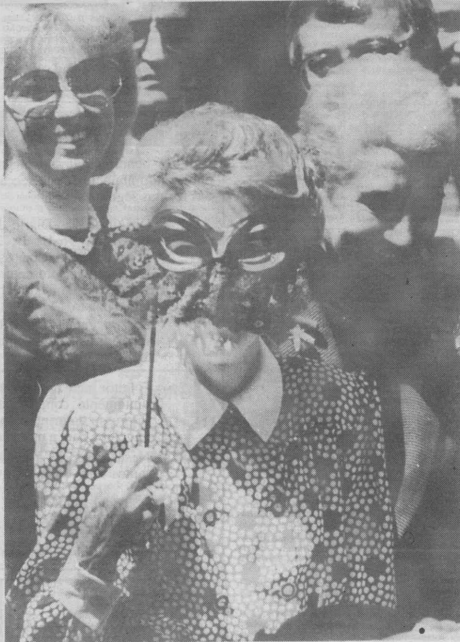
VENEZA — Nancy Reagan usando uma máscara tradicional de Veneza.

«Porque nos mantivemos fortes, temos hoje ao alcance a possibilidade não só de limitar o crescimento de armas mas da eliminação, pela