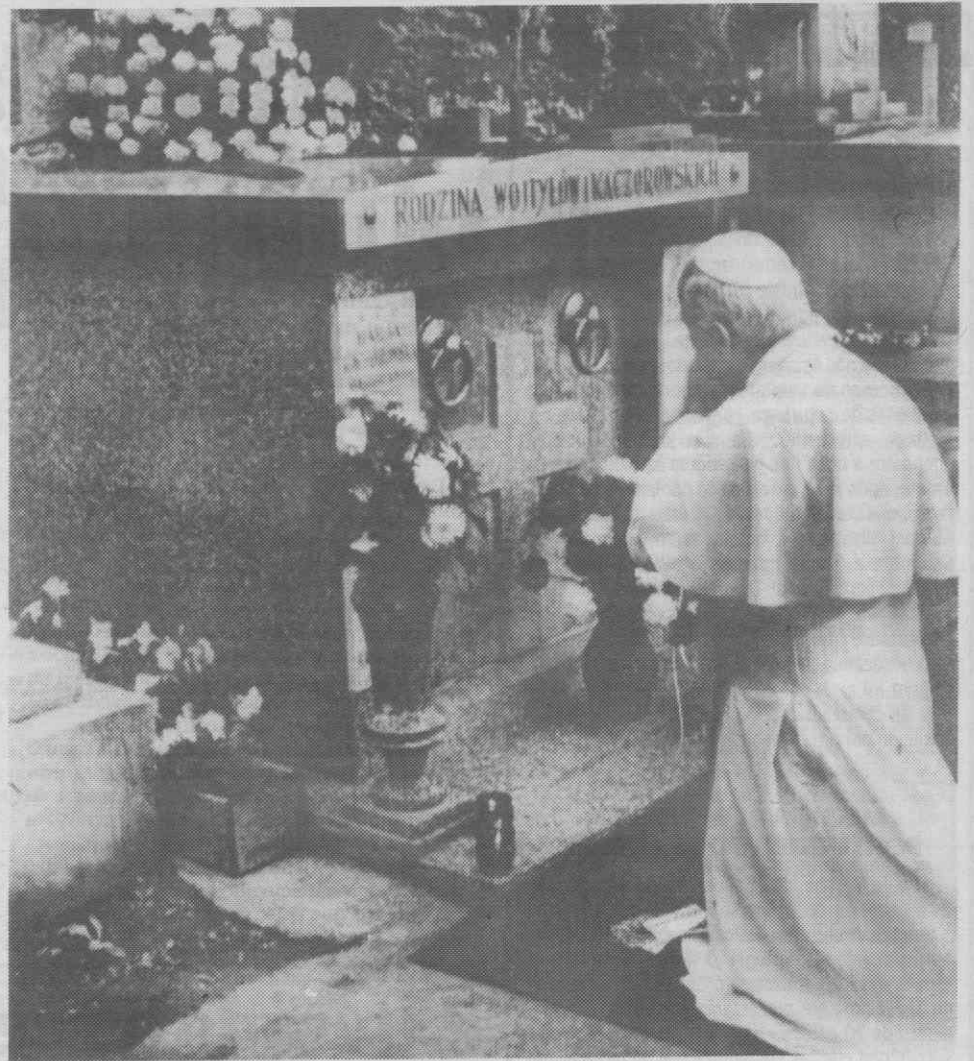
SZCZECIN, POLÓNIA — O Papa João Paulo II ora junto da campa dos pais em Cracóvia.

A polícia polaca deteve ontem o chefe de um grupo pacifista não-oficial, Jacek Czuputowicz, um dia depois de ele escrever uma carta ao Papa criticando as autoridades comunistas por perse-