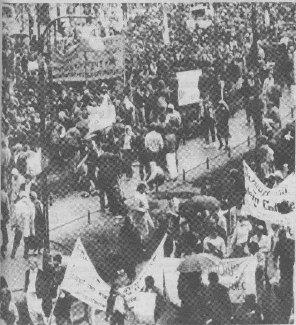
BERLIM OCIDENTAL — Aspecto da manifestação contra a visita do Presidente Reagan.