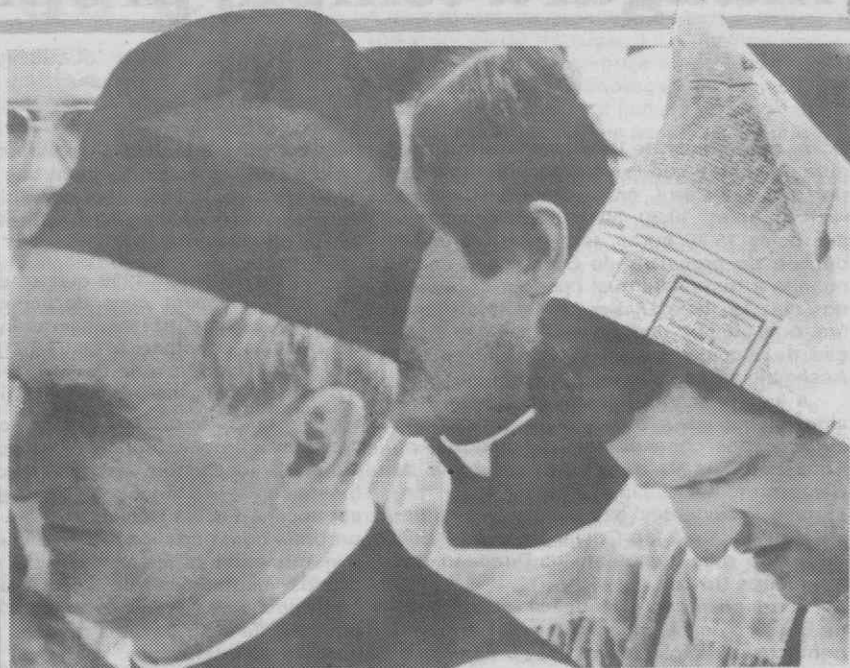
SZCZECIN, POLÓNIA — Um jovem padre usa um chapéu feito de jornais para se proteger do sol.

Os clubes queixavam-se de que, a não ser nos jogos entre os seis clubes que disputavam o grupo principal, os espectadores escasseavam e as partidas significavam perda de dinheiro.