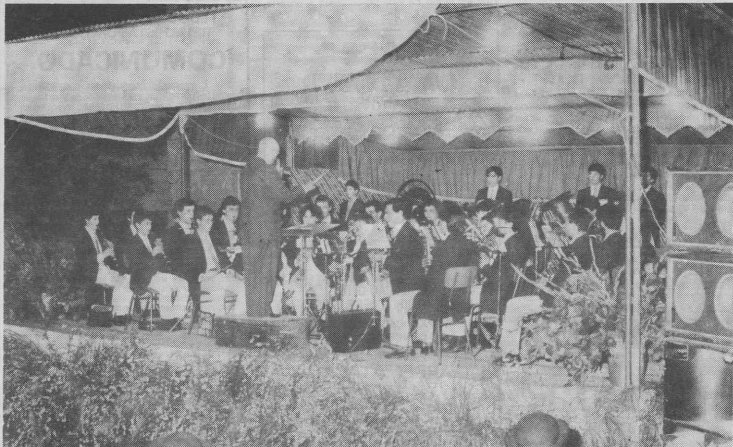
A Orquestra Juvenil de Travassô durante a sua actuação.

O Bairro da Venda Nova continua a ser animado pelas festividades em honra de S. Sebastião. Na passada quinta-feira, já com a colaboração do bom tempo que se fez sentir, ao contrario do primeiro dia festivo, realizou-se a Noite Infantil, cujo programa foi preenchido pelas actuações da Banda Juvenil de Travassô e dos grupos «Os Fidalgos da Trofa» e «Cancioneiro Infantil». A Praça do Municipio, nessa noite, apresentava já uma moldura humana condizente com as tradições dos festejos em honra de S. Sebastião.