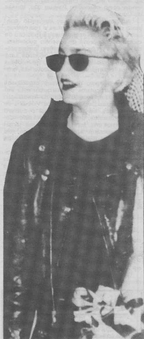
OSAKA (JAPÃO) — A super-vedeta Madonna à sua chegada ao aeroporto internacional de Osaka, — para uma «tournée» pelo Japão, — onde era aguardada por uma imensa multidão de fãs.

Telefoto Reuter/Lusa — «Diário de Aveiro» LER NA PAGINA 5