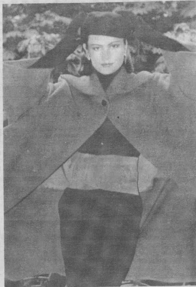
PARIS — Moda — Modelo da colecção Outono -Inverno do conhecido costureiro Christian Dior.

Telefoto Reuter/Lusa — «Diário de Aveiro»