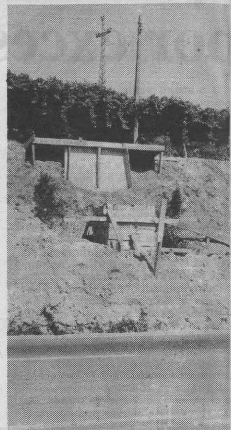
Uma das sapatas da passagem aérea sobre a EN-1, no Brejo.

Os enormes riscos que a travessia, a pé, da Estrada Nacional 1 implica, (local próprio para a circulação com grande velocidade, com três faixas de rodagem), vão, a breve trecho deixar de existir. De facto, já se iniciaram os trabalhos de construção de uma passagem aérea sobre a referida rodovia naquele local, estando já concluídas as sapatas de suporte da estrutura metálica.