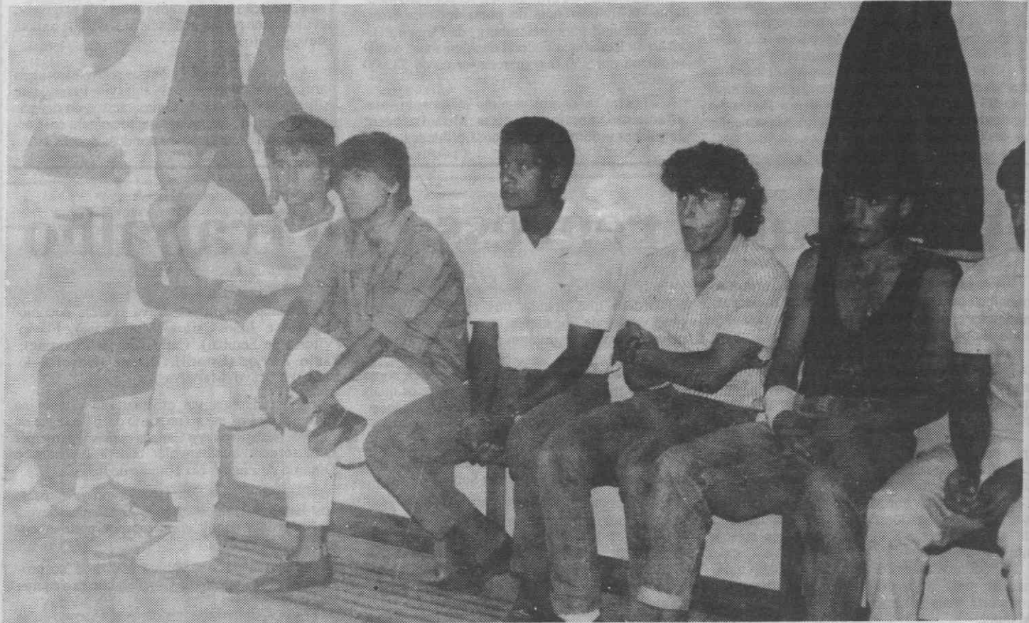
Alguns dos jogadores do Beira Mar, muito atentos às palavras do «timoneiro». Erros da época passada não se podem repetir.