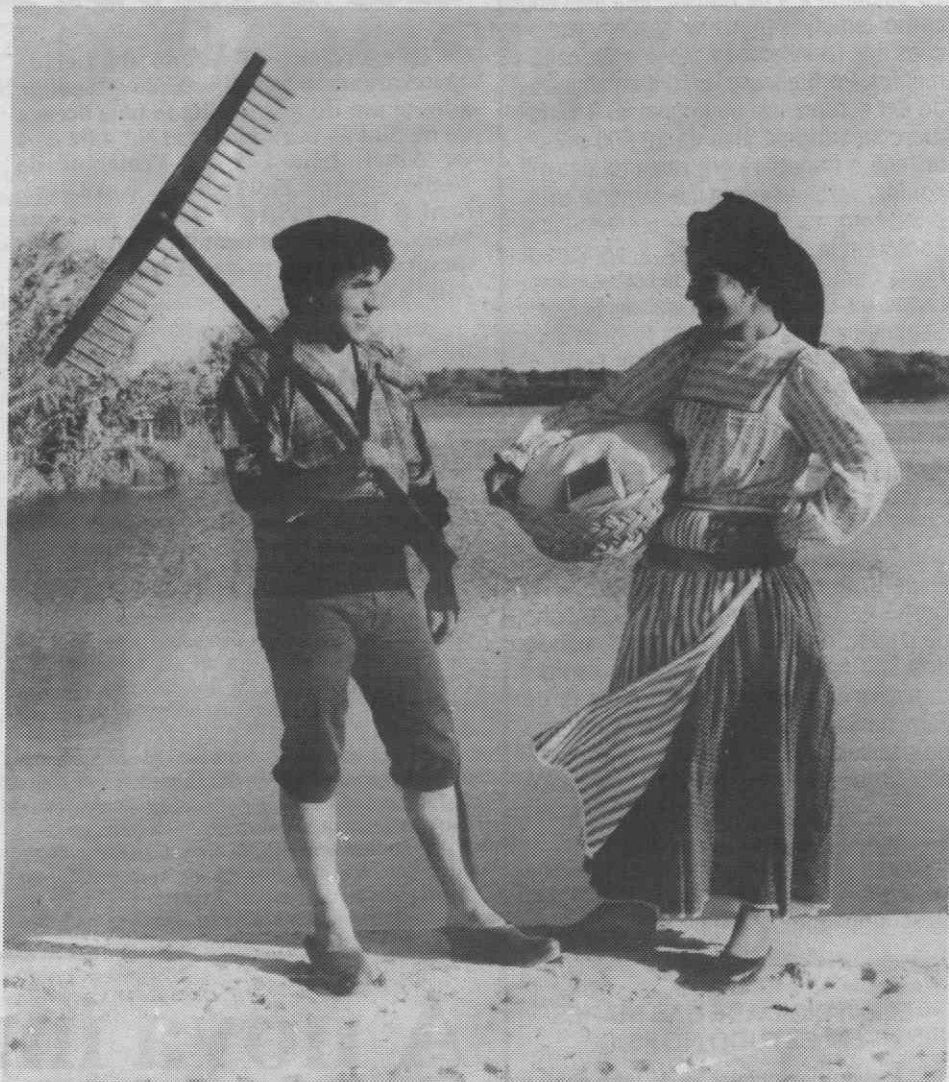
Um gentil par do Grupo Folclórico «Os Leais do Corticeiro» — Corticeiro de Cima (Cantanhede), tendo como «cenário» de fundo as águas da Barrinha da Praia de Mira. Ele, envergando a indumentária de moliceiro — das bandas ribeirinhas — e ela, trajando de tremoceira — tipicamente da região gandareza — onde se implanta o referido conjunto etnográfico.

Entretanto, «Os Leais»... com suas danças piramidais, continuam a fazer recolhas para enriquecer a sua linda etnografia e o seu património de danças e cantares.