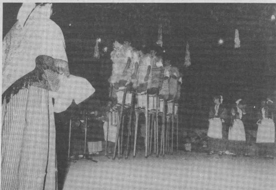
O grupo francês durante a sua actuação.

litada pelo facto da Embaixada de Portugal em Paris não ter cedido os vistos necessários.