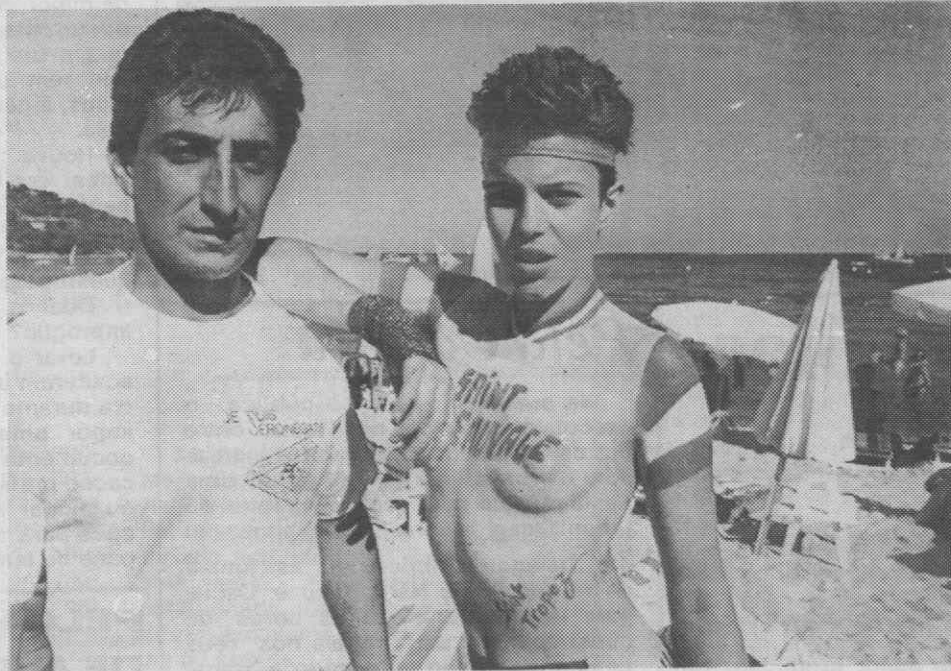
ST. TROPEZ — Um pintor local posando com a sua modelo em cujo corpo desenhou uma «T-shirt», em plena praia de Taboo.