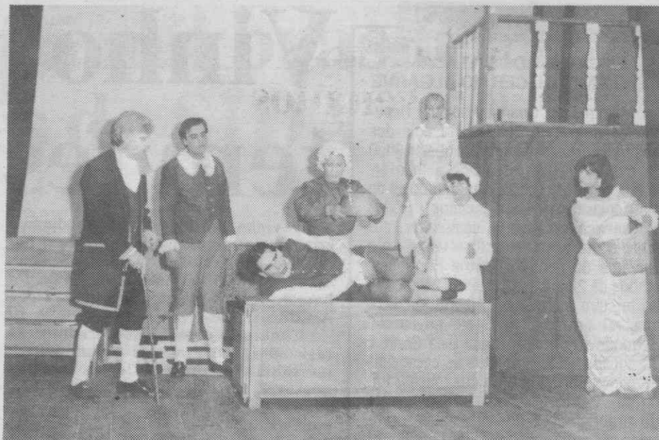
Representação teatral do CITEC no CITEMOR 86.

22h0 — Espectáculo de Teatro «O Soldado Fanfarrão», de Plauto, pelo Grupo de Teatro Amador de Taveiro.