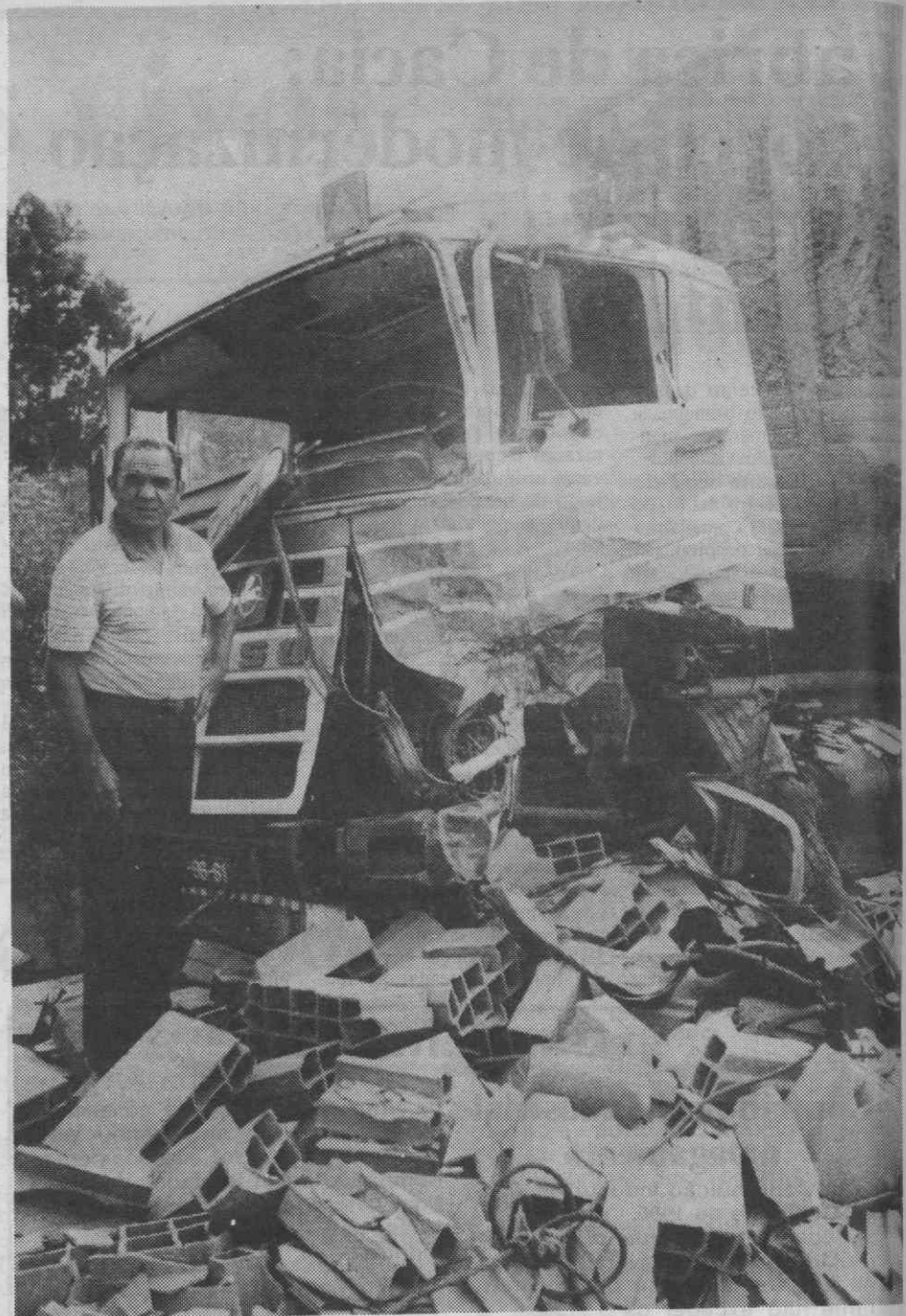
O pesado de mercadorias ficou também bastante danificado.

A GNR de Águeda tomou conta da ocorrência.