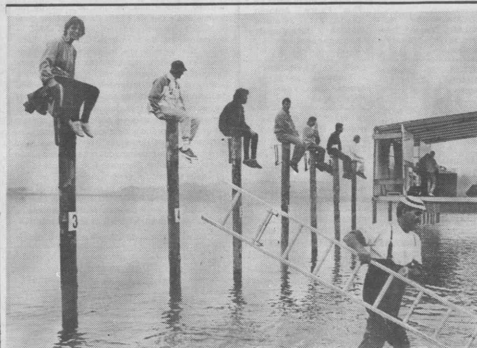
HOLANDA — Dezoito participantes tentam bater o recorde mundial de estarem sentados no cimo de um pau. O anterior recorde está em 104 horas. Telefone epa/Lusa — «Diário de Aveiro»

Moçambique tem cerca de 13 milhões de habitantes.