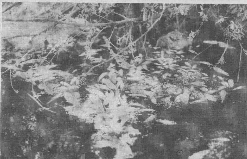
Mais um crime a ficar impune?

Até quando vão continuar a ficar impunes actos criminosos deste tipo? Será que as entidades competentes só estão preocupadas com aqueles que, com meios de pesca rudimentares, levam para os seus lares meia dúzia de peixes, «esquecendo-se» daqueles que, com a descarga de efluentes altamente tóxicos, matam milhares?