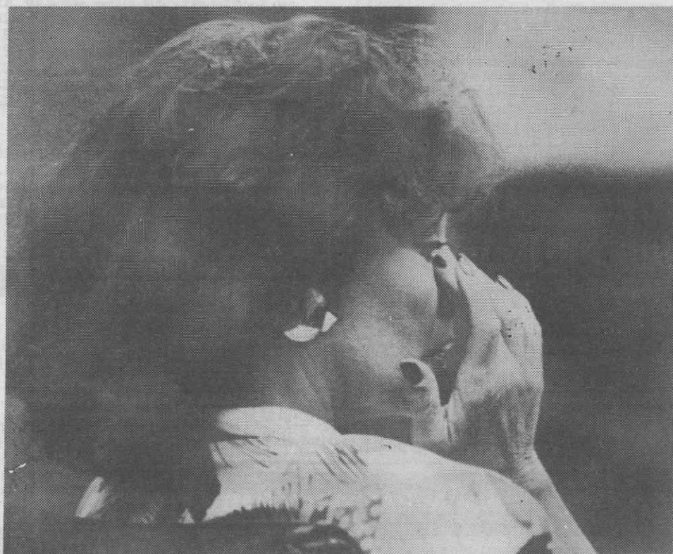
LOS ANGELES — Grande plano da famosa actriz Joan Collins limpando uma lágrima da face, durante o julgamento do seu processo de divórcio.

As autoridades mostram-se convencidas de que para já poderão diminuir o índice de atrasamento de certas doenças, pelo menos até que estejam na posse de dados e meios que lhes possibilitem um combate eficaz ao problema.