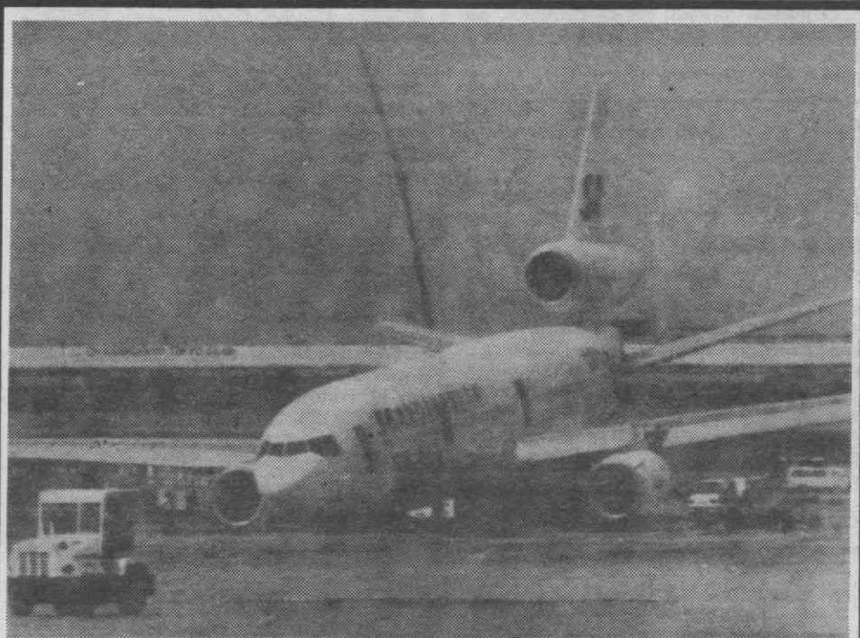
BANGUECOQUE — Aspecto dum avião das Linhas Aéreas Escandinavas com a sua parte da frente no chão, em plena pista do Aeroporto Internacional, após ter tido problemas na decolagem. Todos os seus 151 passageiros foram evacuados em segurança.

A época balnear termina em 30 de Setembro.