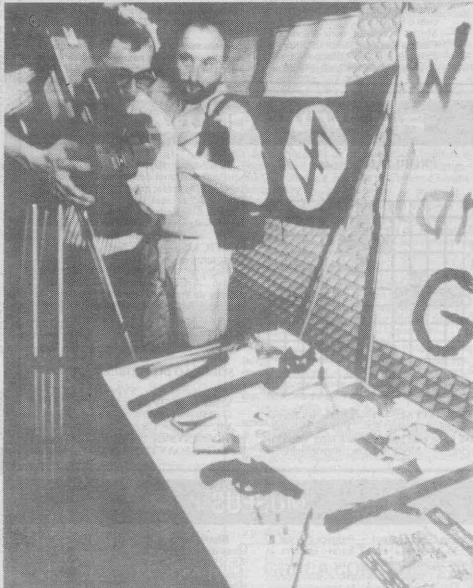
WUNSIEDIEL (RFA) — Aspecto de alguns dos artigos, incluindo bandeiras nazis e fotografias de Hitler, apreendidas pela policia a grupos extremistas neo-nazis.

O antigo senador norte-americano Gary Hart teve também que renunciar à candidatura presidencial democrata devido à publicação de uma notícia no «Miami Herald» que o acusava de ter passado um fim-de-semana com o modelo Donna Rice na sua casa em Washington, aproveitando a ausência da mulher.