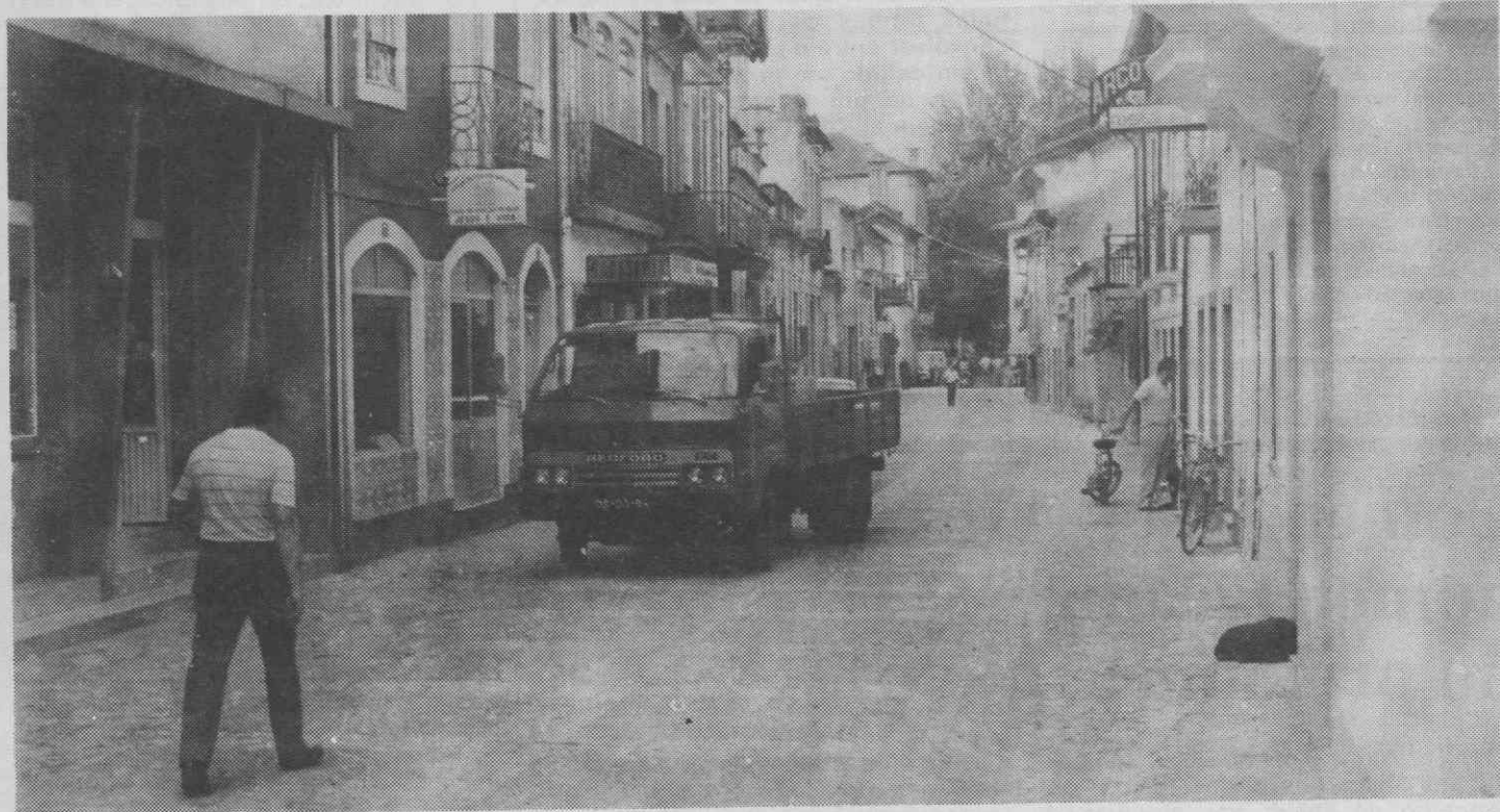
Um aspecto da Rua Vasco da Gama