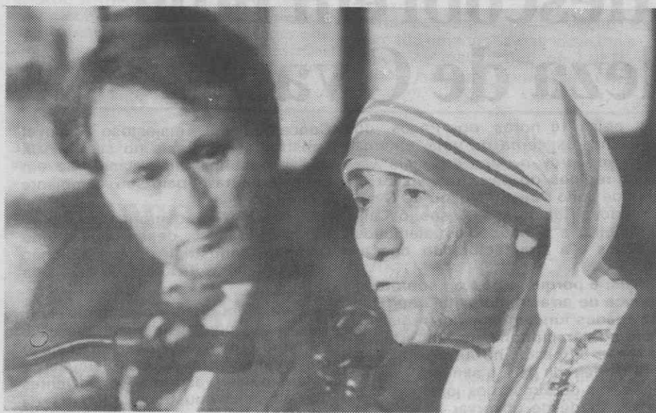
MOSCOVO — A Madre Teresa de Calcutá falando na Comissão Soviética para a Paz, onde foi distinguida com uma condecoração pela sua ajuda aos pobres da Índia.