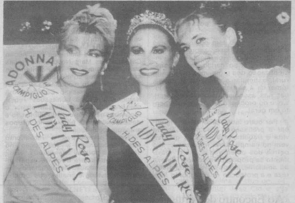
CAMPINGLIO — As três primeiras classificadas de um concurso para «Miss Universo 87», ocorrido em Madonna di Campiglio.