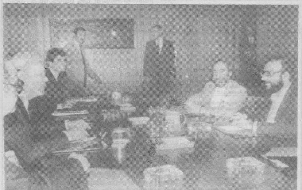
NAÇÕES UNIDAS — Encontro entre o ministro dos Negócios Estrangeiros iraniano, o embaixador do mesmo país nas Nações Unidas e o secretário-geral das Nações Unidas, para falarem da situação da guerra Irão-Iraque.

«Esta prática — salienta a nota — é intensamente lesiva dos recursos de pesca e condenada pelas leis nacionais e internacionais».