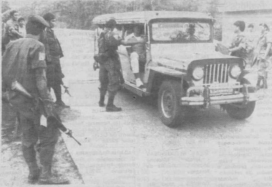
PAMPANGA (Filipinas) — Soldados governamentais, fortemente armados, mandam parar um veículo nas imediações da base para onde fugiram soldados rebeldes.

De acordo com outro rumor, a Embaixada norte-americana ofereceu-se para levar a Presidente Aquino para o seu complexo de Baysound durante a fase de maior intensidade dos combates. Na quarta-feira, Corazon Aquino disse através da televisão ter recusado o conselho