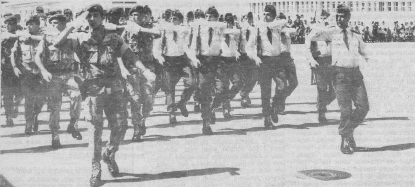
Um aspecto do desfile militar de pára-quedistas, especialistas da Força Aérea.