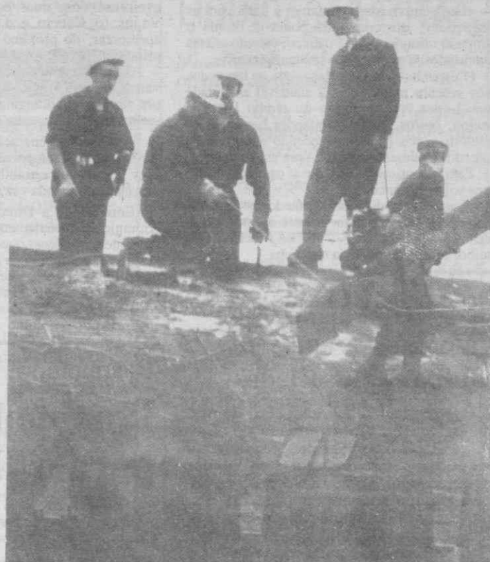
ILHA DE PHUKETE (Tailândia) — Recolha da caixa preta do «Boeing» que se despenhou morrendo os oitenta e três passageiros.