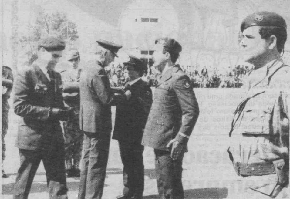
A imposição de condecorações pelo general Costa Gomes.