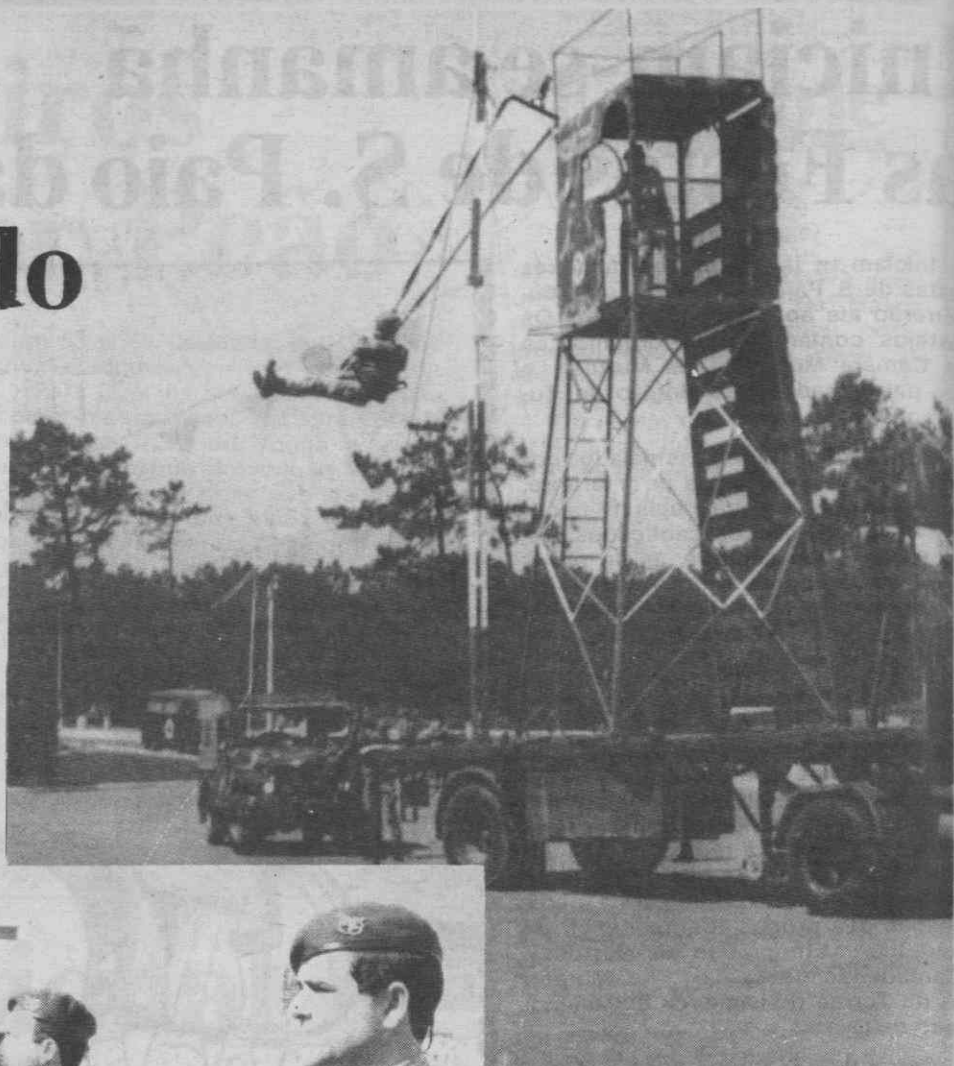
Uma demonstração de saltos por pára-quedistas.

Um dos momentos altos do programa, foi atingido quando o GOAS (Grupo Operacional de Apoio e Serviços) procedeu a uma demonstração das suas capacidades técnicas e táticas na parada da Base, mas, se essa demonstração causou alguma sensação, o entusiasmo cresceu quando se procedeu à exemplificação de manobras e exercícios militares, envolvendo saltos em pára-quedas e de helicóptero, descarga de material aerotransportado em pleno voo, e outros exercícios que, fazem parte do dia-a-dia dos militares, mas que constituem sempre momentos agradáveis de ver, pela perícia e destreza demonstrada pelos seus executantes.