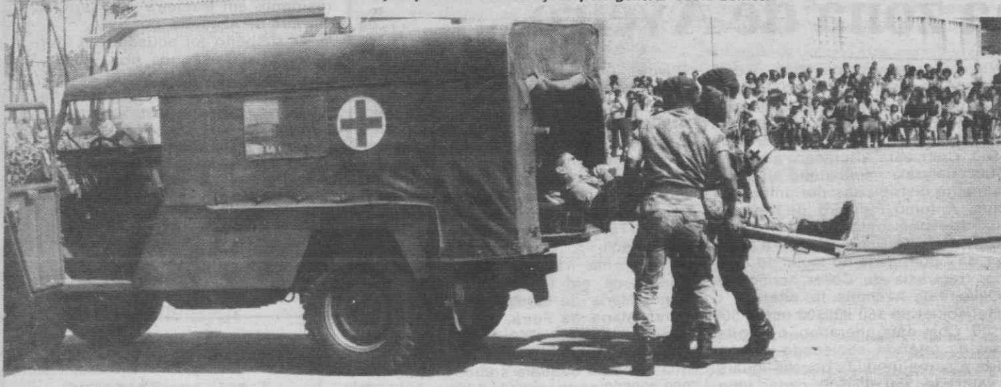
Uma demonstração de socorrismo por elementos do GOAS.