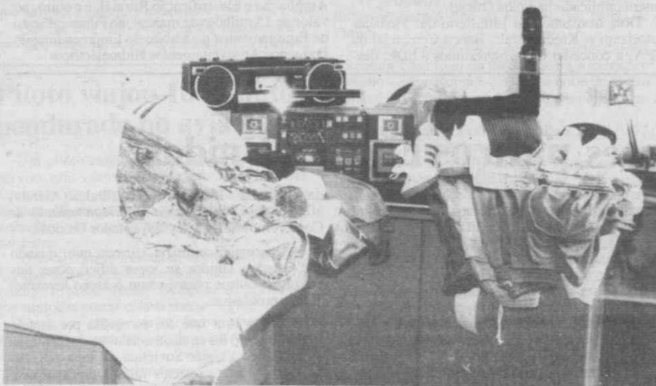
A foto mostra alguns dos objectos furtados e recuperados pela PSP de Aveiro.

Os capturados vão ser presentes ao Tribunal de Instrução Criminal da Comarca de Aveiro.