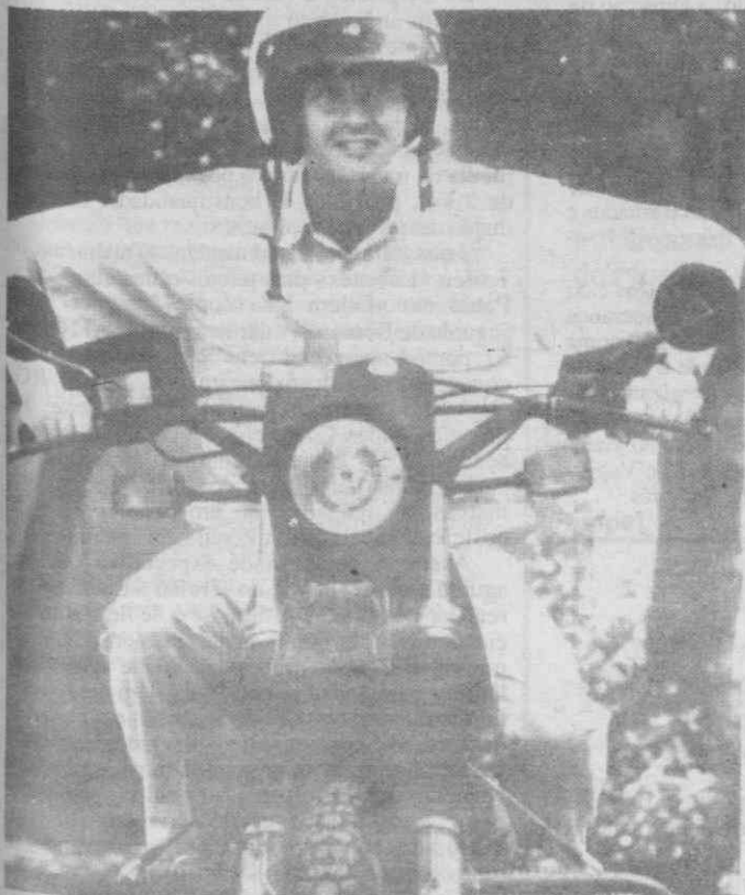
ROMA — O corredor britânico, Steve Cram, vestido de polícia, no dia do descanso dos Campeonatos Mundiais de Atletismo.

O reembolso é feito em 24 semestralidades e a taxa de juro é flutuante, fixada semestralmente pelo BIRD.