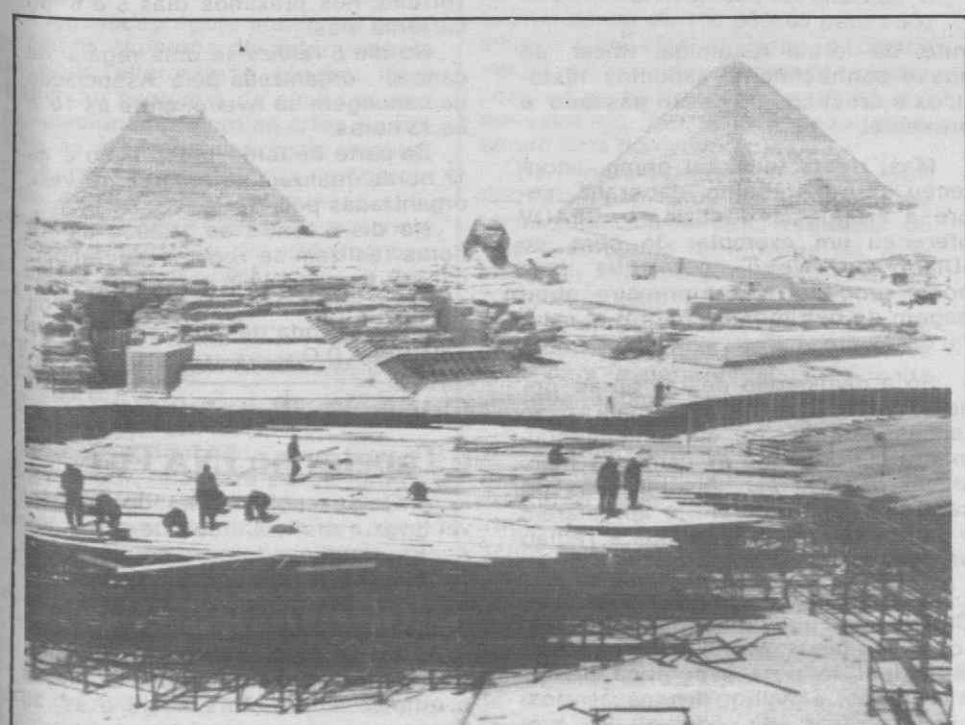
GIZÉ (EGIPTO) — Sob o olhar impenetrável da Esfinge e tendo como fundo 2 das gigantescas pirâmides, começaram em Gizé os preparativos da construção do palco para uma próxima representação da «Aida», de Verdi.

Nos cerca de 66 por cento de fumadores maiores de 18 anos, as mulheres encontram-se em maioria.