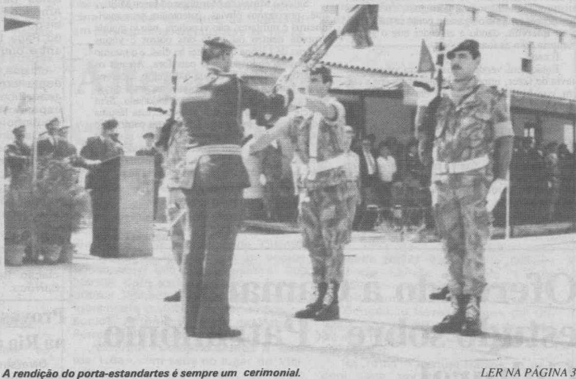
A rendição do porta-estandartes é sempre um cerimonial.