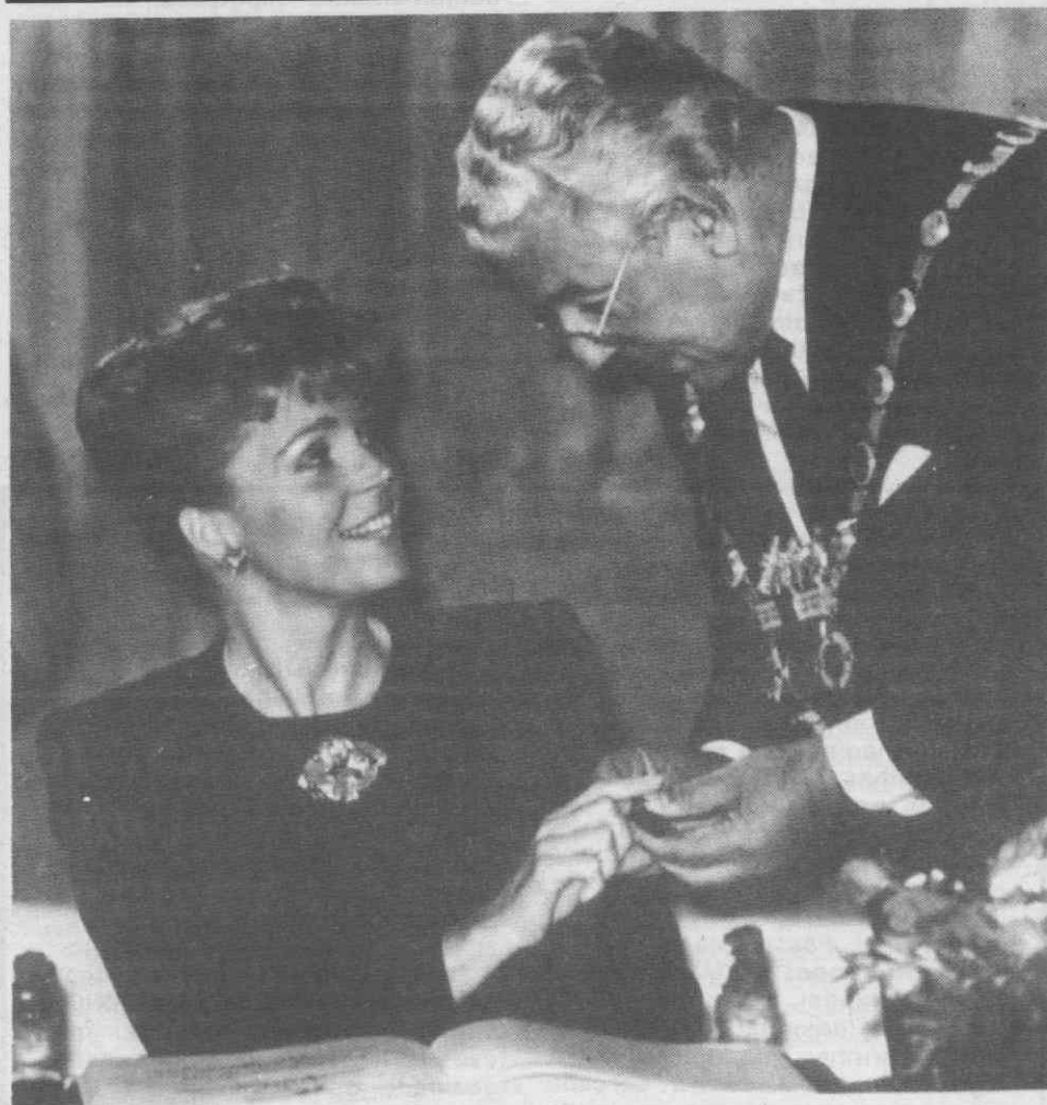
COLÓNIA — A rainha jordana, Noor, assina no livro de ouro da cidade de Colónia, em recente visita que fez à Alemanha Federal.

Em menos de meia hora os «soldados da paz» dominaram o sinistro, de causas desconhecidas, não havendo danos pessoais a registar. Os danos materiais foram no entanto vultados, tendo sido destruído os afos e a pintura.