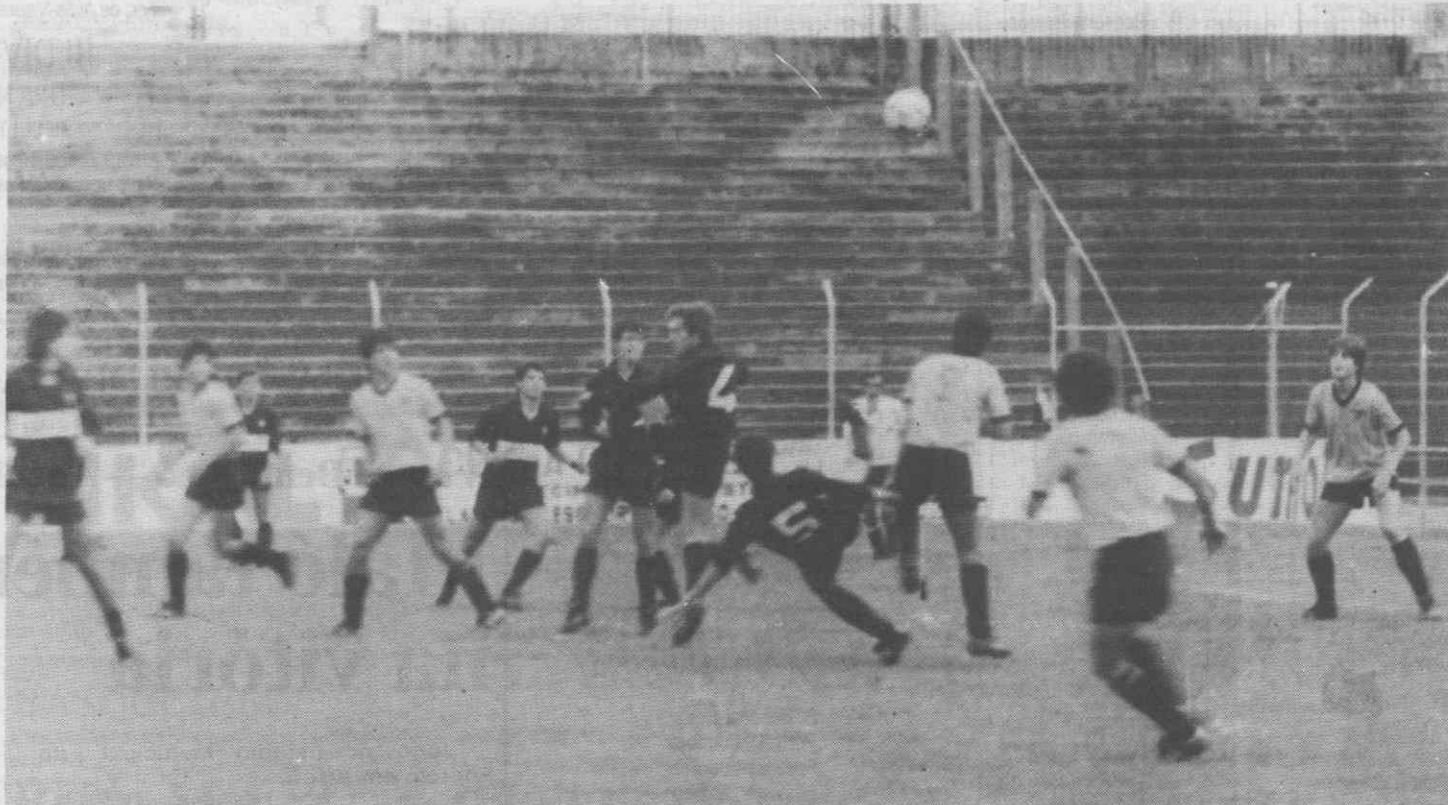
Muito confuso o futebol desenvolvido no encontro.