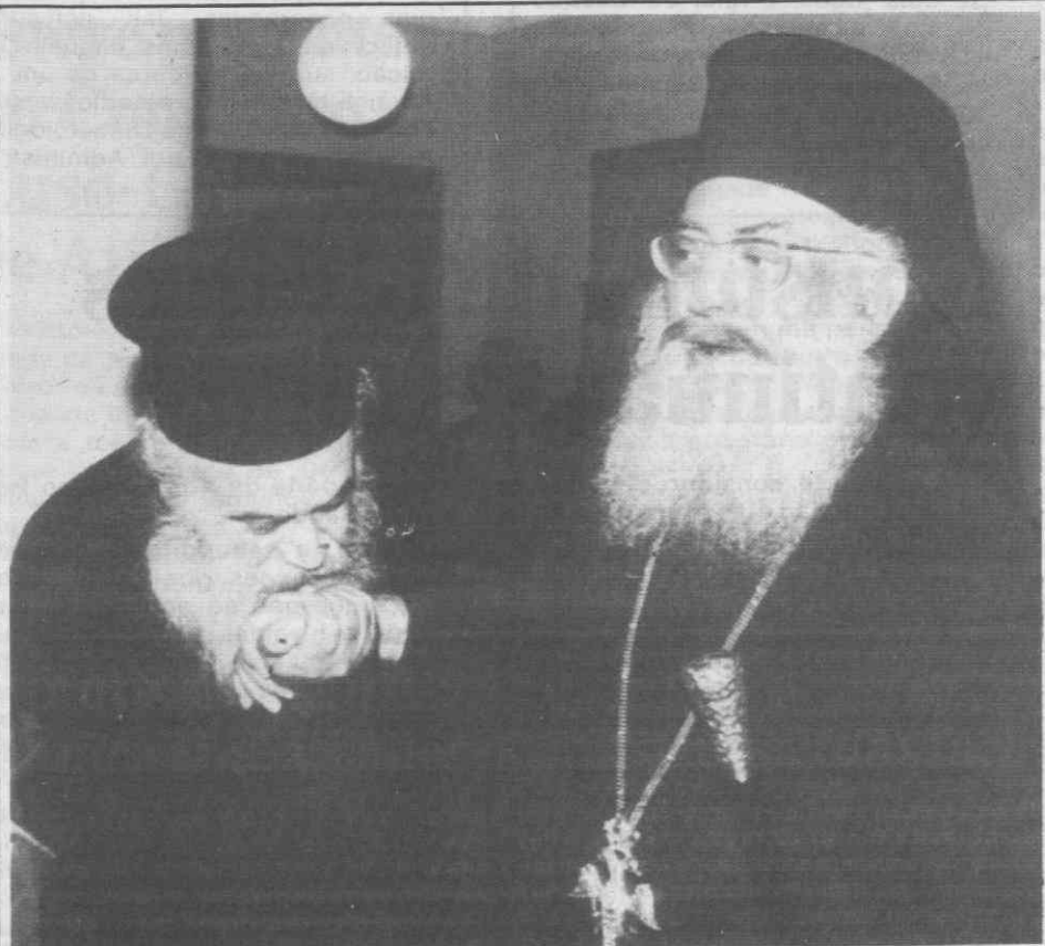
ATENAS — O arcebispo Seraphim saindo do Encontro da Igreja Grega que teve como objectivo a discussão da Lei de Propriedade da Igreja que é contestada pelo Primeiro-Ministro grego Andreas Papandreu.

Voltaremos ao contacto com os nossos estimados leitores, na próxima quarta-feira, dia 7.