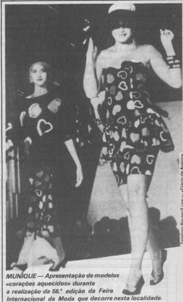
MUNIQUE — Apresentação de modelos «corações aquecidos» durante a realização da 56.ª edição da Feira Internacional da Moda que decorre nesta localidade.