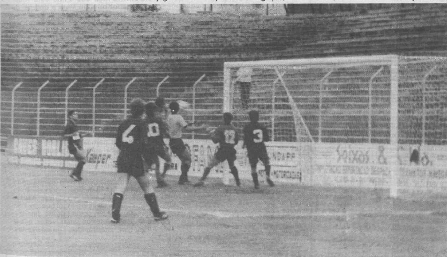
Dois avançados do Beira Mar «perdidos» no meio de 6 adversários.