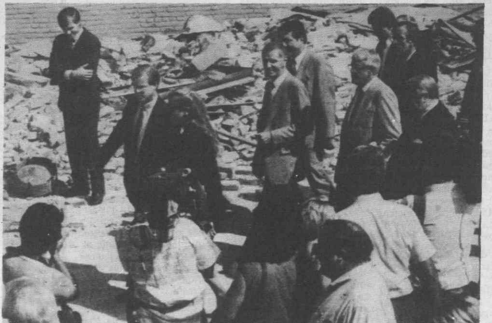
WHITTIER: CALIFÓRNIA — O governador da Califórnia, George Deukmejian, visitando as áreas afectadas pelo terramoto.