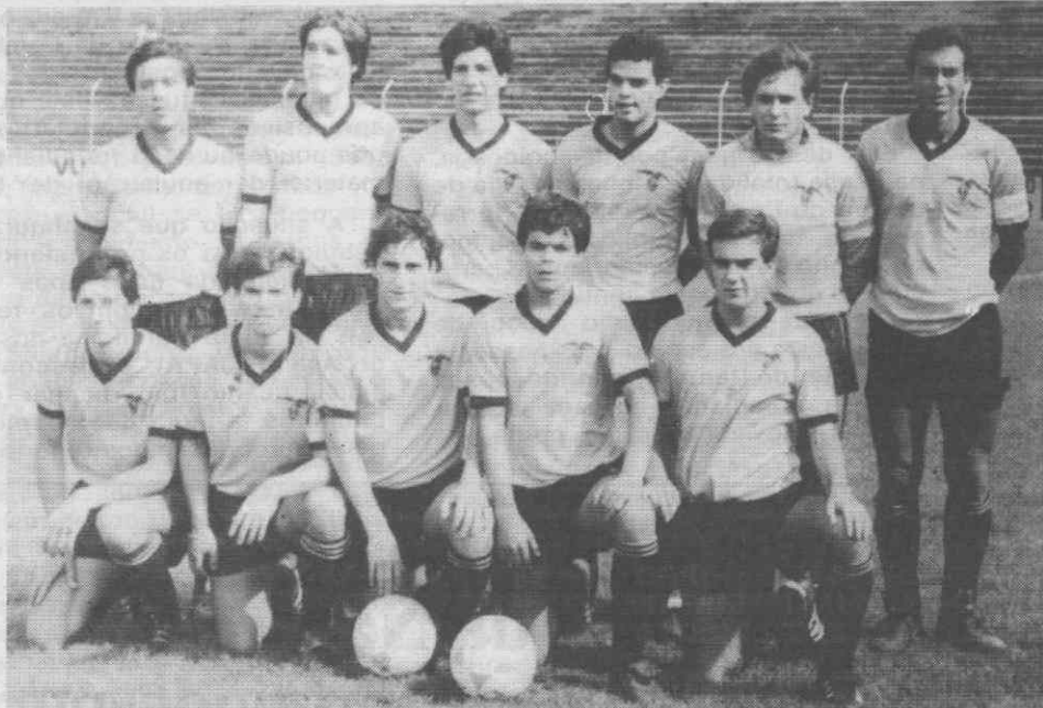
A equipa de juniores do Beira Mar que venceu o Académico de Viseu por 2-0.

Ler mais noticiário nas páginas de Desporto.