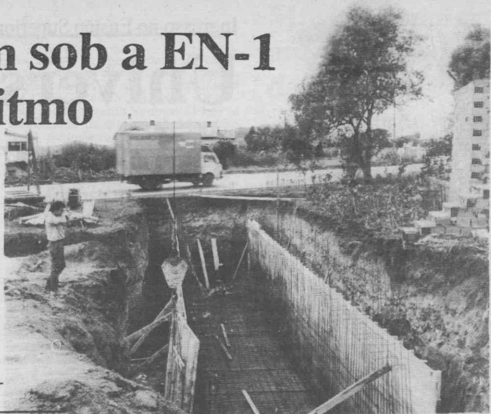
Os trabalhos da passagem subterrânea continuam em bom ritmo.

De louvar a acção da Câmara Municipal de Aguada que, atendendo às solicitações da população de Aguada de Baixo, conseguiu sensibilizar a Junta Autónoma das Estradas para a necessidade do empreendimento.