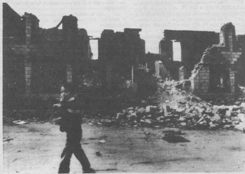
LHASA (Tibete) — Destroços da esquadra da policia de Lhasa, após os confrontos antichineses de 1 de Outubro.

Nos homens idosos, a taxa de analfabetismo vai desde os 24 por cento em Lisboa até um máximo de 68 por cento em Beja.