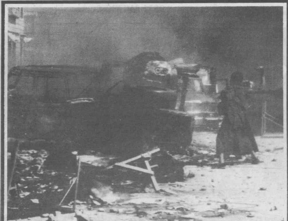
LHASA (Tibete) — Um monge atira uma pedra contra a esquadra da polícia de Lhasa.