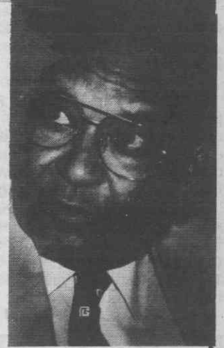
Amadou Mahtar M'Bow (Senegal); actual director-general.

PARIS — Combo dos três candidatos nas eleições para o cargo máximo da UNESCO.