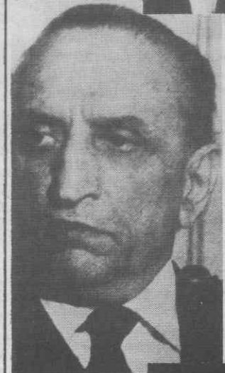
General Sahabzada Yacoub Khan (Paquistão).