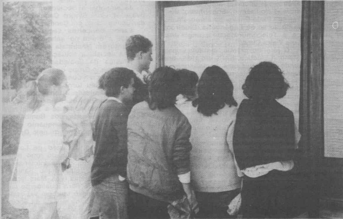
Os candidatos ao Ensino Superior procuram saber da sua admissão.

O olhar das pautas. O sorriso. A insatisfação ou então a alegria. Milhares de alunos do 12.º ano deslocaram-se, terça-feira, às delegações do País do Gabinete Coordenador de Ingresso ao Ensino Superior para saberem os resultados das suas candidaturas à Universidade. De algumas centenas de alunos que se candidataram aos 17 cursos da Universidade de Aveiro, somente 415 tiveram acesso.