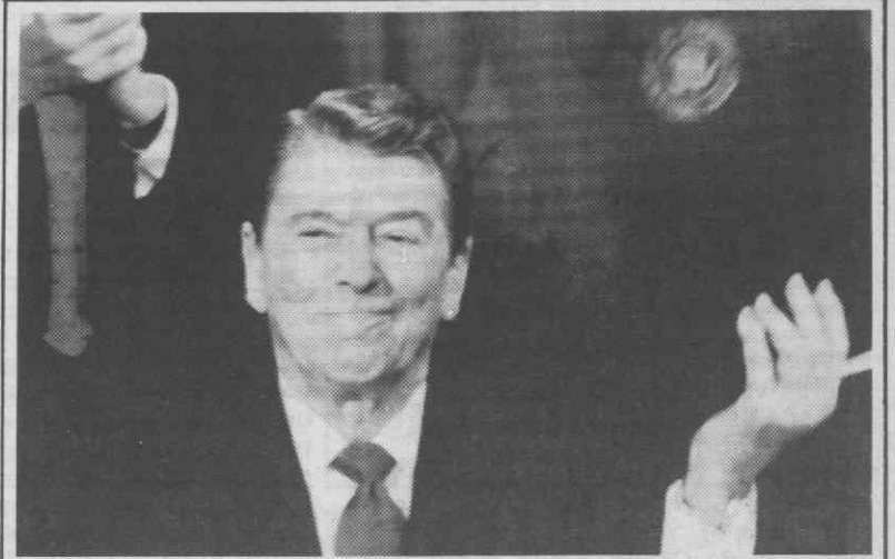
WASHINGTON — O Presidente Reagan exhibe os documentos por si assinados, e constituintes duma proposta legislativa para combater a pornografia e obscenidade infantis.