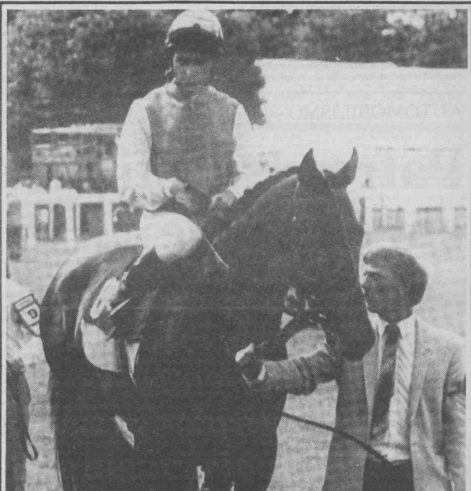
LONDRES — O cavalo «Dancing Brave», campeão europeu das corridas de cavalos em 1986, foi atingido por uma doença misteriosa, o que está a preocupar todo aquele sector desportivo, com a quantidade de consequências sombrias que podem surgir.

Em termos regionais, apenas foi concluído até agora um tratado abrangendo uma zona habitada, o de Tlatelolco, válido para toda a América Latina.