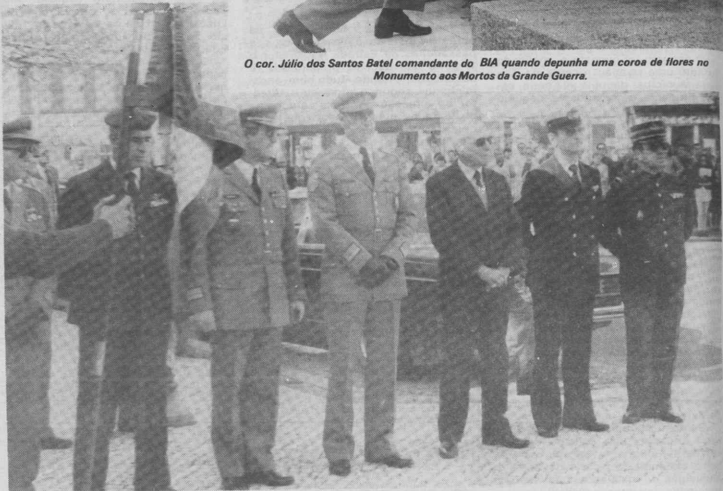
Algumas das entidades militares presentes nas cerimónias.