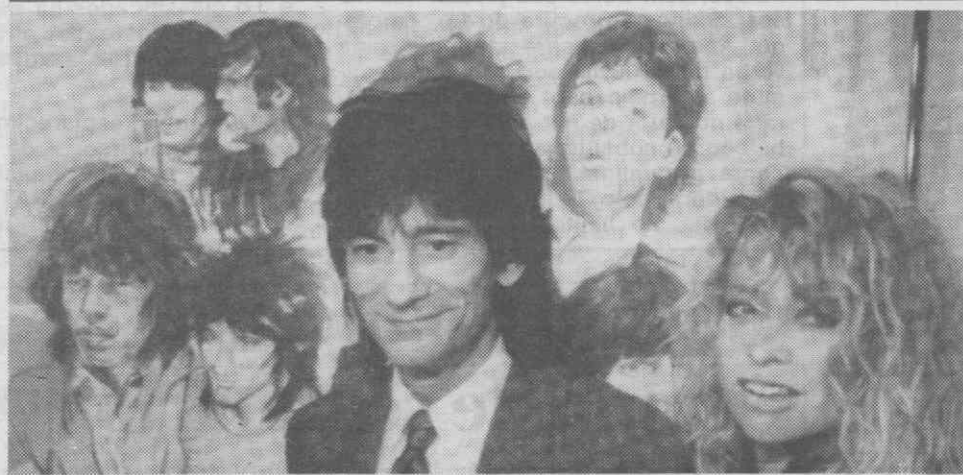
NOVA IORQUE — Ron Wood, músico dos «Rolling Stones», acompanhado por sua mulher, resolveu posar junto do seu quadro-montagem dos «Rolling Stones» e dos «Beatles», durante uma exposição de obras suas na galeria de arte contemporânea da Christie's.