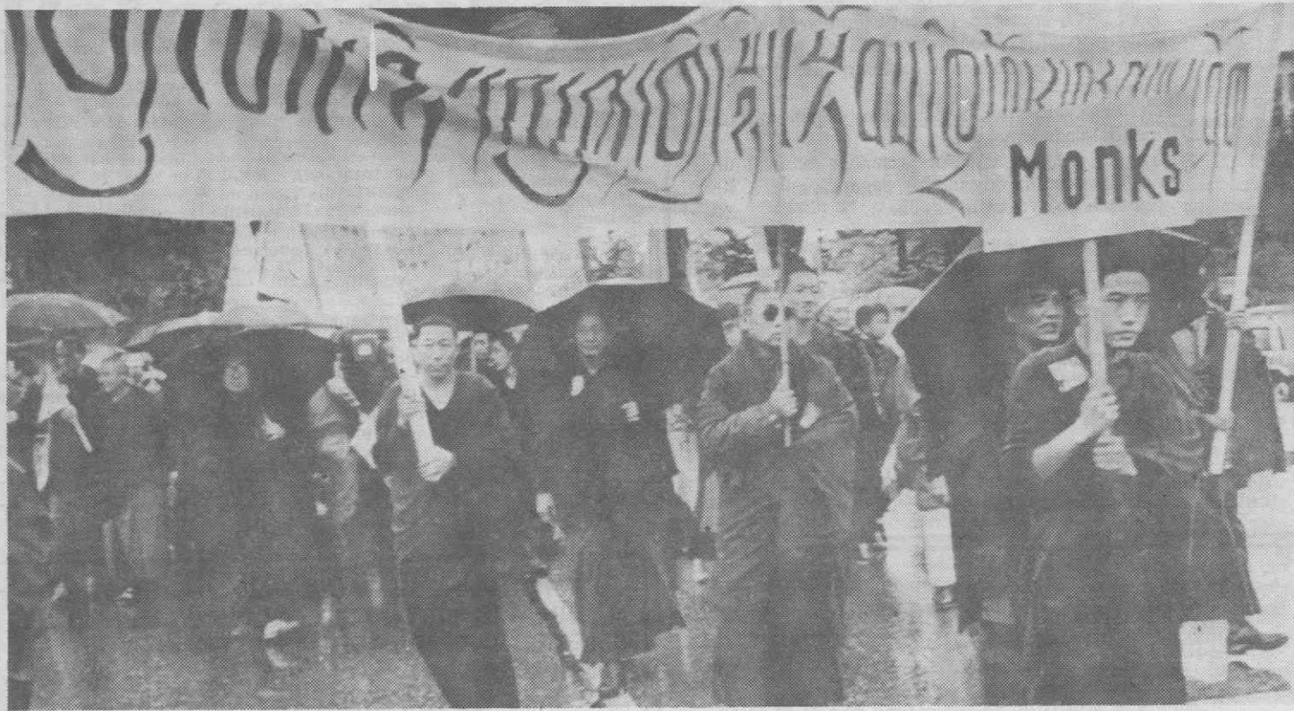
GENEBRA — Manifestação de habitantes do Tibete protestando contra a presença chinesa no Tibete. Tibetanos, liderados por Dalai Lama, continuam inconformados com a perda da independência.

Aquino ordenou a semana passada ao Departamento Nacional de Investigação que averiguasse a notícia do «Morning Herald», depois de ter prometido o mês passado que não toleraria a corrupção entre a sua família e colaboradores mais próximos.