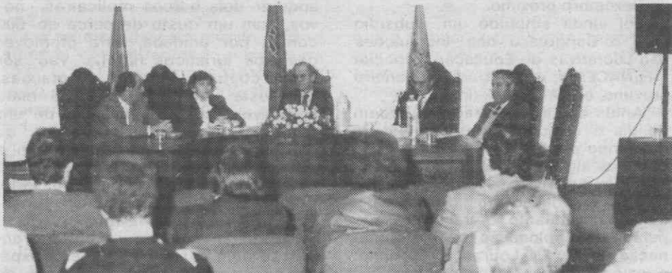
O cooperativismo foi tema da palestra realizada na Câmara Municipal.