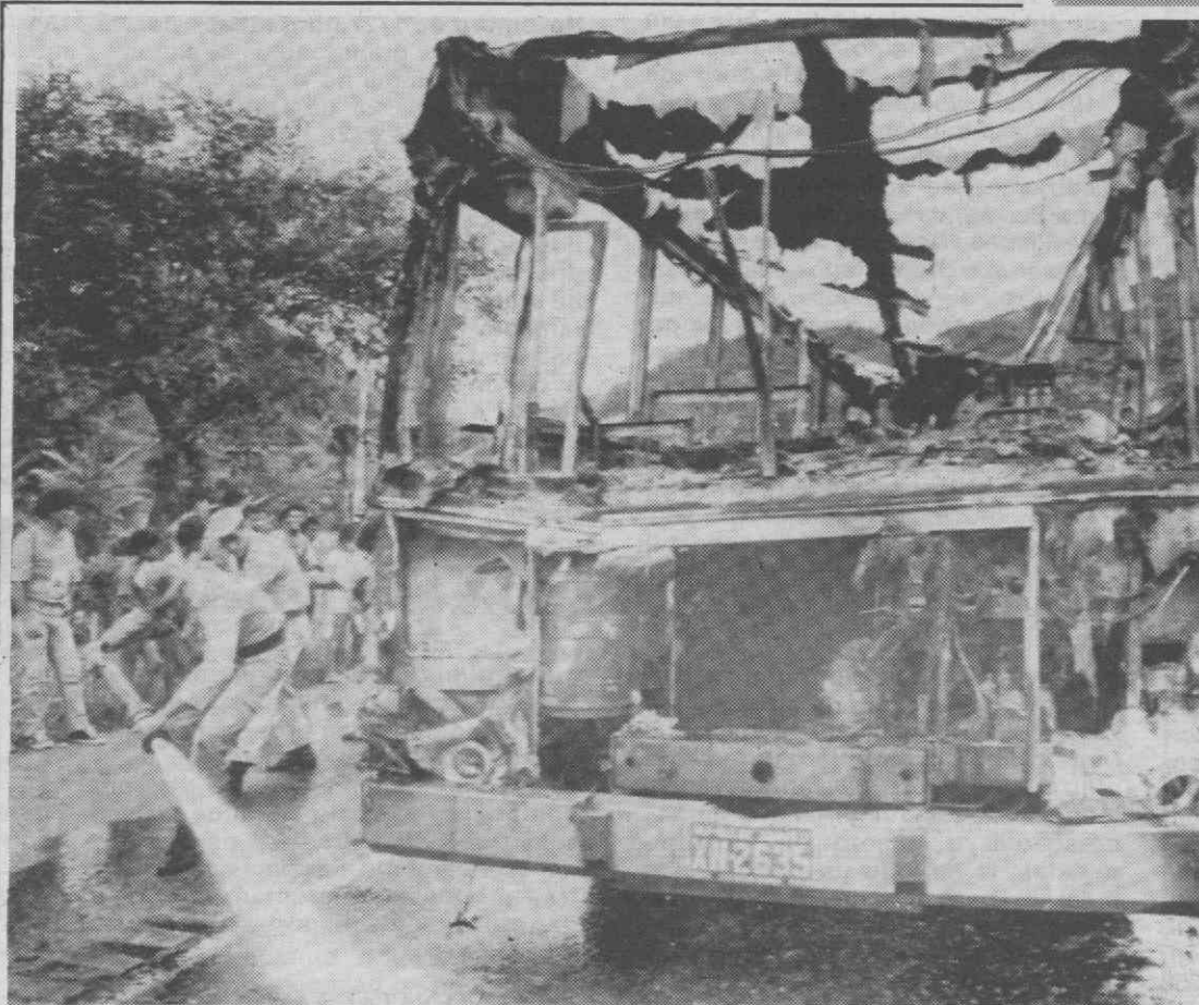
RIO DE JANEIRO — Autocarros foram incendiados pelos utentes para protestar contra a fraca qualidade dos transportes.

No relatório da Comissão afirma-se que o Governo começará a substituí-las logo que a madeira tenha sido vendida.