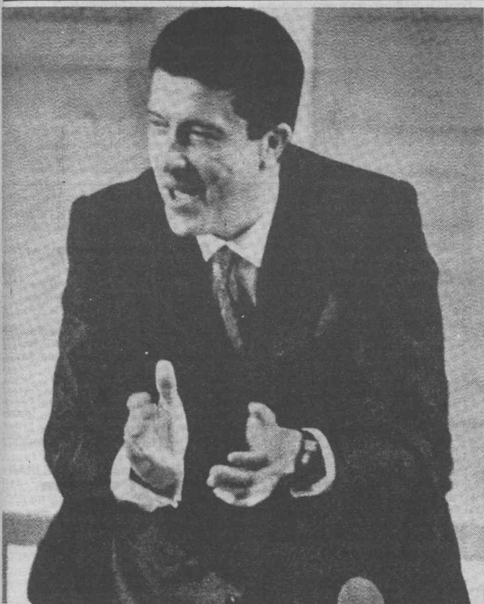
PARIS — O novo Presidente da UNESCO, Frederico M. Zaragoza, discursa perante uma reunião da organização.

Além do Presidente da República, assistiram à abertura oficial do ano lectivo o ministro da Defesa, Eurico de Melo, e o Chefe de Estado-Maior general das Forças Armadas, Lemos Ferreira.