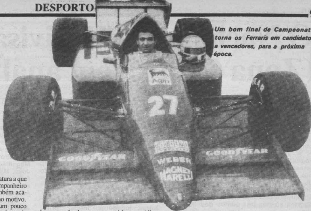
Um bom final de Campeonato torna os Ferraris em candidatos a vencedores, para a próxima época.

Desta maneira mais um piloto subiu às posições pontuáveis, foi ele o também brasileiro Roberto Moreno que foi ao continente australiano pilotar o AGS e conquistar o único ponto para esta equipa, simpática é certo mas que não passa da simpatia. Mais relevante, ainda, foi a conquista