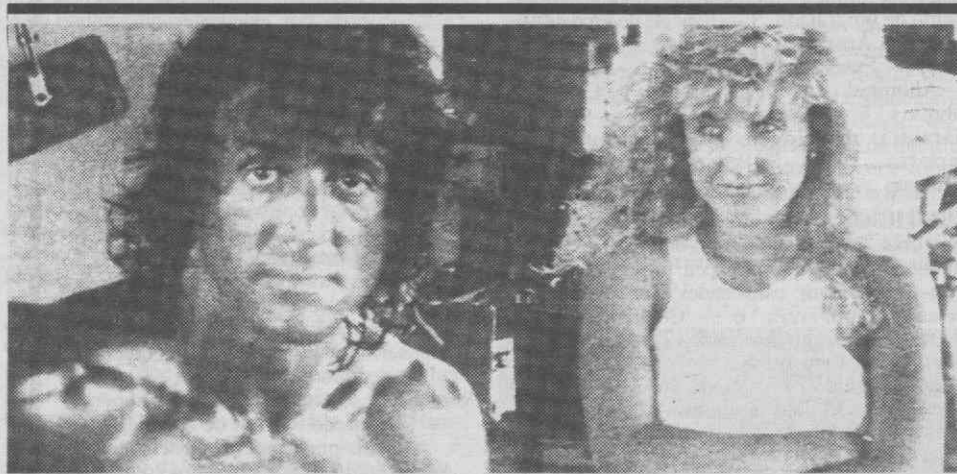
MAR MORTO — O famoso actor norte-americano, Sylvester Stallone, posando durante as filmagens do seu novo filme «Rambo III».

Os outros países africanos com problemas de alimentação são Malawi, Angola, Sudão, Somália, Botswana, Chade, Suazilândia, Tanzânia, Uganda, Zaire, Zâmbia e Zimbábwe.