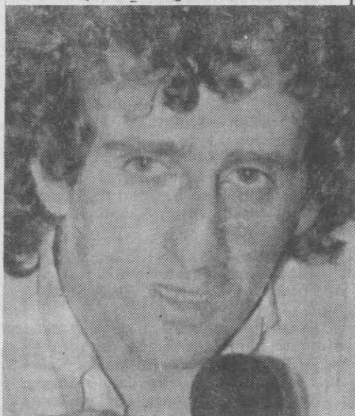
Prost: o tri-campeão destronado.