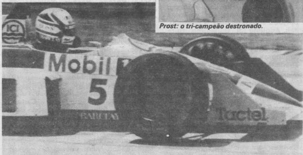
Os Williams dominaram a época, ganhando todos os títulos em disputa.