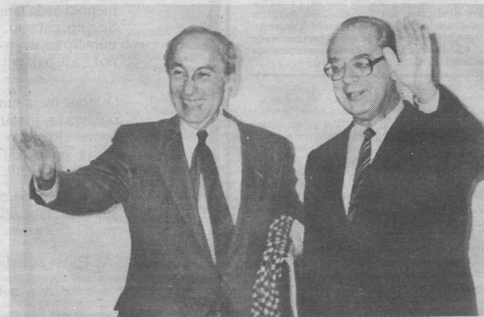
GENEVA — O chefe da delegação norte-americana nas negociações sobre desarmamento, Max Kampelman, com o seu homólogo soviético, Yuli Vorontsov.

Mas Kampelman recusou-se a referir se o texto final do tratado estará pronto na próxima semana.