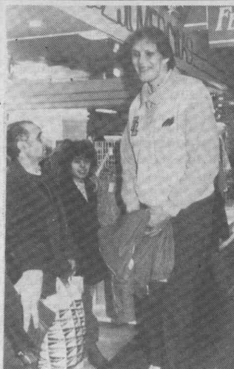
MADRID — A jogadora soviética de basquetebol profissional, Uliana Semenova, com os seus 2,13m de altura, parece atrair as atenções gerais, numa loja. Semenova assinou um contrato com a equipa do Tintoretto, da I Divisão feminina espanhola.

A Bolsa transaccionou ainda 3 mil títulos de participação no valor de 8 mil contos.