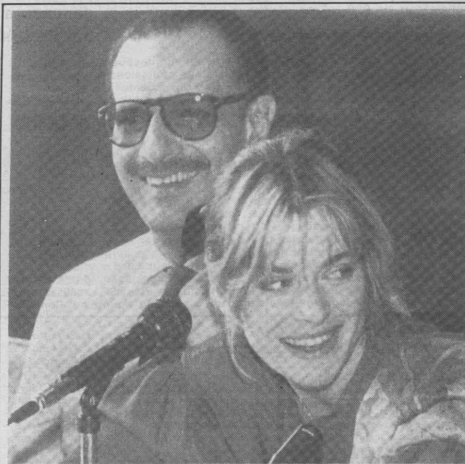
CAIRO — A famosa actriz germânica, Nastassja Kinski, durante uma conferência de imprensa em que anunciou a sua intenção de dirigir um filme.

No período considerado, o total de visitantes entrados por via aérea foi de quase 2 milhões.