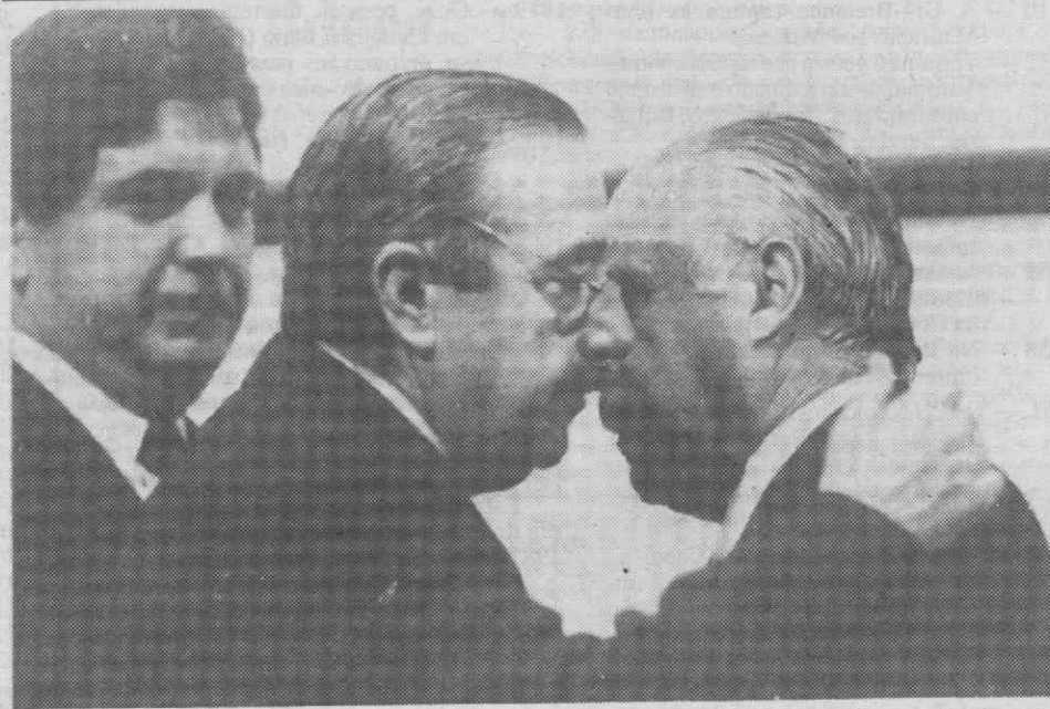
ACAPULCO — Os Presidentes do Brasil e da Argentina abraçando-se após a assinatura de um acordo conjunto dos oito Presidentes latino-americanos sobre as conclusões dos três dias da cimeira.

Este mês, provavelmente no dia 18, realiza-se uma nova sessão de negociações entre a Espanha e os EUA.