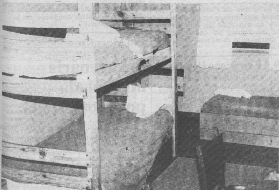
A insuficiência do número de residências universitárias provoca situações em que há necessidade de transformar um quarto duplo em triplo com a colocação de dois beliches.