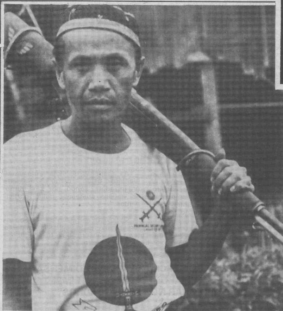
MARAWI, FILIPINAS — Um residente local, armado com uma espingarda automática, preparado para defender a sua casa contra possíveis inimigos.

A praça nortenha movimentou ainda 6.600 títulos em participação, que envolveram 17 mil contos.