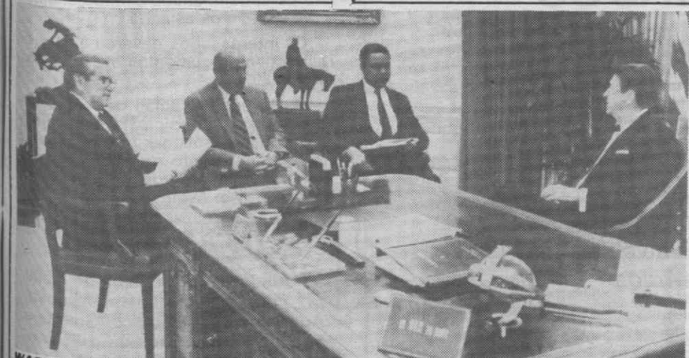
WASHINGTON — O Presidente Reagan recebe Howard Baker, George Schultz e Colin Powell (novo conselheiro sobre Segurança Nacional) para preparar a cimeira com Gorbachov, que se realizará na próxima semana.