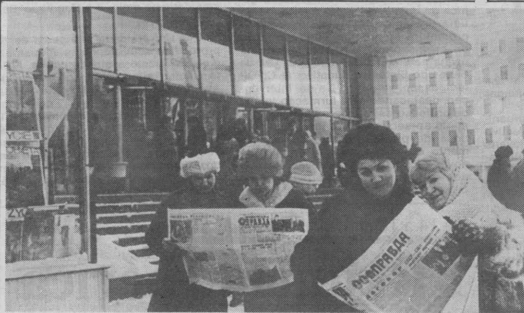
LENINEGRADO — Cidadãos de Leninegrado inteirando-se pelo jornal dos últimos desenvolvimentos da cimeira soviético-norte-americana a decorrer em Washington.

A prisão do suspeito foi confirmada judicialmente, prosseguindo as investigações.