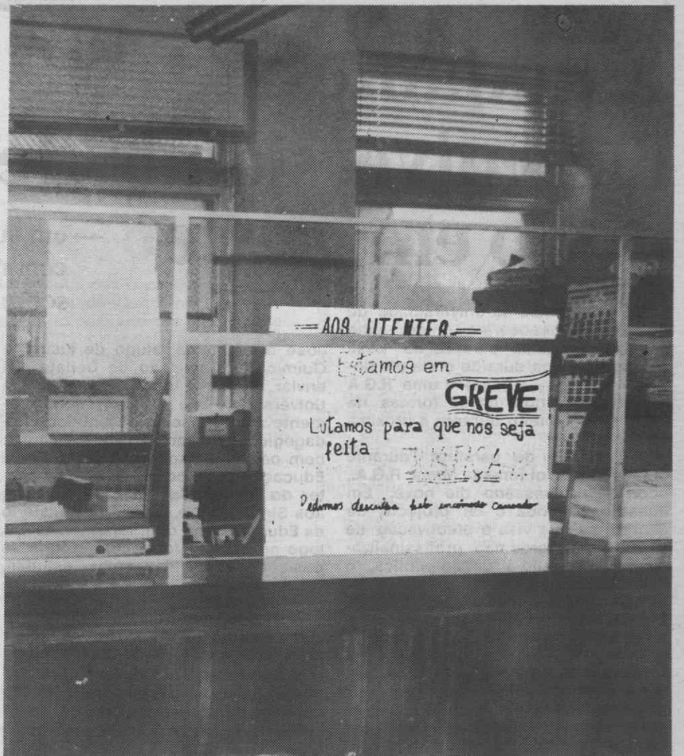
Greve para que haja mais justiça, reclamam os trabalhadores judiciais.

No anteprojecto, elaborado por uma comissão paritária integrando dois dirigentes sindicais e criada em