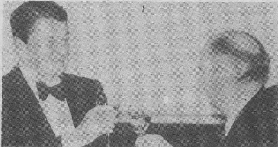
WASHINGTON O Presidente Reagan brinda com o líder soviético, Mikhail Gorbachov, durante o jantar oficial oferecido pelo Presidente norte-americano, na Casa Branca.

A rapidez com que a polícia actuou deve-se ao grande dispositivo de segurança montado nos arredores da Embaixada soviética durante a visita de Gorbachov.