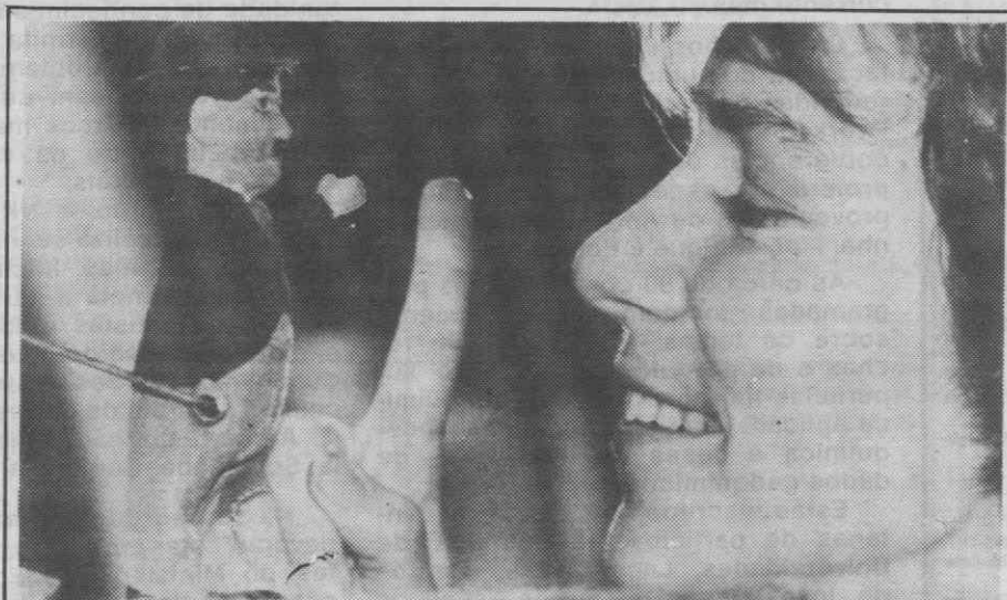
LONDRES — Uma funcionária da casa de leilões londrina Christies, levanta o dedo junto a um raro boneco com o figurino de Charlie Chaplin que se espera ser vendido por 540 dólares.