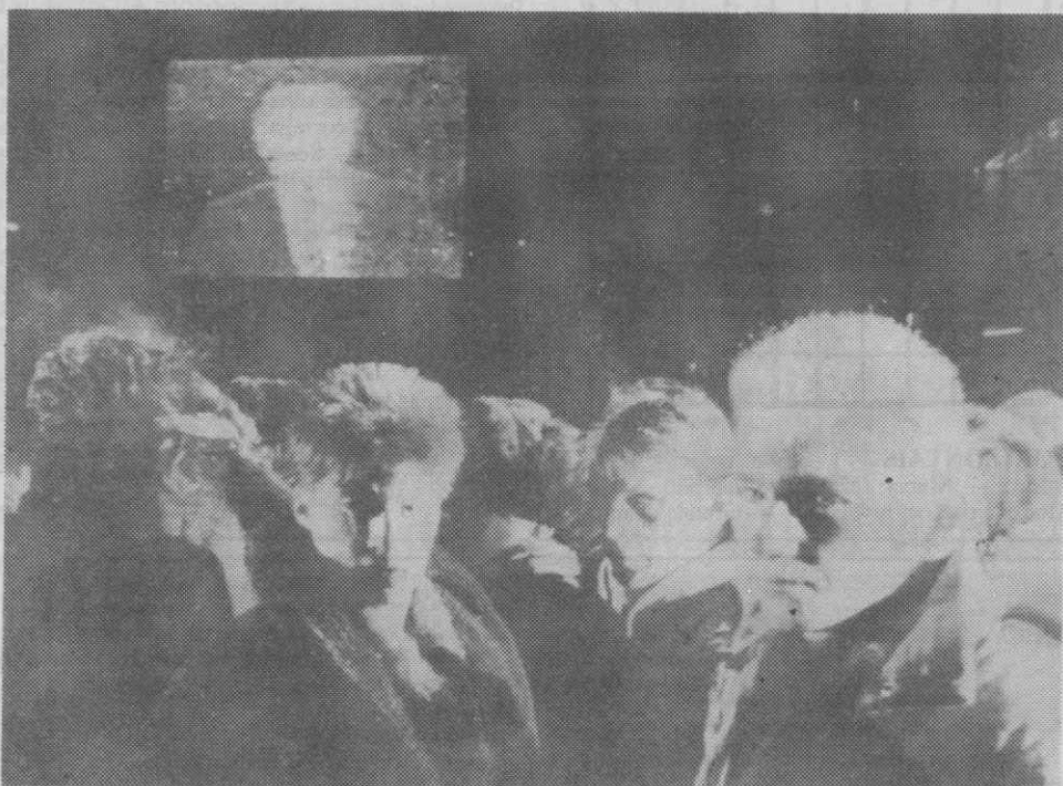
MOSCOVO — Centenas de pessoas seguem a cerimónia de assinatura do acordo de redução de mísseis a decorrer em Washington, na Casa Branca, através de um ecrã gigante.