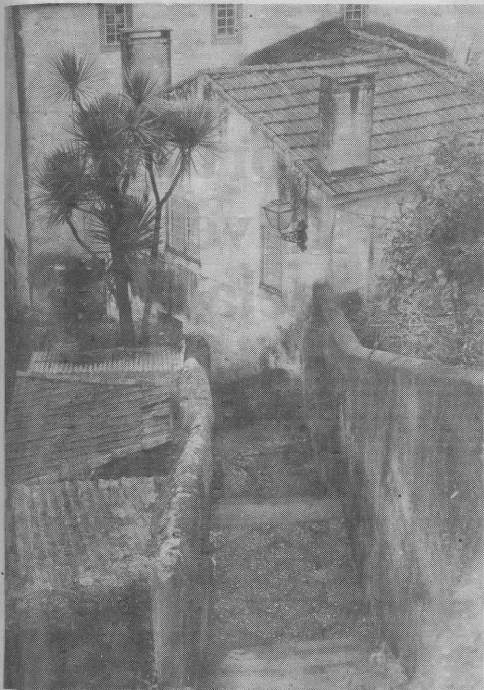
Um aspecto da escadaria do adro.