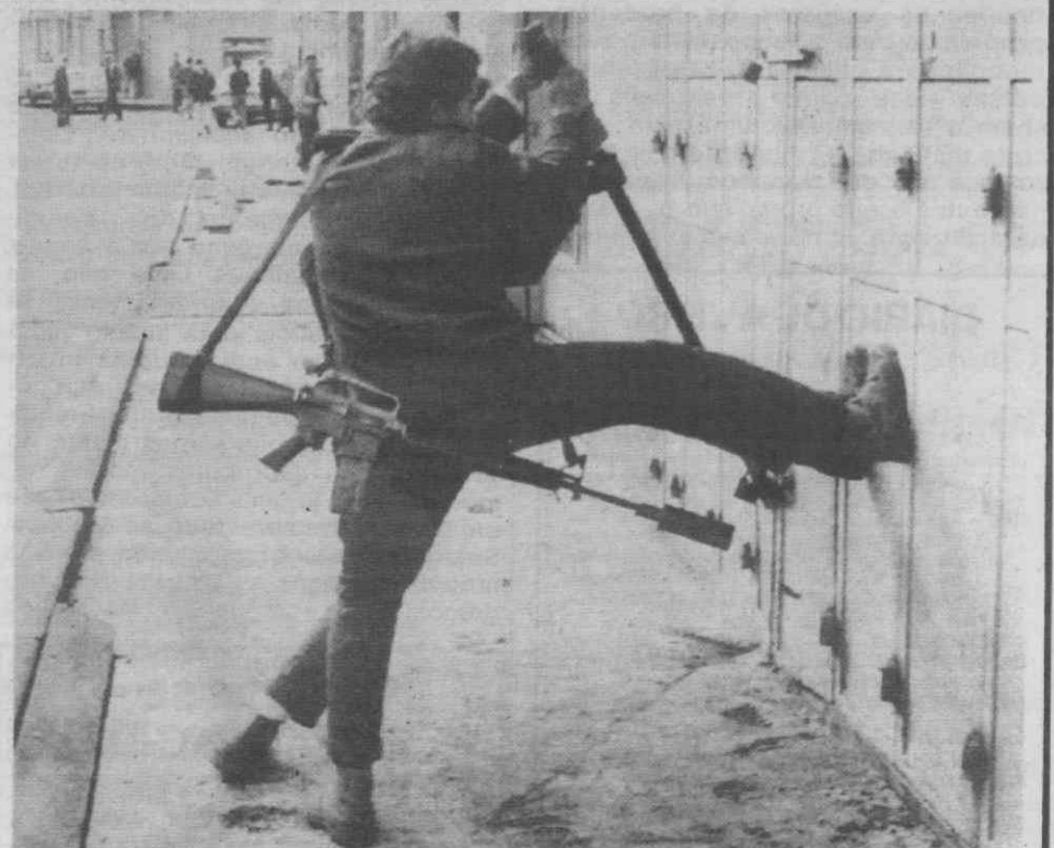
RAMALLAH — Soldados israelitas usando um pé-de-cabra para abrir uma das lojas fechadas durante a greve geral dos comerciantes dos territórios ocupados por Israel.

A Embaixada dos Estados Unidos em Lisboa encontra-se sem titular desde que, no Outono de 1986, o então embaixador Frank Shakespeare foi transferido para o Vaticano e a sua substituição por Richard Noyes Viets encontrou forte oposição no Senado.