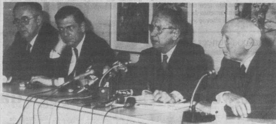
LAUSANNE — O presidente do Comité Olímpico Internacional, Juan Samarach, anuncia em conferência de imprensa, a inscrição de 160 países para as Olimpíadas de Seul.

Alba - Ferreirense Estrela Azul - A.Ac.Espinho