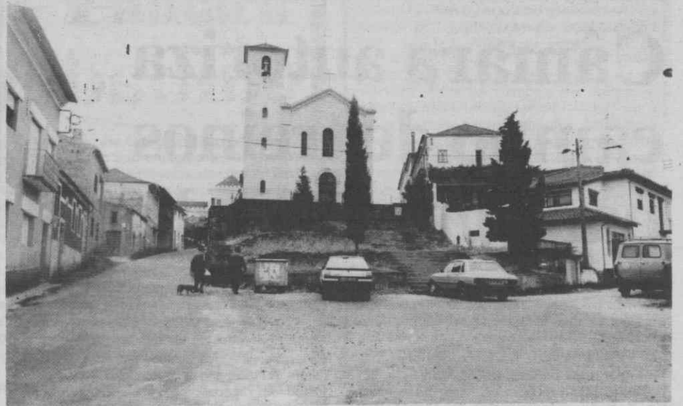
A Câmara de Águeda atribuiu um subsídio de 40 contos à Fábrica da Igreja da Borralha.

Importa salientar que a entrada é gratuita e aberta a todos os interessados.